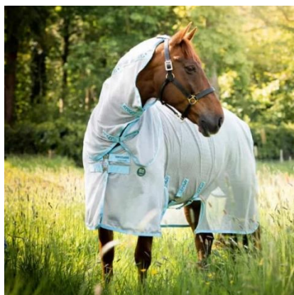
Slika 3. Konj s ljetnim pokrivačem (dekom) na pašnjaku ljeti