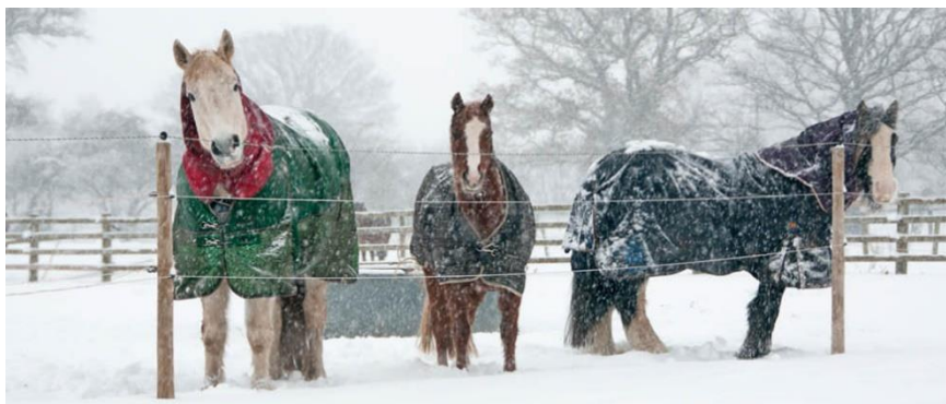
Slika 2. Konji sa zimskim pokrivačima (dekama) u ispustu zimi

Pokrivanje konja ključno je za njihovu udobnost i zaštitu od nepovoljnih vremenskih uvjeta. Različite vrste pokrivača, od laganih ljetnih do teških zimskih (slika 2.), pružaju zaštitu od hladnoće, kiše, vjetrova i insekata. Trajno pokrivanje zdravog konja nikada se ne smije smatrati odgovarajućom zaštitom (Gregić i sur., 2023.). Stari i bolesni konji zahtijevaju individualni pristup, manje su sposobni održavati svoju tjelesnu temperaturu i za to troše više energije, pravilno odabrani pokrivači, značajno pomažu u održavanju tjelesne temperature konja. Naime, zimski pokrivači pomažu konjima da sačuvaju energiju koja bi se inače koristila za grijanje, dok lagani pokrivači omogućuju zaštitu i udobnost u toplijim uvjetima.