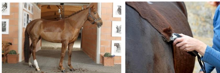
Slika 4. Brijani sportski konja i brijanje konja

Postoji nekoliko tipova brijanja, uključujući potpuno brijanje cijelog tijela, brijanje određenih dijelova ili djelomično brijanje, čime se čuva izolacija dlakom na kritičnim područjima. Osnovna svrha ovog postupka je omogućiti brže sušenje i spriječiti pregrijavanje tijekom napora, osobito u sportskim aktivnostima. Međutim, odluka o vrsti brijanja trebala bi se temeljiti na specifičnim potrebama konja i uvjetima u kojima se on drži i trenira. Na primjer, konji koji sudjeluju u natjecateljskim disciplinama gdje je visoka razina aktivnosti neizbježna, mogli bi imati koristi od potpunog brijanja, dok bi drugi, koji se manje intenzivno koriste, mogli imati koristi od djelomičnog brijanja (slika 4.). Pravilno planiranje brijanja može značajno pridonijeti zdravlju i dobrobiti konja.