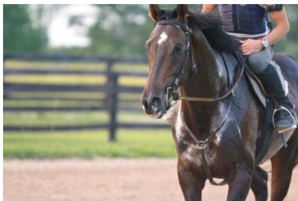
Slika 6. Konj u trenigu pod sedlom, Izvor: Trainer magazine, 2023.