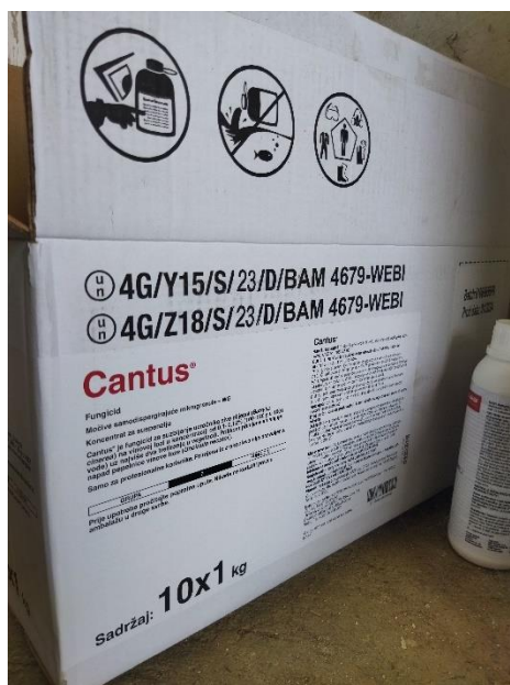
Slika 16. Fungicid Cantus

Collis je kombinirani preventivni fungicid sistemičnog djelovanja, koji sadrži dvije aktivne tvari (krezoksim-metil i boskalid) koje se međusobno nadopunjuju u suzbijanju pepelnice, čime se osigurava sigurna zaštita. Collis (slika 17) je primijenjen 3 puta u vegetaciji u razmacima 10 – 14 dana, a doza je bila 0,3 – 0,4 l/ha.