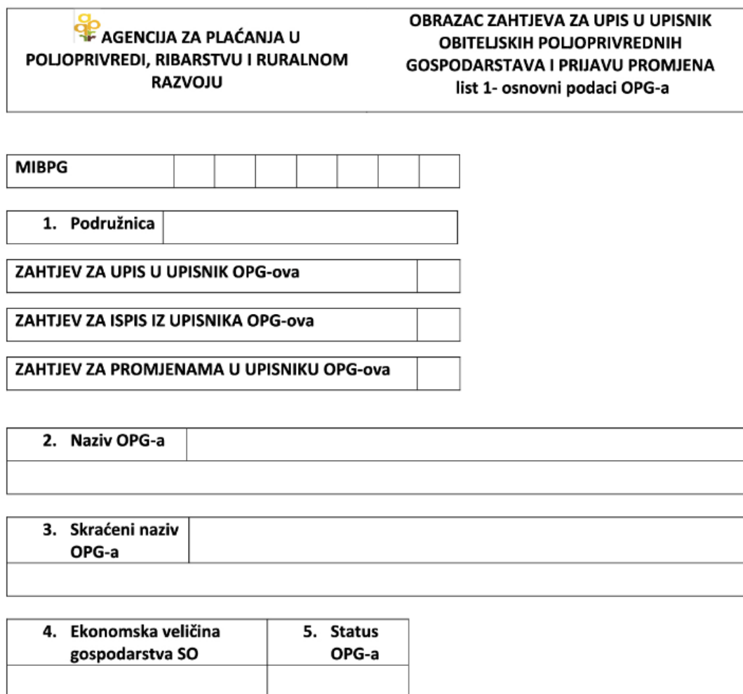
Slika 1. Prva stranica Upisnika obiteljskih poljoprivrednih gospodarstava

podatke o nositelju OPG-a: ime i prezime, OIB, naziv OPG-a i sjedište i drugo (Zakon, 2023.). Na slici 1. prikazana je prva stranica obrasca za upis u Upisnik obiteljskih gospodarstava na kojoj se može vidjeti dio podataka koji su potrebni kako bi se u Upisnik obiteljskih poljoprivrednih gospodarstava upisao OPG. Sve novonastale promjene koje se dogode nakon upisa unose se elektronički putem kroz AGRONET te se zapis ispisuje i potpisan od stane nositelja OPG-a predaje u Agenciju za plaćanje.