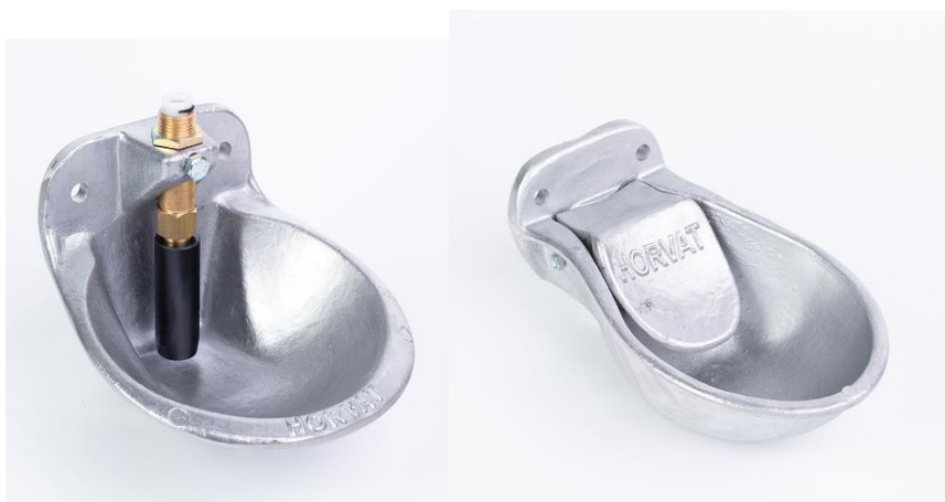
Slika 3. Pojilice s posudom