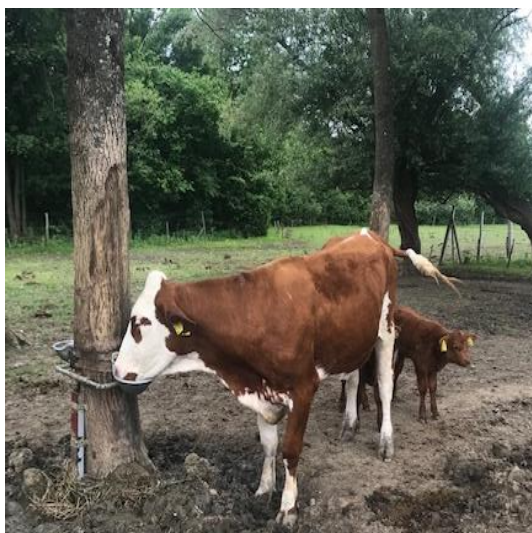
Slika 5. Pojilica na ispustu