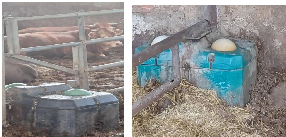
Slika 8. Pojilice s plovkom na farmi tovne junadi