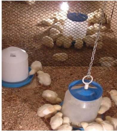
Slika 1. Zvonasta pojilica za perad