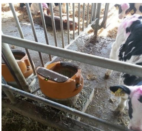
Slika 7. Pojedinačna pojilica za telad