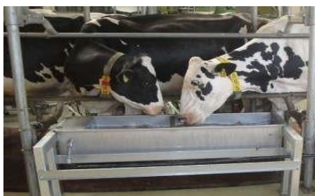
Slika 6. Grupna pojilica za goveda

Pojilice se u staju postavljaju na način kako ne bi ometale prolazak goveda, da ih je moguće lako očistiti i održavati, da imaju dostatan dotok vode te da je u njima voda zaštićena od zamrzavanja pri niskim temperaturama, moraju imati takav položaj u staji da životinja ne mora čekati na vodu predugo te bi svakako trebalo izbjegavati guranje životinja pred pojilicama ili međusobno uznemiravanje (Ivanković i Mijić, 2020.; Domaćinović i sur., 2019.). Ako govorimo o slobodnom sustavu držanja, često se koriste grupne pojilice velike zapremine od 100 do 200 litara (Slika 6.) kod kojih je potrebno osigurati dužni metar pojilice na svakih 12 do 15 krava ili 2 dužna metra pojilice na 25 krava. Ove grupne pojilice postavljaju se na bočne prolaze, površine za odmaranje ili uz stijenke ispusta. Za manje skupine goveda koriste se često pojedinačne pojilice (Slika 7.) dubine 5 – 10 cm, promjera 20 – 30 cm. Osim njih često su u upotrebi i pojilice s plovkom (Slika 8.). Svakako bi trebalo voditi računa da se pojilice postave na veće udaljenosti unutar staje kako bi bilo što manje međusobnog uznemiravanja, ali i kako bi potaknuli goveda na više kretanja kroz staju (Ivanković i Mijić, 2020.).