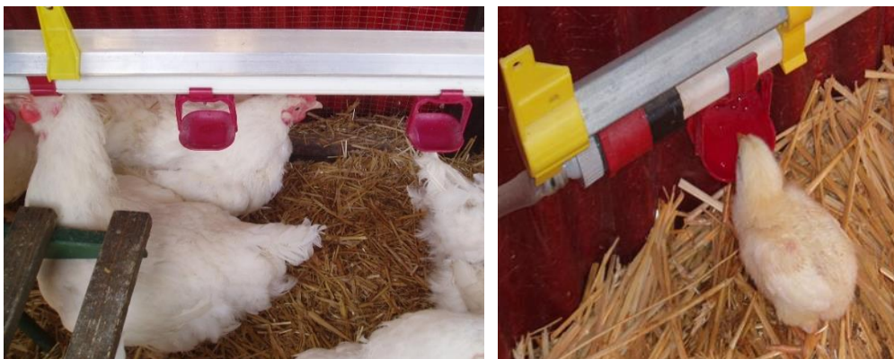
Slika 2. Automatske pojilice za perad s čašicom

Na velikim farmama pri intenzivnom načinu uzgoja primjenjuje se automatski način napajanja (Slika 2.) uz pomoć tzv. „nipl“ pojilica. Sustav automatskog napajanja svakako za svoj rad treba imati priključak na vodovodnu mrežu ili neki vlastiti izvor pitke vode odakle se crpi voda potrebna za napajanje. Koriste se razne izvedbe automatskih pojilica za perad, ovisno o konstrukciji one mogu biti pojilice otvorenog tipa za skupno napajanje ili pojilice zatvorenog tipa, za pojedinačno napajanje. Na Slici 2. prikazane su automatske pojilice (nipl) za perad s čašicom koja služi za zadržavanje vode za vrijeme napajanja kako ne bi došlo do prekomjernog vlaženja stelje te sprječavanja rasipanja vode. Vlažna stelja je izvrstan pokazatelj neadekvatnog postavljanja pojilica odnosno da su one postavljene suviše visoko ili suviše nisko za pojedinu kategoriju peradi (Domaćinović i sur., 2015.; Kralik i sur.,2008.).