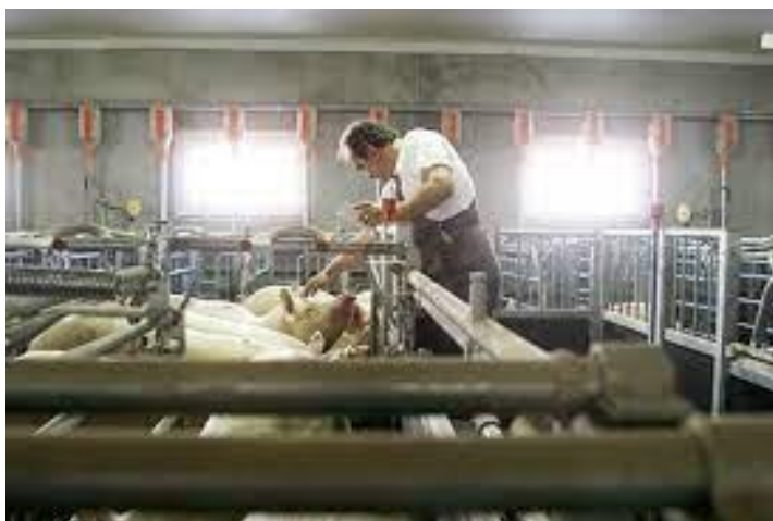
Slika 9. Svinjogojstvo-belje

U budućnosti, strategije poput provedbe isplative strategije hlađenja, genetika uzgoja s boljom otpornošću na toplinu i ostalo, također treba istražiti. Naravno, sve navedeno trebala bi biti povezano sa strategijama za preokret globalnog tempa zagrijavanja (Liu i sur., 2021.).