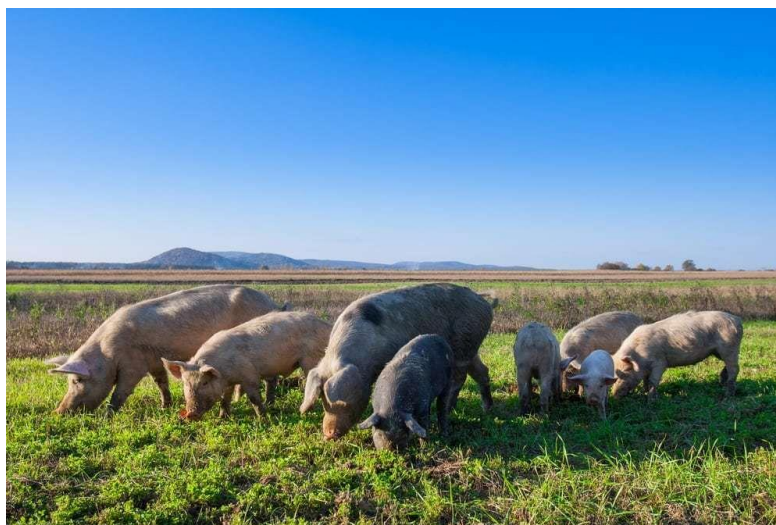
Slika 6. Vlaku u hranidbi svinja

S obzirom na fiziološke razlike kod svinja pod toplinskim stresom, ljetni obroci trebaju biti prilagođeni kako bi zadovoljili potrebe svinje tijekom razdoblja povišene temperature. Izdana knjiga „Nutrient Requirements of Swine” objavljen 2012. uključuje softver koji ima funkciju prilagođavanja potreba za hranjivim tvarima svinje jer temperatura raste do granice od 30° C. Međutim, ova je funkcija uglavnom razvijena za kompenzaciju smanjenog unos hranjivih tvari predviđanjem smanjenja unosa hrane na zadanu temperaturu (Pearce i sur., 2013.).