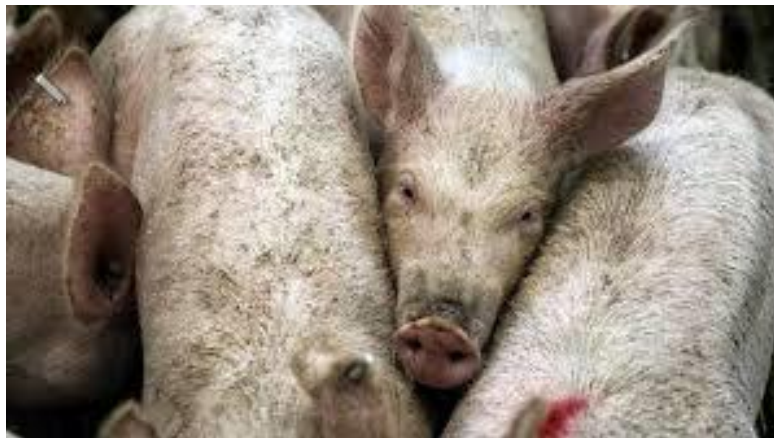
Slika 1. Stres svinja u boksu

Stres se prema trajanju izloženosti stresoru dijeli na akutni i kronični. Akutni stres, iako je kratkotrajan, može dovesti do promjene bioloških funkcija i to na dva načina. Prvi je poremećajem kritičnih bioloških trenutak, a drugi preusmjeravanjem energetske resursa (Moberg i Mench, 2000.).