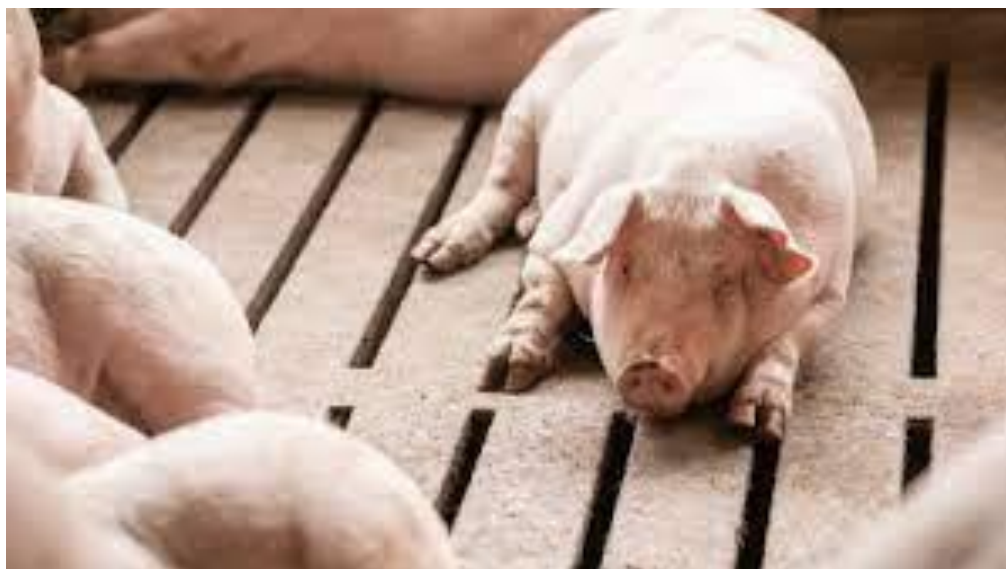
Slika 2. Toplinski stres svinja

dijeta visoke gustoće može biti učinkovito i ublažiti učinak toplinskog stresa, posebno kod završnih svinja ili krmača u laktaciji, ali samo kada su dijete ispravne i pravilno uravnotežene. Optimalna proizvodnja svinja pod toplinskim stresom zahtijeva odgovarajuća rješenja te kombinacije hranidbe i upravljanja (Holmes i Grace, 2007.).