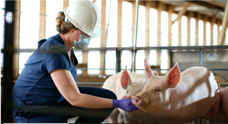
Slika 4. Pregled svinja po boksovima