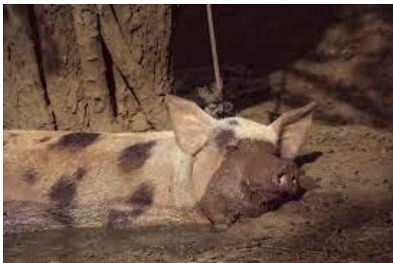
Slika 5. Rashlađivanje svinja