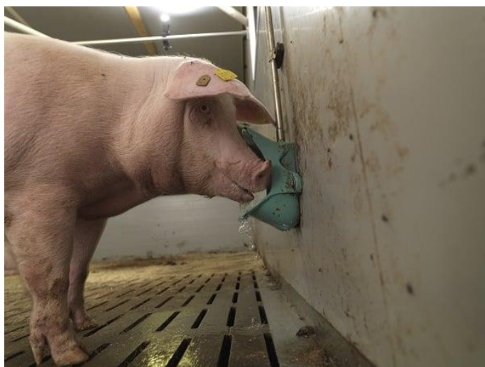
Slika 3. Rashlađivanje svinja vodom

Proces raspodjele protoka krvi zahtijeva približno jednako smanjenje dotoka krvi u druge organe ili tkiva. Životinje koje su toplinskom stresu izložene, nedostaje sposobnost mobilizacije masti kao izvora energije. Objašnjenje za oslabljenu mobilizaciju lipida je pojačana regulacija lučenja inzulina. Inzulin je antilipolitik hormona i pojačanih odgovora tijekom testova tolerancije glukoze. Oni su primijećeni kod preživača izloženih toplinskom stresu (O'Brien i sur., 2010.; Wheelock i sur., 2010.)