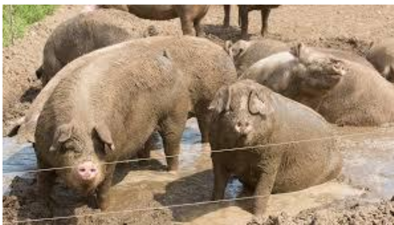
Slika 8. Rashlađivanje svinja

Troškovi proizvodnje su također jedan od važnih čimbenika proizvodnog cilusa. Oni uključuju hranu, veterinarske usluge, energiju i radnu snagu. Cijene hrane mogu biti promjenjive i mogu znatno utjecati na profitabilnost svinjogojske proizvodnje. Visoki troškovi energije također mogu negativno utjecati na profitabilnost. Svinjogojska proizvodnja može imati negativan utjecaj na okoliš zbog proizvodnje otpada, emisija plinova stakleničkih plinova i potrošnje vode. Stoga, pritisak na okoliš može utjecati na perspektivu svinjogojske proizvodnje i potaknuti razvoj održivih praksi u proizvodnji. Promjene u društvu, također, mogu utjecati na perspektivu svinjogojske proizvodnje. Na primjer, sve veći broj ljudi zanima se za etičku i održivu proizvodnju hrane te traže proizvode s minimalnom količinom aditiva i antibiotika. Ovo može utjecati na način na koji se svinje uzgajaju i hrane, a time i na perspektivu svinjogojske proizvodnje (Rauw i sur. 2020.)