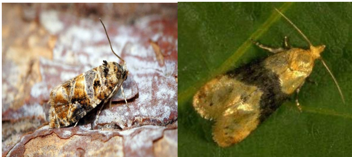
Slika 12. Žuti i pepeljasti grozdovi moljci

Žuti i pepeljasti grozdov moljci, Eupoecilia ambiguella i Lobesia botrana , predstavljaju ozbiljne prijetnje vinogradima u Hrvatskoj, izazivajući značajne direktne i indirektne štete. Ovi moljci, koji pripadaju skupini savijača, postali su fokus vinogradara zbog njihovog potencijala uzrokovati gubitke prinosa i poticati sekundarne napade gljivičnih bolesti.