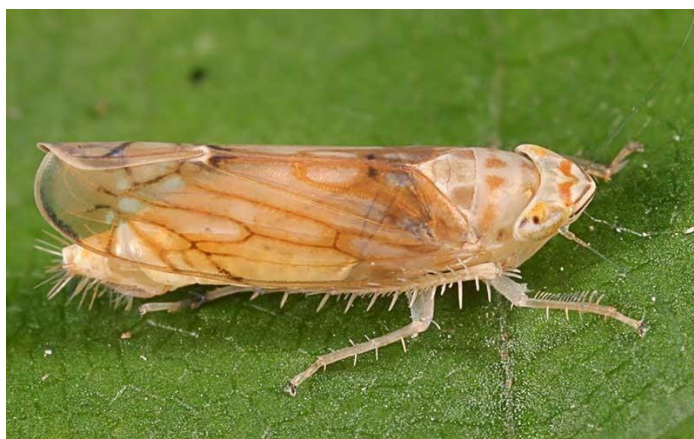
Slika 13. Američki cvrčak