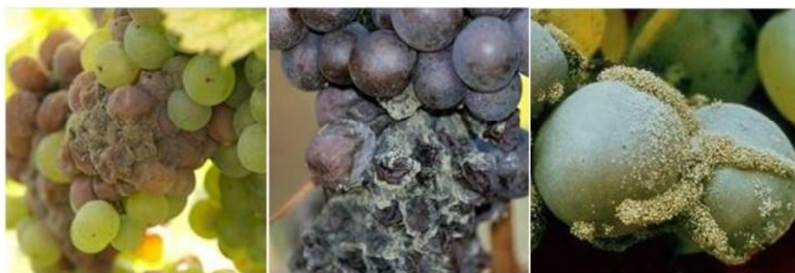
Slika 5. Simptomi sive plijesni na vinovoj lozi

Prva faza bolesti, poznata kao faza zelene plijesni, odvija se na ostacima cvjetova i grozdčićima. Parazitska faza, tj. faza sive plijesni, započinje na zelenim bobicama, progresivno šireći hife i stvarajući karakterističnu sivu prevlaku. Siva trulež najviše prijete u stadiju dozrijevanja grožđa, uzrokujući sivu trulež bobica i cijelih grozdova. Osim što može značajno umanjiti kvalitetu vina, ovaj parazit može prouzročiti ozbiljne štete koje se očituju nekrozama, posebice na bobicama. Oštećenja se često pojavljuju u fazi zelene plijesni, na ostacima cvjetova i grozdčićima, a napad se može proširiti na ostale dijelove vinove loze (Licul isur., 1993.).