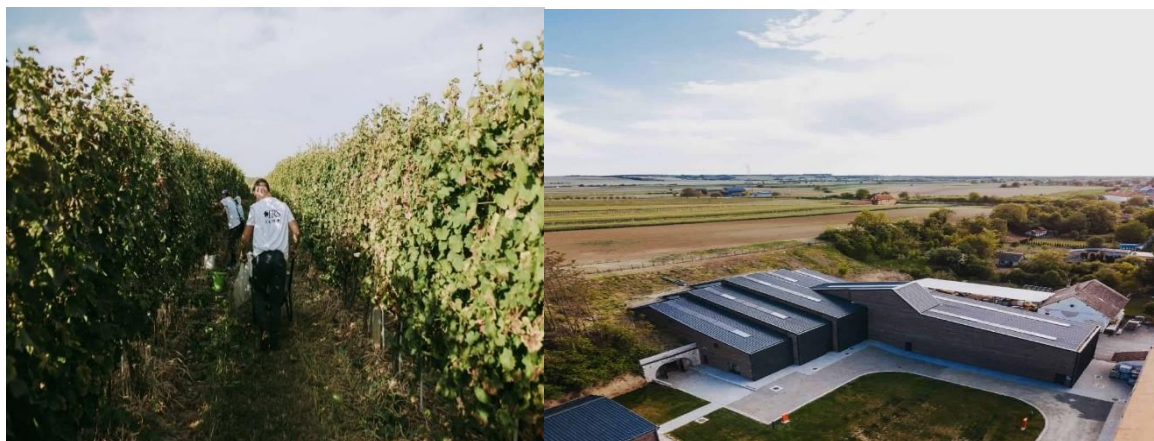
Slika 14. Vinogradi zadruge TRS

Vinogradi su smješteni na padinama Fruške Gore - Vinogorja Srijem, a zahvaljujući povoljnim uvjetima, poput sunčanih sati, brežuljaka i ocjernih tala, vinova loza daje grožđe visoke kvalitete. Vinarija TRS uzgaja devet sorti, s naglaskom na bijelim sortama poput graševine, chardonnaya , rajnskog rizlinga i drugih, te crnim sortama poput frankovke, cabernet sauvignona i cabernet franca . Suradnja s gospodinom Ilijonom Tokićem iz Sesveta kao ulagačem i strateškim partnerom proširila je horizonte vinarije na tržištu i omogućila joj veći utjecaj.