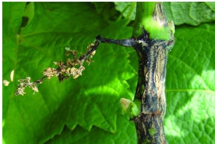
Slika 6. Simptomi crne pjegavosti rozgve

Infekcija piknosporama može se dogoditi u širokom rasponu temperatura, optimalno pri temperaturi od 23 °C uz visoku relativnu vlažnost zraka (Brmež i sur., 2010.).