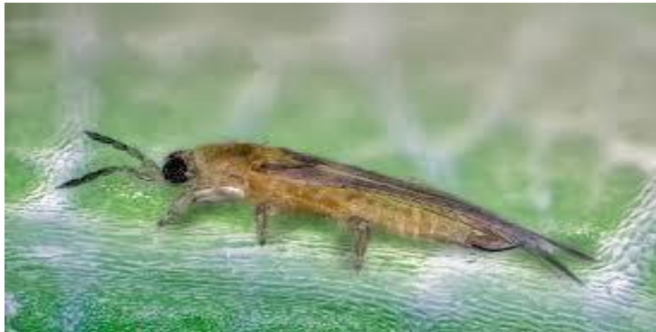
Slika 10. Lozin trips

do 10 dana, ličinke izlaze i hrane se na naličju lista i u grozdićima. Razvojni ciklus traje od 6 do 9 dana, a više generacija godišnje doprinosi širenju šteta (Blesić i sur., 2013.).