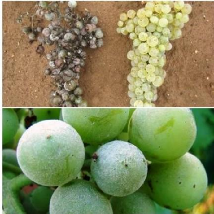
Slika 4. Simptomi pepelnice vinove loze

Preventivna zaštita započinje odabirom otpornih sorti, ali važnu ulogu igraju i agronomske prakse poput postavljanja redova u smjeru vjetrova, plijevljenja mladica s prošlogodišnjeg drva te zalamanja zaperaka za poboljšanje provjetravanja.