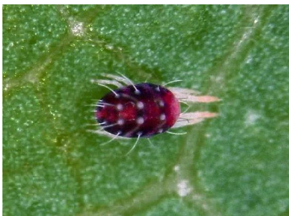
Slika 9. Crveni voćni pauk