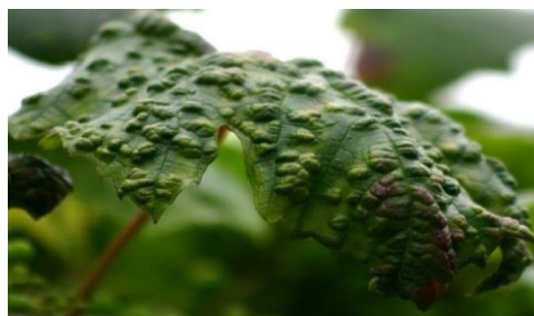
Slika 8. Lozine grinje

Calepitrimerus vitis i Eriophyes vitis imaju različite biološke cikluse. Tako Calepitrimerus vitis ima od 3 do 5 generacija godišnje, dok Eriophyes vitis može imati i do 7 generacija godišnje. Ženke lozinih grinja prezime ispod kore trsa ili na pupu, gdje odlažu jaja čiji se razvoj odvija u desetak dana (Maletić i sur. 2008.). Razvojni stadiji uključuju ličinke, nepokretne nimfe i odrasle oblike, a njihova aktivnost naglašava se tijekom vegetacije i značajno ovisi o temperaturi okoline. Akarinoze uzrokovane lozinim grinjama, poput Calepitrimerus vitis , manifestiraju se kroz ubode uslijed sisanja na listu. Oštećenja uključuju: smeđenje, uginuće i pojavu izboja sa skraćenim internodijima. Listovi postaju šuplji, deformirani, a rubovi uzdignuti i tamni. Mjesta uboda suše se, ispadaju i ostavljaju list šupljikavim. Ova vrsta grinje može uzrokovati najveće štete tijekom hladnijeg proljetnog vremena, prouzročujući oštećenja čak i kad je razvoj loze usporen.