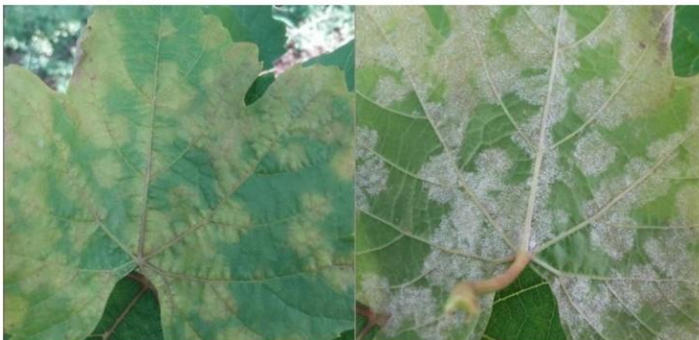
Slika 3. Simptomi plamenjače na listu