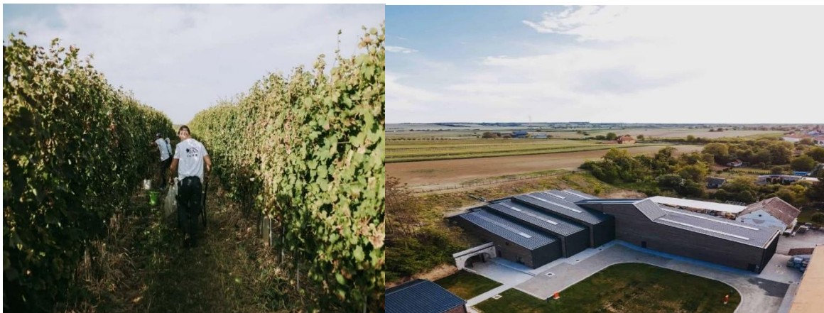
Slika 14. Vinogradi zadruge TRS

Vinogradi su smješteni na padinama Fruške Gore - Vinogorja Srijem, a zahvaljujući povoljnim uvjetima, poput sunčanih sati, brežuljaka i ocjernih tala, vinova loza daje grožđe visoke kvalitete. Vinarija TRS uzgaja devet sorti, s naglaskom na bijelim sortama poput graševine, chardonnaya , rajnskog rizlinga i drugih, te crnim sortama poput frankovke, cabernet sauvignona i cabernet franca . Suradnja s gospodinom Ilijonom Tokićem iz Sesveta kao ulagačem i strateškim partnerom proširila je horizonte vinarije na tržištu i omogućila joj veći utjecaj.