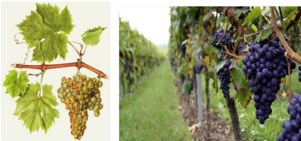
Slika 1. Vinova loza ( Vitis Vinifera )

mora i Kaspijskog jezera. Ovaj proces odabira i uzgoja divlje loze rezultirao je stvaranjem kultivara vinove loze prilagođenih potrebama čovjeka i različitim uvjetima uzgoja. Vinova loza, posebice vrsta Vitis vinifera L., izuzetno je važna gospodarska biljka. Njezini plodovi koriste se ne samo kao voće nego i za proizvodnju vina, sušenje grožđa te za izradu različitih prehrambenih proizvoda i farmaceutskih pripravaka (Kantoci, 2008.). Korištenje zaštitnih sredstava u vinogradarstvu ima ključnu ulogu u suzbijanju bolesti i štetnika kako bi se postigao optimalan urod vinove loze te očuvala dugovječnost vinograda. Cilj je osigurati održivost vinogradarstva, stvaranje kvalitetne sirovine za proizvodnju vina i zaštitu vinove loze od prijetnji koje se javljaju na specifičnom području. S obzirom na izvor podloge vrste roda Vitis , poput Vitis berlandieri , Vitis riparia , Vitis rupestris i Vitis labrusca , vinogradarstvo postaje kompleksna disciplina koja zahtijeva poznavanje raznolikosti i prilagodljivost. Porodica Vitaceae obuhvaća širok spektar roda i vrsta, a najveći broj vrsta pripada rodu Vitis (Bišof i Herjavec, 1996.).