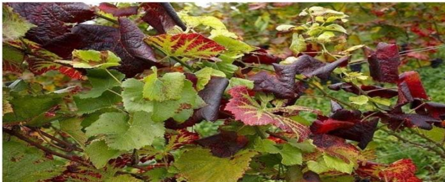
Slika 7. Simptomi crne pjegavosti rozgve