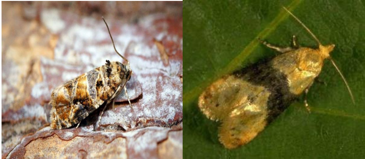
Slika 12. Žuti i pepeljasti grozdovi moljci

Žuti i pepeljasti grozdov moljci, Eupoecilia ambiguella i Lobesia botrana , predstavljaju ozbiljne prijetnje vinogradima u Hrvatskoj, izazivajući značajne direktne i indirektne štete. Ovi moljci, koji pripadaju skupini savijača, postali su fokus vinogradara zbog njihovog potencijala uzrokovati gubitke prinosa i poticati sekundarne napade gljivičnih bolesti.