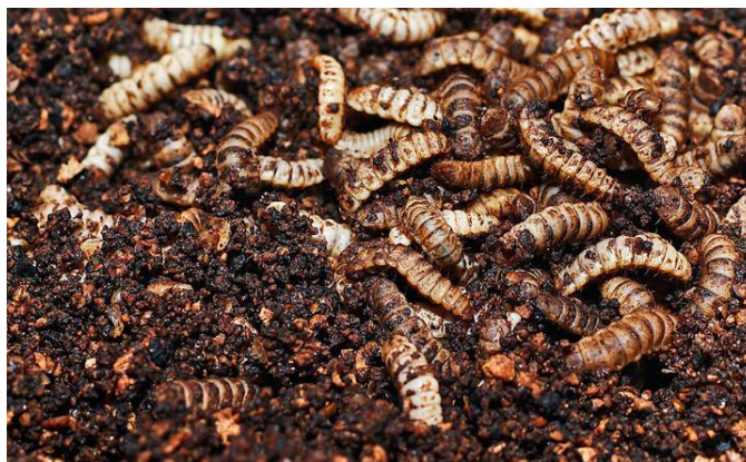
Slika 1: Ličinke crne vojničke muhe ( Hermetia illucens )

Kukci su izuzetno dobri bio-konverteri koji mogu transformirati biomasu niske kvalitete u nutritivno vrijedne bjelančevine. Crna vojnička muha ( Hermetia illucens ) je muha ( Diptera ) iz porodice Stratiomyidae . Prvotno stanište bila su joj područja tropskih i suptropskih klima, ali se brzo raširila diljem svijeta (Müller i sur., 2017.). Ličinke crne vojničke muhe ( Hermetia illucens ) bogate su visokokvalitetnim proteinima, esencijalnim aminokiselinama i masnim kiselinama koje su ključne za zdrav rast i razvoj peradi (Slika 1.).