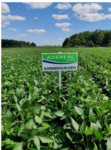
Slika 11. Eksperimentalne sorte (Prša F., 2023.)

Sorte RGT Stocata, RGT Straviata i LID Survivor pokazuju odlične osobine i potencijal veći od ES Palladora. U 2022. i 2023. godini vremenske prilike nisu bile povoljne za uzgoj soje, stoga soja nije uspjela doseći svoj puni potencijal rodnosti.