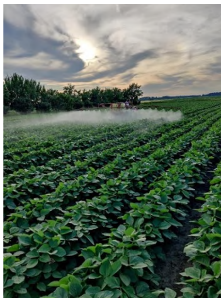
Slika 9. Folijarna prihrana soje u početku cvatnje 25.06.2020.