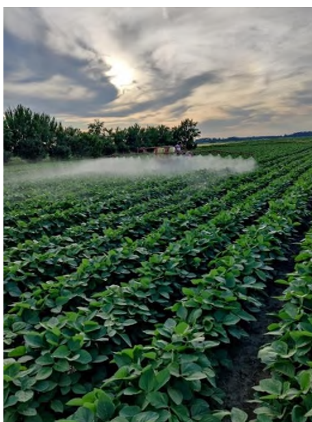
Slika 9. Folijarna prihrana soje u početku cvatnje 25.06.2020.