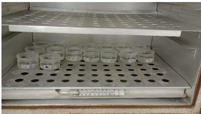
Slika 4 – Zdjelice u sušioniku

Nakon uklanjanja mjernih stanica s terena, prikupljeni sadržaj je ispran vodom i prebačen u petrijeve zdjelice. Zdjelice su zatim smještene u sušionik kako bi isparila preostala voda korištena tijekom ispiranja i prijenosa uzoraka (slika 4), a nakon toga je izmjerena suha masa materijala kojeg je svaka stanica prikupila.