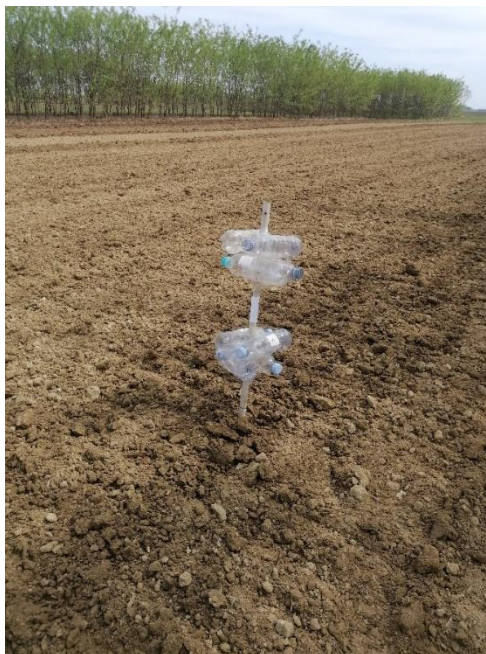
Slika 3 – Mjerna stanica za skupljanje lebdećih čestica

visinama od 15 i 50 cm; sve su imale mjerenje na 15 cm, dok su četiri od njih također mjerile na visini od 50 cm.