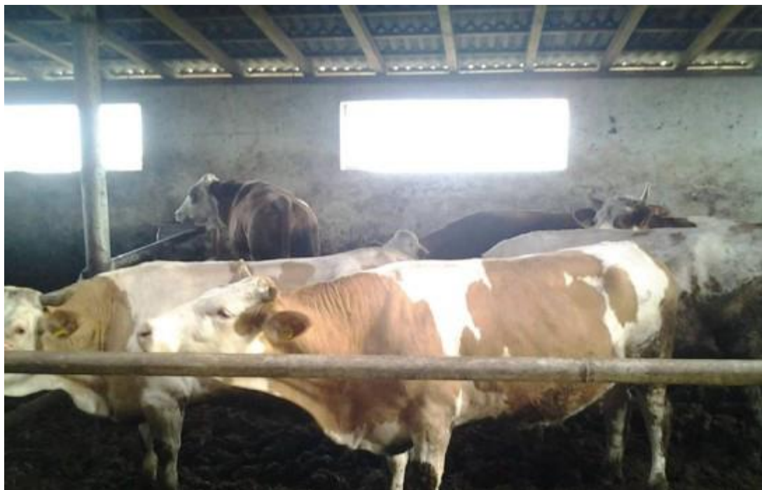
Slika 7. Krava simentalске pasmine

Gospodarstvo posjeduje stado od 27 muznih krava simentalске pasmine, prosječne težine 600 – 700 kg ( Slika 7.). Deset junica u dobi od 12 – 24 mjeseca starosti prosječne težine 400 – 500 kg te 4 teleta u starosti do šest mjeseci a prosječne težine 100 – 200 kg ( Slika 8 ). Žensku telad ostavljaju za remont stada a mušku telad prodaju u starosti od 15 dana.