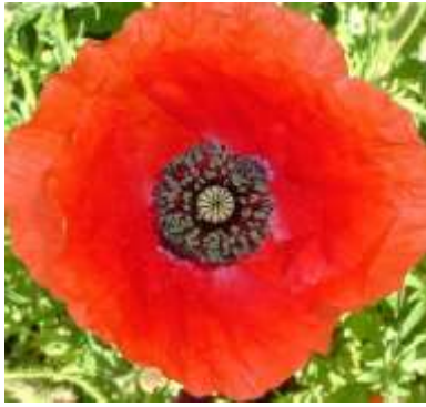
Slika 15.: Papaver rhoeas „Red Legion“