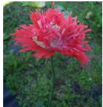
Slika 20.: Papaver somniferum „Oase“