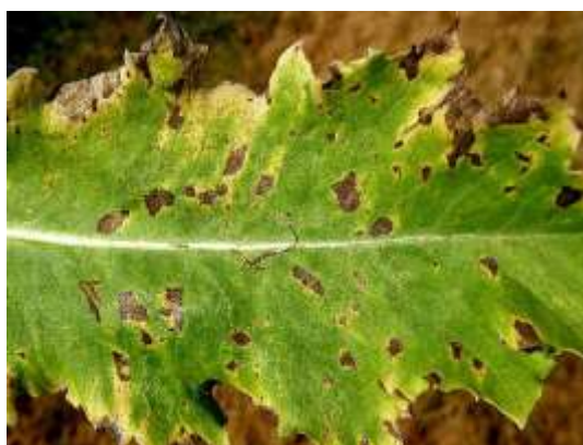
Slika 10.: Crna pjegavost maka ( Helminthosporium papaveris )

Osim plamenjače maka, u našim klimatskim uvjetima za mak može biti vrlo opasna i štetna crna pjegavost maka. Ova bolest se najčešće prenosi zaraženim biljnim ostacima od prethodne godine i zaraženim sjemenom, pa je za suzbijanje ove bolesti važno sijati samo zdravo i tretirano sjeme, te se pridržavati plodoreda (4 – 5 godina). Također je potrebno izbjegavati pregusti sklop, ukloniti bolesne biljke iz usjeva te provesti adekvatnu gnojidbu. Uzgoj maka ne preporuča se u vlažnim područjima te na teškim i nepropusnim tlima.