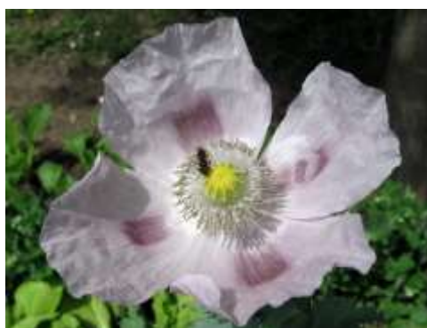
Slika 5.: Cvijet vrtnog maka

Cvjetovi su veliki, sastoje se od 2 lapa i 4 laticice čije boje mogu varirati, a pri dnu mogu imati tamne mrlje. U cvijetu se nalazi 150 – 250 prašnika koji čine pet koncentričnih krugova te jedan tučak. Svojstva cvjetova, tobolaca i sjemenki ovise o namjeni, npr. kod ukrasnog maka prisutan je veći broj laticice (Pospišil, 2013.). One su obično su bijele, iako boje mogu varirati od bijelo-crvenkaste do ljubičaste. Budući da do oplodnje može doći i prije otvaranja cvijeta, pretežito je samooplodan, no može biti i stranooplodan. Vrijeme cvatnje je od svibnja do kolovoza. Pojedinom cvijetu najčešće je potreban jedan dan da procvate. Najprije cvate cvijet na glavnoj stabljici, a zatim oni na bočnim granama (Pospišil, 2013.). Nakon otvaranja cvjetnog pupa, prašnici počinju sipati pelud koja pada na njušku tučka. Nakon oprašivanja cvijet počinje venuti, prašnici se osuše, a laticice naglo otpadaju.