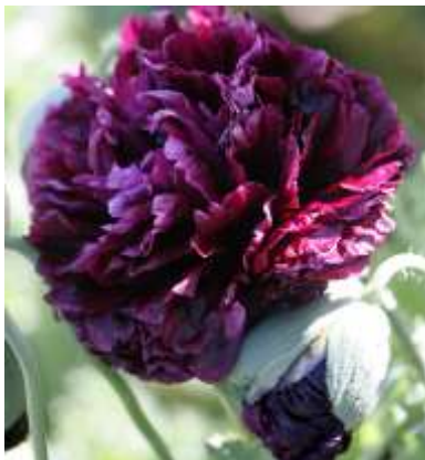
Slika 18.: Papaver somniferum „Black Peony“

Zbog povećeg sadržaja alkaloida u biljci (točnije u stabljici i tobolcu), opijumski ili vrtni mak ( Papaver somniferum ) je nešto manje zastupljen kao ukrasna vrsta. Unatoč tome što se velik dio uzgoja temelji na proizvodnji sjemena i opijuma, postoje brojni varijeteti vrtnog maka koji se koriste u ukrasne svrhe. Neki od poznatijih su „Black Peony“, „Danish Flag“, „Oase“, „Hen and Chickens“, i dr.