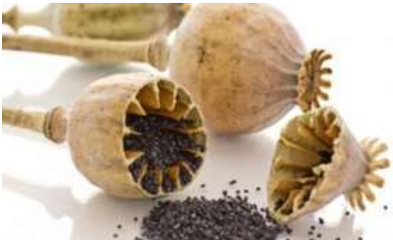
Slika 7.: Zreli tobolci i sjeme maka