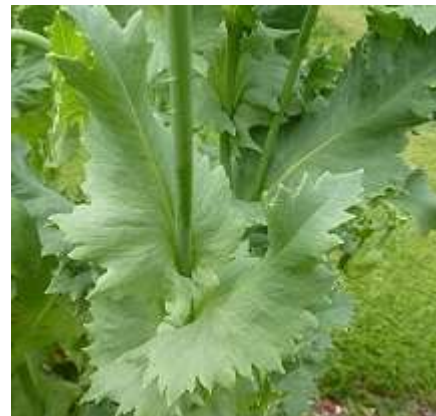
Slika 4.: Listovi vrtnog maka