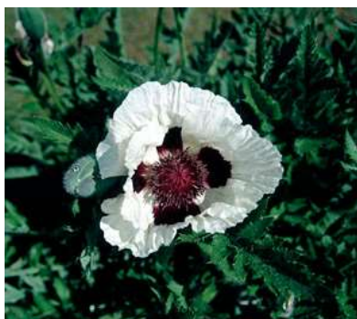
Slika 12.: Papaver orientale „Black and White“

http://davesgarden.com/guide/s/pf/go/112189/