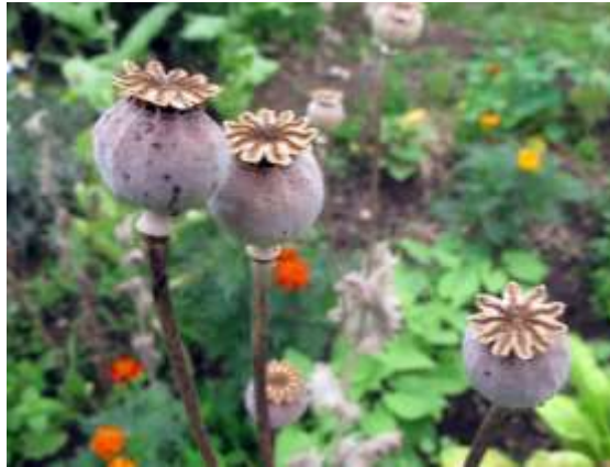
Slika 6.: Plodovi vrtnog maka (tobolci)