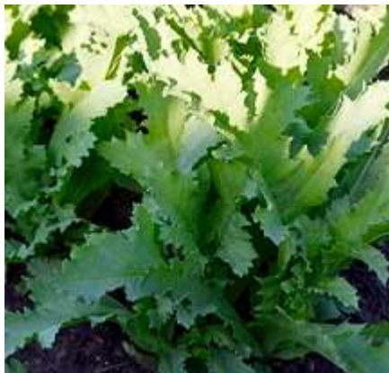
Slika 3.: Listovi vrtnog maka

Listovi su debeli, duguljasti i prevučeni su voštanom prevlakom koja listove štiti od niskih temperatura i prevelike transpiracije. Njihovi rubovi su cjeloviti ili urezani. Donji listovi sastoje se od peteljke i plojke, krupniji su od gornjih koji su sjedeći, pa osnovom djelomično obuhvaćaju stabljiku (Slika 4) (Dubravec i Dubravec, 1989.).