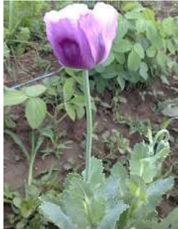
Slika 2.: Stabljika vrtnog maka

Stabljika biljke je uspravna, okrugla i glatka. Zeljasta je, lako lomljiva te je presvučena plavkasto-zelenom voštanom tvari (Đorđevski i Klimov, 1986.). Visina stabljike u normalnim uvjetima obično se kreće od 1 – 1,5 m, ali u sušnijim uvjetima ili na laganim tlima siromašnim hranivima obično ne raste više od 0,7 m (Pospišil, 2013.).