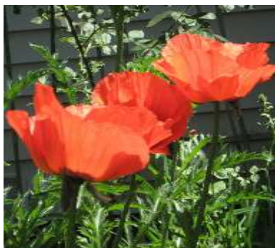
Slika 11.: Papaver orientale „Allegro“

Postoji nekoliko vrsta makova koji se smatraju isključivo ukrasnim vrstama, odnosno čija se primarna uloga temelji na njihovim ornamentalnim karakteristikama u različitim bojama i oblicima. Jedna od spomenutih vrsta je Papaver orientale , odnosno turski ili orijentalni mak, koji je danas autohtona vrsta sjeveroistočne Turske, Gruzije, Armenije, Azerbajdžana i sjeverozapadnog Irana, gdje pretežito naseljava alpske i podalpske regije. Otkako se 1714. godine pojavio u zapadnoj Europi stekao je popularnost sadnjom u vrtovima. Višegodišnja je biljka velikih cvjetova koji su najčešće narančaste boje, a postoje varijeteti bijele boje, ružičastih, žarko crvenih ili ljubičastih nijansa, od kojih su mnogi hibridi vrsta Papaver orientale i Papaver bracteatum .