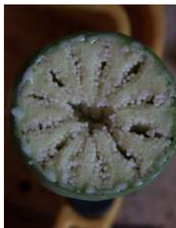
Slika 22.: Poprečni presjek nezrelog tobolca