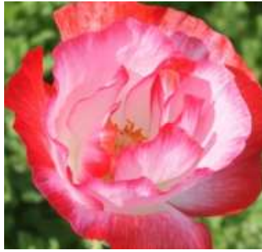
Slika 16.: Papaver rhoeas „Shirley Double (fl. pl.)“

http://davesgarden.com/guides/pf/go/74629/