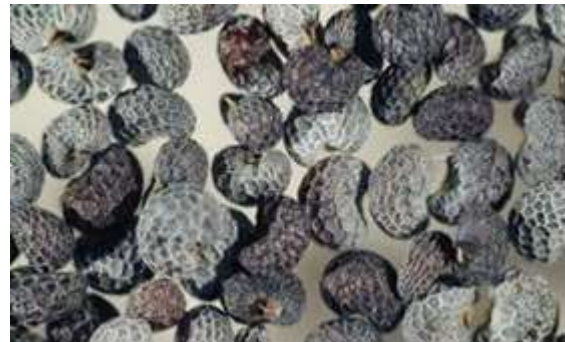
Slika 8.: Stereomikroskopska slika sjemena