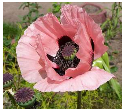
Slika 13.: Papaver orientale „Queen Alexandra“

https://apps.rhs.org.uk/plantselectorimages/detail/WSY0021849_4471.jpg