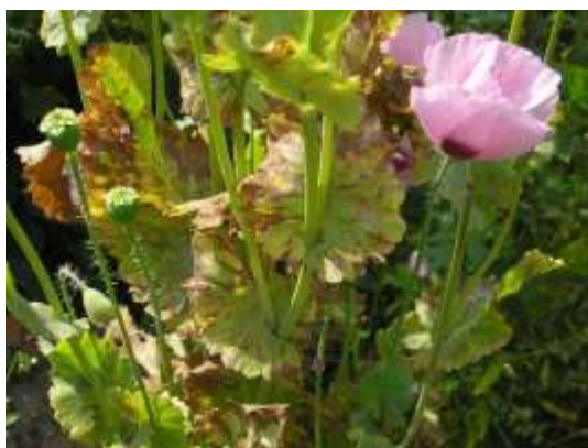
Slika 9.: Plamenjača maka ( Peronospora arborescens )

Plamenjača maka je vrlo opasna bolest koja se javlja za vlažnih godina. S obzirom da vlaga pogoduje brzom širenju ove gljive, može izazvati velike štete od koji su najčešće sušenje lišća, a za jačih zaraza i ugibanje biljaka.