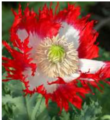
Slika 19.: Papaver somniferum „Danish Flag“

http://davesgarden.com/guides/pf/go/54230/