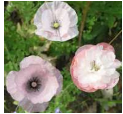
Slika 17.: Papaver rhoeas „Mother of Pearl“

http://davesgarden.com/guides/pf/go/211788/