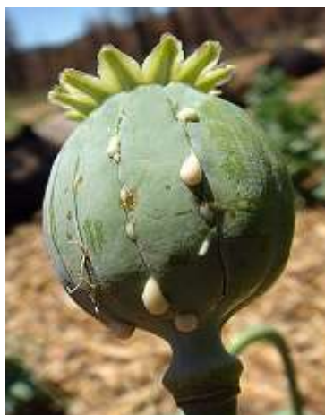
Slika 21.: Zarezani nezreli tobolac

Opijati se danas smatraju najstarijim lijekovima. Opijum je osušeni, mliječni sok koji uslijed zarezivanja biva izlučen iz nezrelih tobolaca maka (Slika 21 i 22). Njegova upotreba zabilježena je i prije više od 2 tisuće godina, a u Mezopotamiji i ranije. Stoljećima se opijum upotrebljavao kao sedativ i analgetik, a od 19. stoljeća započela je upotreba morfina ; najvažnijeg sastojka opijuma, koji je ujedno i odgovoran za njegovo djelovanje. Osim morfina , opijum sadrži i druge alkaloidne, među kojima se najvažnijima smatraju kodein , papaverin , tebain , narkotin , a oni manje zastupljeni su laudonosin , laudamin , laudanidin , gnoskopin , ksantalini , protopin , kritopin , neopin , mekonin i drugi. Opijum sadrži ukupno oko 25% alkaloida, a ostatak čine smole, vosak, organske kiseline, kaučuk, bjelanjčevine, masti, pektin, šećer, gume, sluzi te neke mineralne soli.