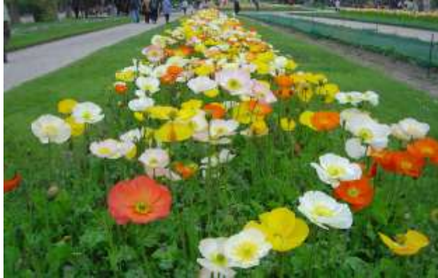
Slika 14.: Islandski makovi u botaničkom vrtu Jardin des Plantes , Pariz

Najčešće se uzgaja kao dvogodišnja biljka. Cvjetovi mogu biti različitih boja – bijeli, žuti, narančasti ili crveni te ih karakterizira blag miris. Boje se generacijama dobro prenose sisanjem, pa se sjeme smatra najboljim načinom razmnožavanja ove vrste.