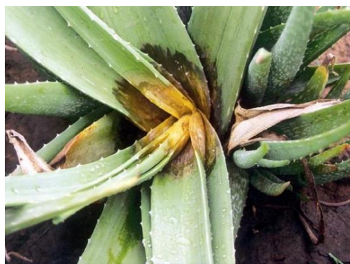
Slika 26.: Početna zaraza donjeg lišća Aloe vere

Bolest se vrlo brzo širi u vlažnim uvjetima kao posljedica dugotrajnih kiša ili navodnjavanja. Simptomi nastaju kada voda natopi bazu lista. Budući da se trulež brzo razvija, biljka Aloe vere nakon 2 – 3 dana vene. Kao rezultat truleži, epiderma lista Aloe vere nabubri zbog stvaranja plina i sadržaj lista Aloe vere se pretvara u sluzavu masu (Slika 27) ( http://www.slideshare.net/DineshDalvaniya/presentation1-aloevera-disease ) .