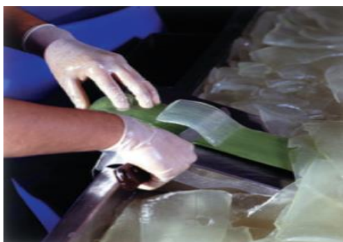
Slika 22.: Filetiranje lišća Aloe vere

Upravo zato, mnoge tvrtke ručno ljušte lišće kako bi izbjegle moguća oštećenja izazvana ugljičnom filtracijom. Ručno ljuštenje lišća naziva se još i filetiranje. Filetiranje je definirano kao izrezivanje najdragocjenijeg mesnatog dijela (Slika 22) Aloe vere iz lista biljke. Ručnim filetiranjem sastavni dio biljke ostaje netaknut i osigurava se očuvanje svih hranjivih tvari koje list Aloe vere posjeduje (Anonymous, 2008.).