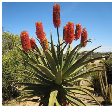
Slika 10.: Aloe ferox

http://www.americansouthwest.net/california/montana-de-oro/aloe-arborescens-flower_1.html