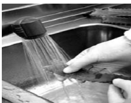
Slika 19.: Pranje lista Aloe vere

Nakon branja, (Slika 18) listovi se u roku od dva sata transportiraju do pogona gdje se svaki list ručno pere (Slika 19 i 20) (Bassetti i Sala, 2005.) te nakon toga započinje skupljanje gela iz parenhima lista Aloe vere .