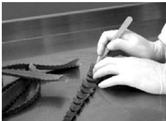
Slika 21.: Metoda „cijeli list“

ovih tvari odvija se dodatnim procesom; filtriranjem ugljikom što rezultira smanjenjem gorčine i pridonosi boljem okusu. Tijekom ovog dodatnog procesiranja dolazi do gubitka hranjivih tvari što rezultira produktom Aloe vere koji se ne može mjeriti s kvalitetom prvotne „cijeli list“ metode.