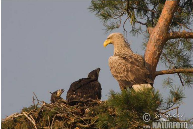
Slika 4. Orao štekavac u gnijezdu s mladima.