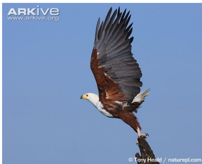
Slika 8. Madagaskarski orao ribar

Madagaskarski orao ribar (Slika 8) obitava u područjima madagaskarskih šuma. Endemska je vrsta Madagaskara gdje u malom broju živi na zapadnoj obali otoka. Dužina tijela je 60–66 cm, s rasponom krila 165–180 cm i mase 2,2–2,6 kg kod mužjaka i 2,8–3,5 kg za ženke.