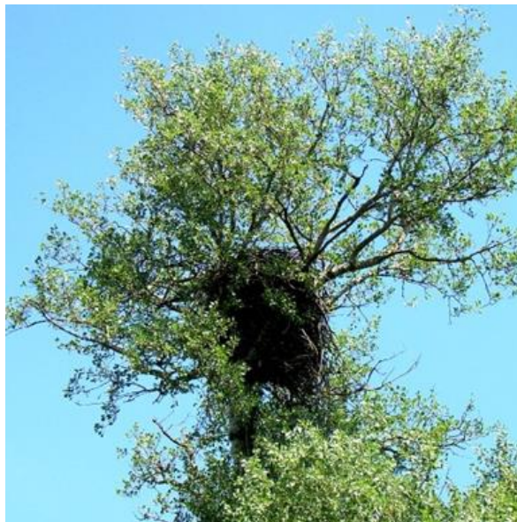
Slika 3. Gnijezdo orla štekavca u krošnji crne topole u Kopačkom ritu.

Spolnu zrelost prosječno dostiže u petoj godini života (raspon od 3-7 godina) kada bira partnera i zauzima gnijezdeći teritorij. Sezona gniježđenja započinje krajem siječnja zauzimanjem teritorija i izgradnjom ili popravljanjem gnijezda. Na pojedinom teritoriju nalaze se 2-3 gnijezda. Gnijezda gradi na velikim i starim stablima crnih i bijelih topola, bijelih vrba ili hrasta lužnjaka. Velika, visoka i stara stabla su potrebna kako bi mogla podržavati gnijezdo visine do 3 m i mase od nekoliko stotina kilograma (Slika 3).