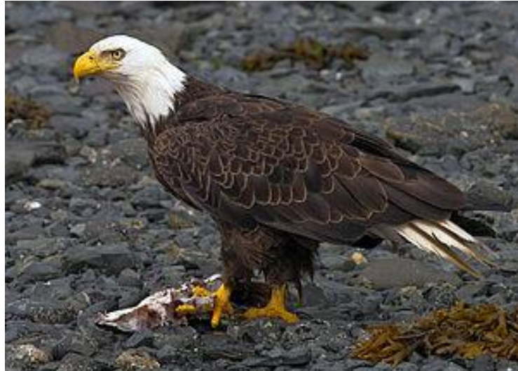
Slika 10. Američki bjeloglavi orao