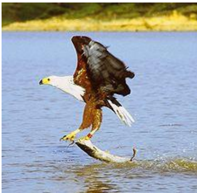
Slika 7. Afrički orao ribar ( http://en.wikipedia.org/wiki/African_fish_eagle )