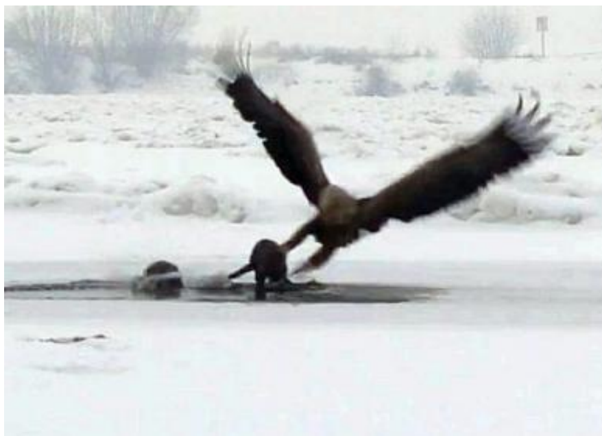
Slika 12. Orao štekavac neopreznoj vidri krade jegulju ( http://www.naucat.com/admin/phpthumb/phpThumb.php?src=http://www.naucat.com/images/120314/primaryImage-23026-31169.jpg&w=390&h=&zc=0&aoe=0 )