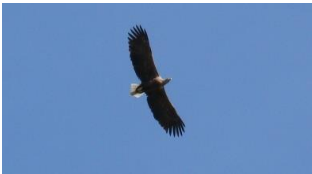
Slika 1. Orao štekavac u letu iznad Kopačkog rita

Orao štekavac ili bjelorepi orao je jedina vrsta roda Haliaeetus koja živi u Europi. Najveća je ptica grabljivica Panonskih nizinskih prostora (Slika 1). Mužjak i ženka žive u paru cijeli život, a povezanost učvršćuju čestim letovima i zajedničkim obrušavanjima. Štekavac se nalazi na vrhu hranidbenog lanca i nema prirodnih neprijatelja. Nažalost, jedini pravi neprijatelj mu je čovjek koji ga ugrožava uništavanjem staništa, npr. sječom šuma, isušivanjem vlažnih i vodenih područja; narušavanjem mira te protuzakonomitim uzimanjem ili hvatanjem jedinki u prirodi.