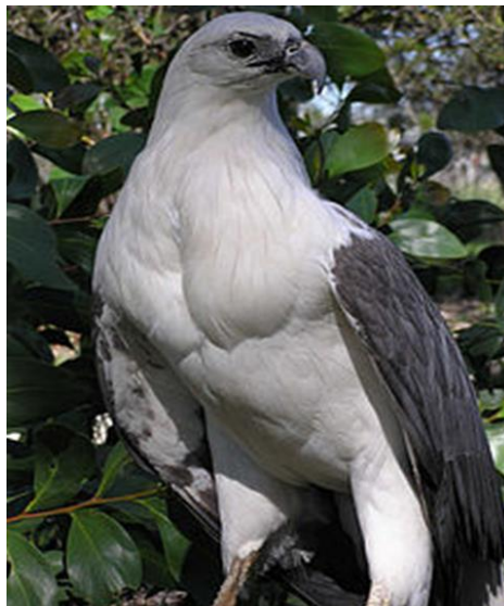
Slika 5. Bjeloprsi orao ( http://en.wikipedia.org/wiki/White-bellied_sea_eagle )

Bjeloprsi orao (Slika 5) u srodstvu je sa Sanfordovim orlom. Odrasli orao ima bijelu boju ispod krila, na prsima, glavi i repu, dok su gornji dijelovi sivi i crni. Kao kod mnogih predatora, ženke su malo veće od mužjaka i mjere do 90 cm dužine, s rasponom krila do 2,2 m i masom oko 4,5 kg. Mladi orlovi imaju smeđe slojeve perja koji se postupno mijenjaju bijelom bojom do dobi od 5 do 6 godina. Obitava na području Indije, Šri Lanke, jugoistočne Azije do Australije na obalama velikih vodenih puteva.