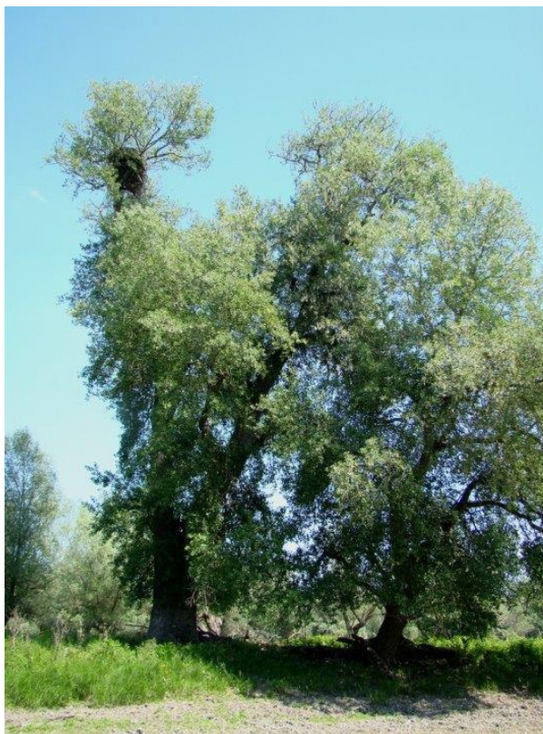
Slika 14. Gnijezdo orla štekavca u krošnji starog stabla crne topole u Kopačkom ritu.

gnijezda i najbližeg ljudskog naselja iznosi 425–7.500 m s većinom gnijezda smještenih 1–2 km od naselja (Radović i Mikuska, 2009.).