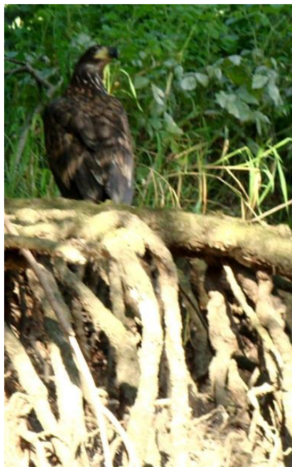
Slika 2. Mladi orao štekavac u Kopačkom ritu.

Orao štekavac je najveća srednjoeuropska ptica grabljivica i tipična je stanařica u Europi, kao i u sjevernim i umjerenim pojasevima Azije. U duljinu mjere 66-94 cm, s repom duljine 20-32 cm i rasponom krila 1,80-2,50 m. Źenke su mase 4-7 kg i malo su veće i krupnije od mužjaka čija je masa 3,1-5,4 kg. Rekordna masa od 7,5 kg zabilježena je u Škotskoj području dok je na Grenlandu zabilježena ženka s rasponom krila 2,53 m. Štekavca odlikuje visoki kljun i snažan, dugačak vrat. Kljun je kod starih primjeraka žute boje i dužine oko 8 cm, a kod mlađih je crne boje (Slika 2). Boja perja mu se mijenja prema starosti, pa su tako mlađi primjerci tamnosmeđe boje, a stariji svjetliji. Privržen su velikim rijekama, jezerima i močvarama bogatim ribom i drugim izvorom hrane.