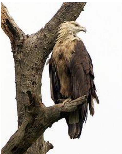
Slika 9. Pallasov orao ribar ( http://en.wikipedia.org/wiki/Pallas%27s_fish_eagle )

Pallasov orao ribar (Slika 9) gnijezdi na području Središnje Azije, između Kaspijskog i Žutog mora, od Kazahstana, Mongolije, Bangladeša, Himalaja do sjevernog dijela Indije. Migrira i prezimljuje s ostalim pticama u sjevernoj Indiji i na zapadu do Perzijskog zaljeva. Imaju svijetlosmeđu boju na glavi, krila su tamnosmeđa, a rep crn sa širokom i prepoznatljivom bijelom linijom. Mladi orlovi su tamni i bez ikakvih linija na repu. Dužina tijela je 72–84 cm s rasponom krila 180–215 cm. Ženke su mase 2,1–3,7 kg, a mužjaci 2–3,3 kg. Hrane se uglavnom ribom i močvarnim pticama.