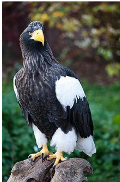
Slika 11. Stellerov orao ( http://en.wikipedia.org/wiki/Steller%27s_sea_eagle )

Stellerov orao (Slika 11) obitava u sjeveroistočnoj Aziji. Ovo je najteži orao na svijetu s prosječnom masom od 5 do 9 kg. Ženke imaju masu 6,8–9 kg, mužjaci 4,9–6 kg. Dužine su od 85 do 105 cm s rasponom krila 1,95 –2,5 m. Stellerov orao ima tamnosmeđu do crnu boju perja na tijelu s bijelom bojom na gornjem dijelu krila uz prsa, bijelim perjem na nogama i repu. Prvo perje kod ptica je bijele boje, a ubrzo dobiju sivo-smeđe perje.