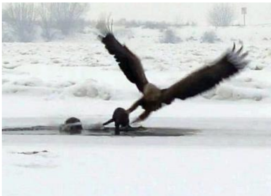
Slika 12. Orazo štekavac neopreznoj vidri krade jegulju ( http://www.naucat.com/admin/phpthumb/phpThumb.php?src=http://www.naucat.com/images/120314/primaryImage-23026-31169.jpg&w=390&h=&zc=0&aoe=0 )