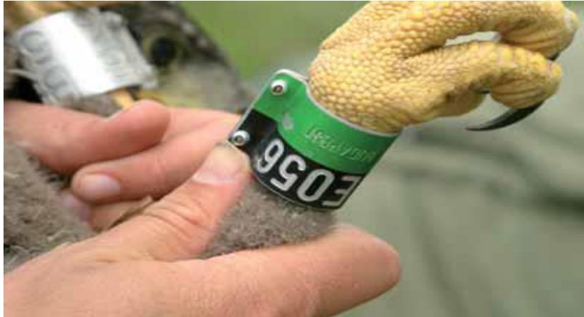
Slika 15. Prstenovani orao štekavac s mađarskom oznakom korištenom u razdoblju 2005.–2007.godine