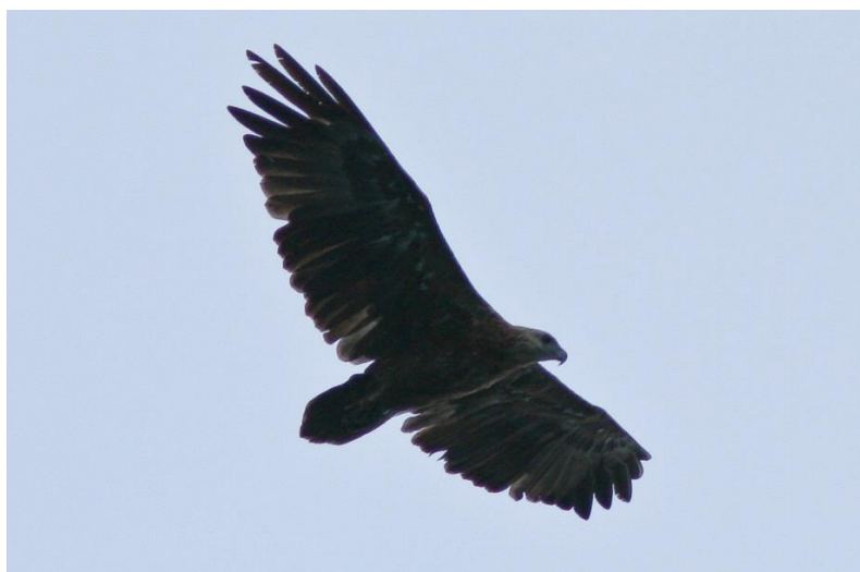
Slika 6. Sanfordov morski orao.

Sanfordov ili Solomonski orao (Slika 6) je endemska vrsta Solomonskih otoka. U usporedbi s ostalim orlovima dosta je malih dimenzija; u dužinu mjeri 70–90 cm s rasponom krila 165–185 cm i mase 1,1–2,7 kg. Jedini je veliki grabežljivac na Solomonskom otočju. Nastanjuju šume obalnih područja i jezera na nadmorskim visina oko 1.500 m. Perje im je svjetlo do tamnosmeđe boje na glavi i vratu, donja strana ima je smeđa do crvenkasto smeđa, a gornja strana tamnosmeđe do sive boje i rep im je u potpunosti taman cijelog životnog vijeka.