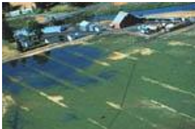
Slika 2. Navodnjavanje prelijevanjem