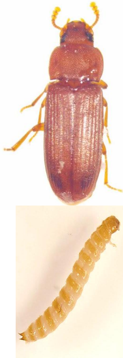
Slika 4. Tribolium castaneum Herbst– kestenjasti brašnar (imago i ličinka)

Kestenjasti brašnar ( T. castaneum ) (Slika 4.) pripada porodici Tenebrionidae te je jedan od najčešćih sekundarnih štetnika žitarica u nas (Macelj, 1999.). Osobito je rasprostranjen u tropskim krajevima, a po brojnosti u skladištima u našoj zemlji nalazi se na trećem mjestu; iza hrđastog brašnara C. ferrugineus i žitnog kukuljičara Rhyzopertha dominica F. (Kalinović i Rozman, 2002.).