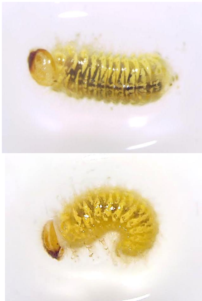
Slika 3. Lasioderma serricorne F. – duhanar (ličinka)