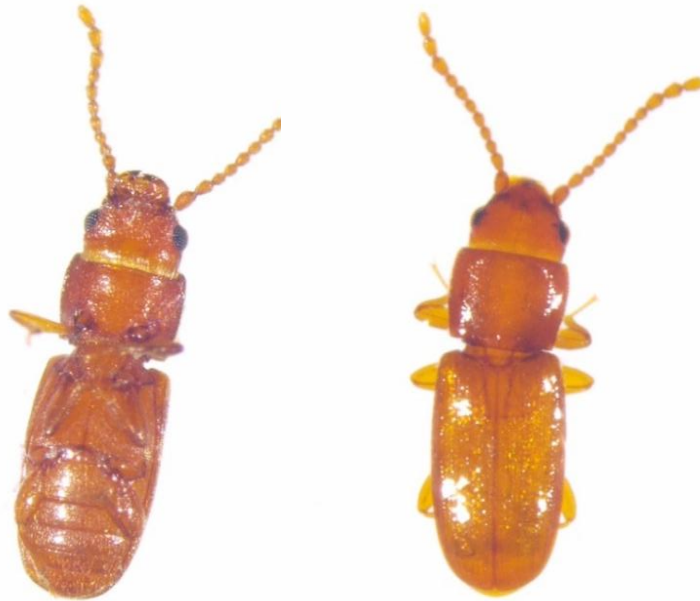
Slika 1. Cryptolestes ferrugineus Steph.– hrdasti brašnar

Duhanar ( L. serricorne ) (Slika 2.) je skladišni štetnik koji pripada porodici Anobiidae i najčešće napada duhan, ali i druge proizvode. Imago duhanara ima izduženo-eliptičan oblik tijela, crvenkasto smeđe ili žućkasto smeđe boje dugog 2 do 4 mm pokrivenog finim dlačicama. Glava i dio nadvratnog štita imaga okrenuti su prema dolje, a ticala su pilasto nazubljena. Ženka polaže 20 do 100 jaja priljepljujući ih na lišće duhana. Ličinka (Slika 3.) ima debelo, savinuto tijelo, žućkasto bijele boje dužine do 5 mm te je također prekrivena dlačicama (Rozman, 2010.a).