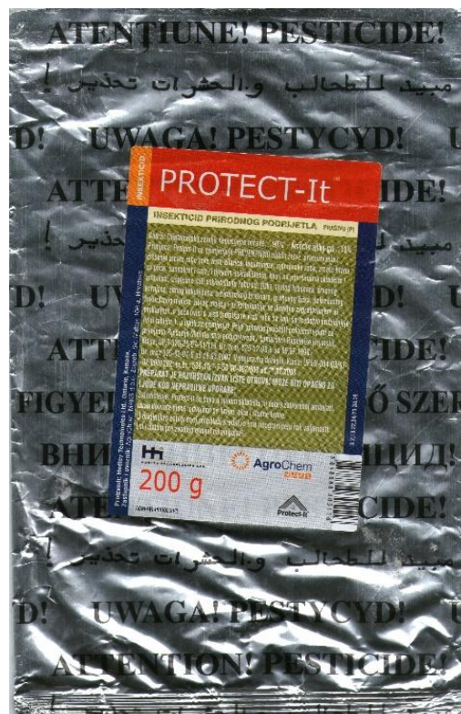
Slika 5. Dijatomejska zemlja Protect-it ® (Hedley Technologies Ltd., Ontario, Kanada)

Korištena je dijatomejska zemlja Protect-it ® (Hedley Technologies Ltd., Ontario, Kanda; AgroChem MAKS d.o.o., Zagreb, Hrvatska). Inertno prašivo DZ Protect-it ® ubraja se u fizikalne insekticide i postiže maksimalnu efikasnost na zrnju s vlagom manjom od 14,5%. Prilikom ispitivanja korištene su tri koncentracije prašiva, od 0,01; 0,02 i 0,04 g/50 g pšenice.