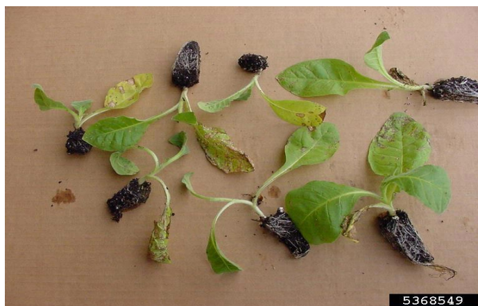
Slika 15.: Uništene presadnice

Pojavu ovih bolesti najčešće uzrokuju patogene gljivice roda Pythium spp i Rhizoctonia solani spp. Palež klijanaca uništava presadnice prije ili vrlo brzo poslije klijanja (slika 15), a ukoliko se javi infekcija prije nicanja dolazi do slabog nicanja uslijed raspadanja sjemenki u tlu. Ako se propadanje presadnica javi prilikom nicanja tada klijanac polegne i propadne. Ozbiljnost ove bolesti ovisi o količini patogena u tlu kao i o vanjskim čimbenicima. Presadnice prilikom nicanja razviju lezije blizu rukavca, tkivo koje se nalazi ispod lezija upija vodu i postaje mekše što rezultira polijeganju presadnica (Izekor i sur., 1977.; Tripathi i sur., 2011.).