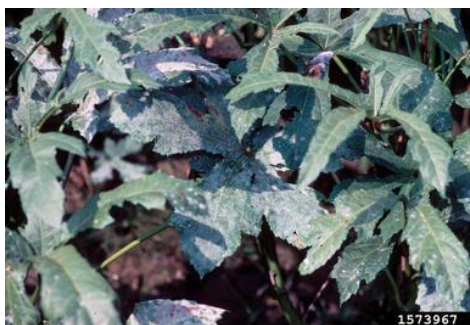
Slika 17.: Pepelnica na listu bamije

Uzročnici pepelnice su Erysiphe cichoracearu i Sphaerotheca fuliginea . Ova bolest zahvaća većinom starije lišće, peteljke i stabljiku. Prinosi većine zaraženih povrtnih vrsta smanjuju se uslijed preranog gubitka lista. Povećana vlaga zraka i temperatura pogoduje razvoju bolesti te se javlja povećana zaraza tijekom perioda teških rosa. Simptomi bolesti se javljaju kao bijele baršunaste prevlake koje se nalaze većinom na naličju lista, no moguće su pojave licu lista (Slika 17). Mladi listovi su gotovo imuni na pojavu ove bolesti. Spore se lako šire vjetrom na susjedne biljke. Teško zaraženi listovi postaju žuti, a potom se suše i smeđe. Ekstenzivna prerana defolijacija starijeg lišća javlja se ukoliko bolest nije kontrolirana (Tripathi i sur., 2011.).