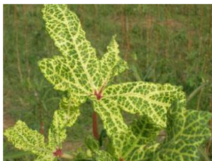
Slika 19.: Mozaični virus na listu bamije

Ovaj virus najznačajnija je te najdestruktivnija bolest bamije koja pogađa usjev u svim fazama razvoja. Karakteristični simptomi bolesti su homogeno isprepletana mreža žutih vena koje ograđuju otoke zelenog tkiva (Slika 19). Zaraženi listovi okarakterizirani su žuto obojenim žilama, dok u kasnijim fazama list u potpunosti požuti. U ekstremnim slučajevima, zaražen list postaje blijedo žut ili krem bez traga zelene boje. Ponekad se mogu uočiti izrasline na naličju zaraženog lista. Biljke zaražene u ranim razvojnim fazama zaostaju u rastu. Plodovi zaraženih biljaka postaju blijedo žuti do blijedi, deformirani, mali i tvrdi. Ukoliko je biljka zaražena do 20 dana nakon klijanja, gubitci u prinosu i kvaliteti mogu biti od 50-100% (Tripathi i sur., 2011.).