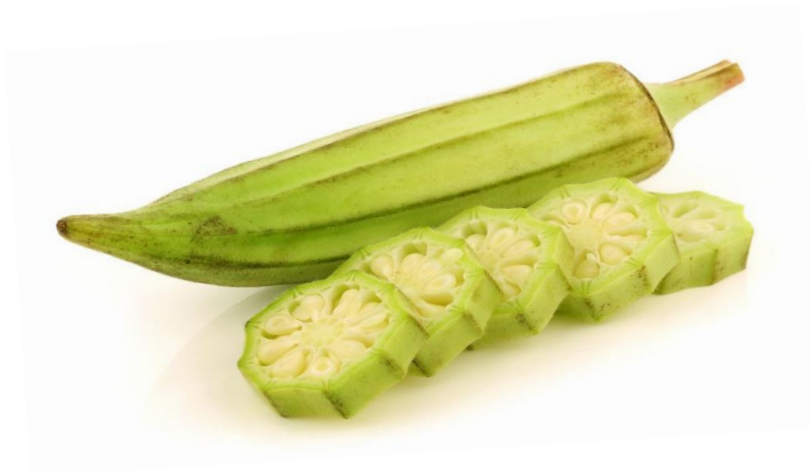
Slika 2.: Plod bamije