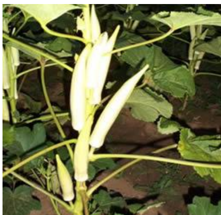
Slika 9.: Bijela snježna kraljica