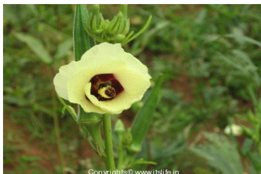
Slika 1.: Cvijet bamije

Plod je tobolac, koji se nalazi na kratkoj stapci, klinastog oblika i na vrhu malo savijen (slika 2), svijetlozelene do tamnoljubičaste boje, a može biti gladak ili pokriven sitnim dlačicama, naročito u fazi tehnološke zrelosti. U fiziološkoj zrelosti, u plodu dužine 15 do 25 cm može se naći 30 do 80 sjemenki nepravilnog, okruglastog oblika i sivosmeđe boje koje se osipaju iz zrelog ploda.