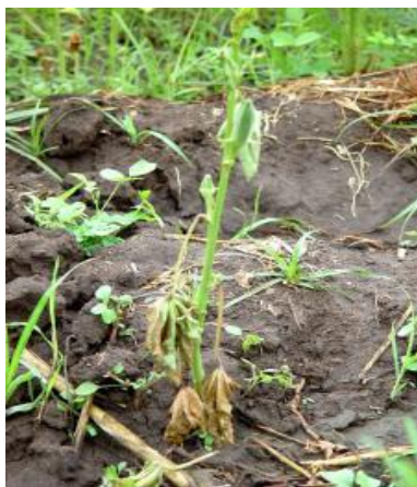
Slika 16.: Fusarium oxysporum f. sp. Vasinfectum na bamiji

tamnosmeđom tragom s unutrašnje strane kore. Bolest se prenosi preko tla te se širi agrotehničkim mjerama (Izekor i sur., 1977.; Tripathi i sur., 2011.).