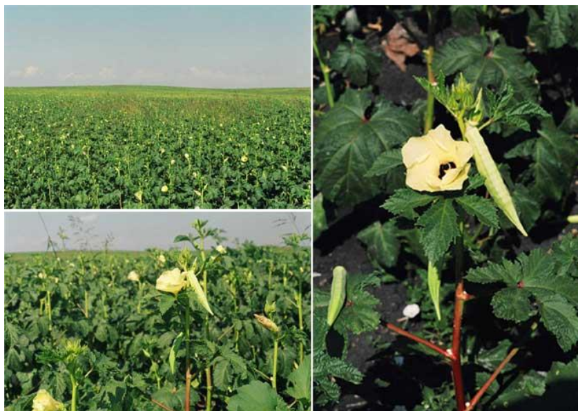
Slika 14.: Prinos bamije na otvorenom polju

Berba započinje krajem svibnja ili početkom lipnja i traje do kraja rujna ili početka listopada. Vrlo mladi plodovi, 3 do 5 dana nakon cvatnje beru se ručno, na način da plod malo zaokrene i otkine. Kod nas, najviše se cijene sitni plodovi, dugački 3 do 5 cm. Budući da se cvjetovi na stabljici otvaraju sukcesivno od donjih koljenaca prema gornjim, plodovi se moraju brati svaki ili svaki drugi dan. Daljnju cvatnju usporava sve više razvijeniji plod, a ukoliko se plodovi ne beru za 50 do 60 dana na jednoj biljci dozrije samo 5 ili 6 plodova. Jedna dobra biljka može dati i do 100 plodova kroz 50 do 55 dana berbe, ali prinos od 10 t/ha može se držati vrlo dobrim, iako je potencijal rodnosti znatno veći (slika 14). Ručna berba zahtjeva puno posla, a može izazvati i alergije kod berača zbog sitnih dlačica koje se nalaze po cijeloj biljci (Lešić i sur., 2002.).