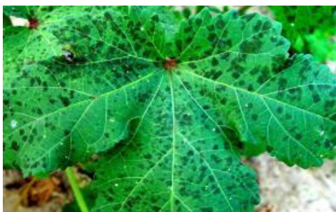
Slika18.: Crna pjegavost na listu

Uzročnici ove bolesti su Cercospora abelmoschi , C. malayensis , C. hibisci . C. malayensis izazova smeđe, nepravilne pjege, dok C. abelmoschi uzrokuje tamne, crne uglate pjege (Slika 18). Zahvaćeni listovi se uviju, uvenu i otpadnu. Pjegavost lišća bamije uzročnik je ozbiljne defolijacije i često se javlja prilikom vlažnog vremena (Tripathi i sur., 2011.).