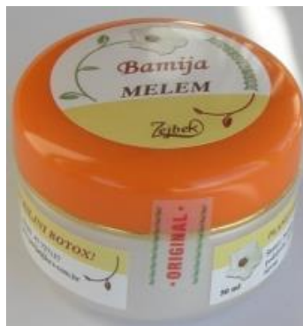
Slika 6.: Melem