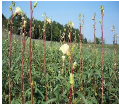
Slika 8.: Domaća bamija