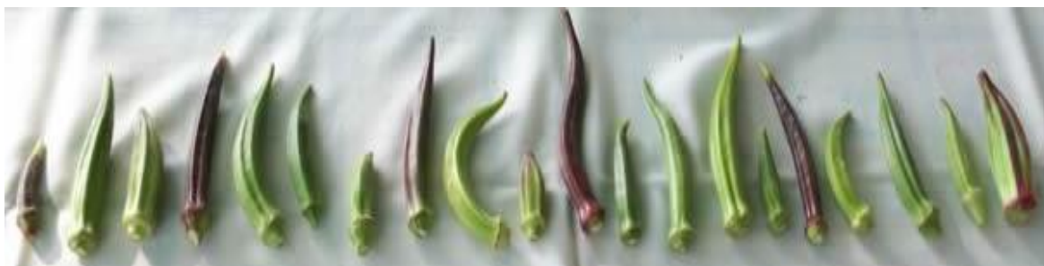
Slika 11.: Plodovi različitih sorti bamije Izvor: http://www.bamija.hr/bamija.html