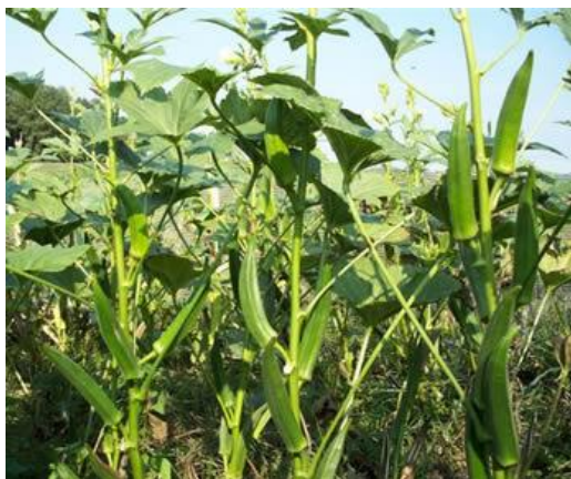
Slika 7.: Kolosal istočni

Od 20 sorti bamije koje su eksperimentalno posađene na našim prostorima pokazalo se da su se najbolje prilagodile Kolosal istočni, Domaća bamija (slika 7 i 8):