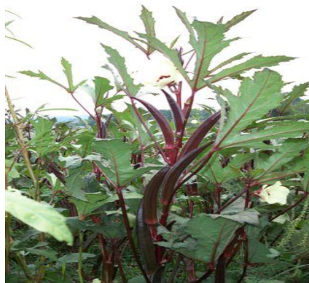
Slika 10.: Crvena indijska bamija

U zemljama Balkana, točnije u Bosni i Hercegovini i Makedoniji najčešće se uzgajaju domaći ekotipovi podrijetlom iz Bugarske i Turske.