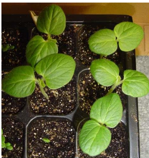
Slika 13.: Sadnice bamije

Optimalna temperatura za uzgoj mladih presadnica iznosi 24°C danju, a noću 20°C. Za druge faze uzgoja potrebno je prihranjivati tekućim gnojivom. Od sredine svibnja može se saditi u plastenik bez grijanja. Za sadnju je potreban prostor 100×50 cm (3 biljke po m 2 ) uz širinu grede od 1,20-1,50. Sadi se u jednom redu, a razmak između biljaka mora iznositi 40 cm. Potreba za hranjivima je visoka 5-10 L komposta oko svake biljke, što znači 80-100 g po m 2 ili primjena cjelovitog gnojiva 100 g oko svake biljke što odgovara 200 g po m 2 . Zalijeva se po potrebi i samo po korijenu biljke, ne po listovima (Eva Schumann, Gerhard Milicka).