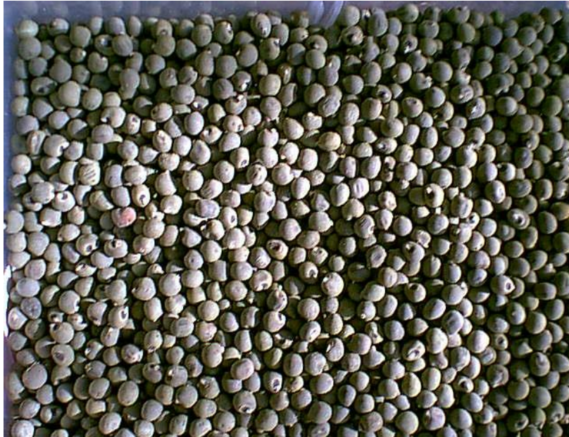
Slika 12.: Sjeme bamije

Nedozreli plod pomaže u liječenju kataralnih infekcija poput gonoreje i disurije te otežanog mokrenja, a pomaže i kod jačanja muške potencije (Ljekovite biljke, 2014.).