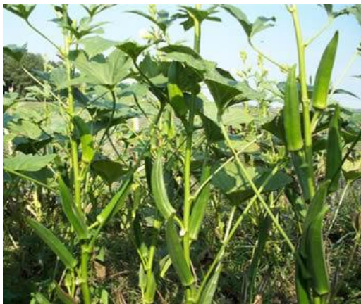
Slika 7.: Kolosal istočni

Od 20 sorti bamije koje su eksperimentalno posađene na našim prostorima pokazalo se da su se najbolje prilagodile Kolosal istočni, Domaća bamija (slika 7 i 8):