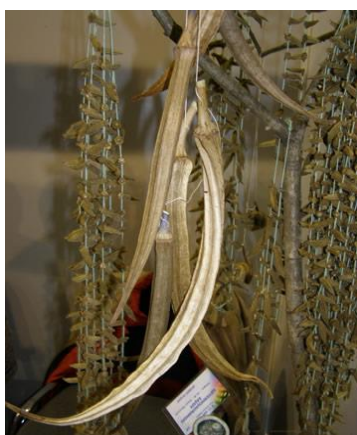
Slika 4.: Sušena bamija