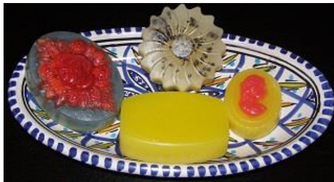
Slika 5.: Sapuni

Bamija značajnu ulogu ima u prirodnoj kozmetici i jedina je biljka iz koje je ekstrahiran prirodni biljni botoks, što znači da osigurava izostanak aditiva, umjetnih dodataka i boja, parabena i drugih štetnih kemijskih spojeva te nije testirana na životinjama. Neutralizira štetno djelovanje slobodnih radikala u tijelu, sprječava preuranjeno starenje kože i čini je glatkom i zategnutom. Proizvode se tonici, hidratantne kreme, sapuni i melemi (slika 5 i 6) (Bamija-čarobna biljka iz Božjeg vrta, 2014.).