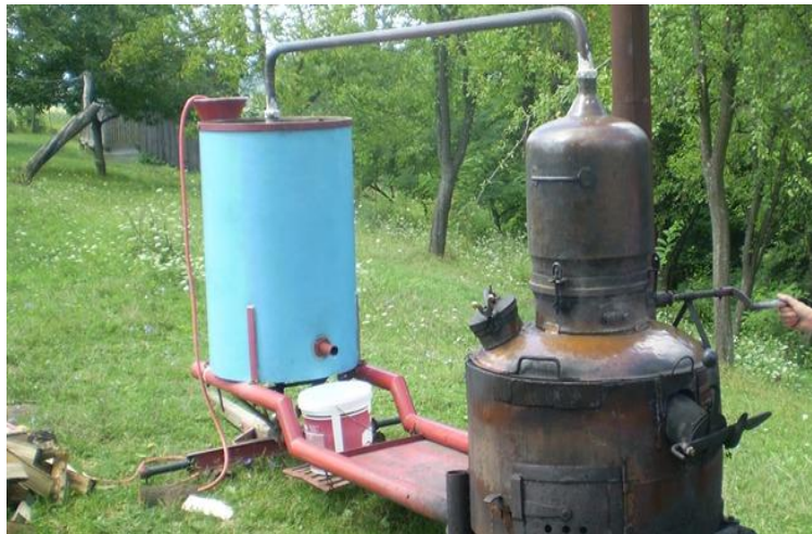
Slika 6. Kotlovi za „Pečenje“ rakije

Šljivovica je proizvod proizveden na tradicijski način, isključivo na području Slavonije. Šljivovicu karakterizira pitkost i specifična aroma, te neznatno kiselkast i slatkast okus. Udio alkohola u smjesi kreće se u granicama od 37,5-42,5%, a pH vrijednost iznosi 4,1 do 4,5. Karakteristične je zlatnožute, svijetložute boje. Ova svojstva su specifična samo za staru slavonsku šljivovicu.