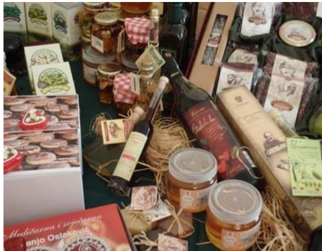
Slika 1. Autohtoni proizvodi

Autohtoni prehrambeni proizvodi zbog tehnoloških, prehrambenih i organoleptičkih specifičnosti, kvalitetom i posebnosti konkuriraju ostalim prehrambenim proizvodima na globalnom tržištu. Autohtoni proizvodi se štite zemljopisnim oznakama zbog stvaranja identiteta i prepoznatljivosti, ali i više cjenovne kategorije. Zaštita autohtonih proizvoda spada u zakonski definirano područje. Zemljopisne oznake su oznake na proizvodima koji posjeduju karakterističnu kvalitetu ili reputaciju nastalu zahvaljujući. Europska unija propisala je u uredbi (EU) br. 1151/2012 „on quality schemes for agricultural products and foodstuff“ zahtjeve za zaštitu autohtonih proizvoda. U Republici Hrvatskoj osim navedene uredbe na snazi su još dva propisa: Zakon o zaštićenim oznakama izvornosti, zaštićenim oznakama zemljopisnog podrijetla i zajamčeno tradicionalnim specijalitetima poljoprivrednih i prehrambenih proizvoda.