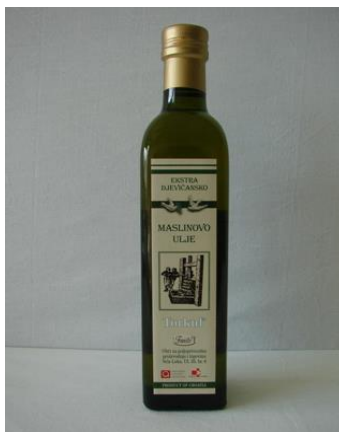
Slika 11. Torkul

Maslinovo ulje Torkul je ulje ekstra kakvoće, jedinstvenog okusa sorte osobine, pikantno gorkog okusa, mirisa po plodu zelene ili zrele masline, bogate voćne arome i karakteristične žutozelene boje. Torkul ulje je bez konzervansa i u sebi sadrži manju koncentraciju slobodnih masnih kiselina (do 0,8%), a svojom aromom ploda masline upotpunjuje svaku hranu.