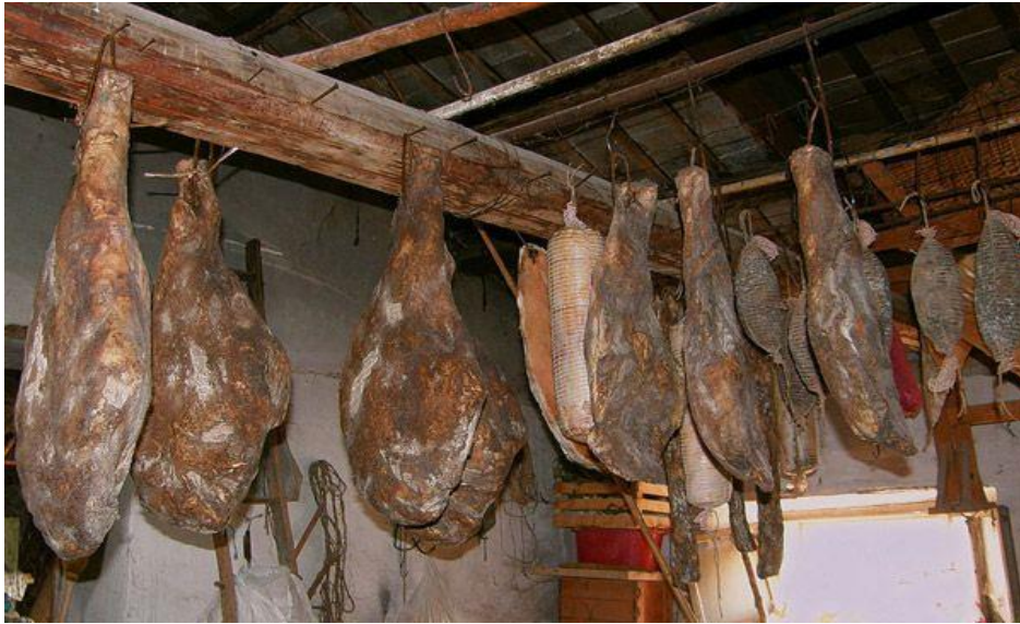
Slika 8.Istarski pršut

kemijsko-enzimatskim transformacijama sugo salamurenog buta pod određenim uvjetima sredine (temperatura,vlažnost,strujanje zraka).