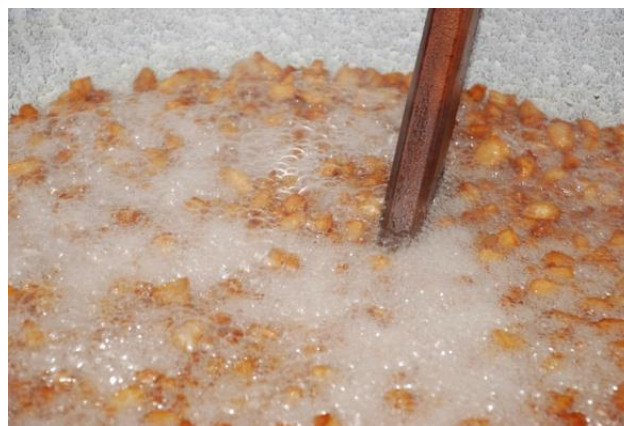
Slika 16. Kuhanje čvaraka

Čvarci su jelo od prženog svinjskog masnog tkiva. Tradicionalno, čvarci se pripremaju kuhanjem komadića slanine i masnog mesa u metalnom kotlu. Tijekom kuhanja mast se otopi i ocijedi, a sitni komadići mesa i masnoće se prže i suše. Prije kuhanja u kotao se stavi malo masti ili vode. Slanina se reže na podjednake kockice, te se stavlja u kotao. Kuhanje traje 30-45min, ovisno o veličini kockica. Čvarke je potrebno konstantno miješati, da ne bi zagorjeli ili se slijepili. Na kraju kuhanja dodaje se mlijeko koje daje boju čvarcima (više mlijeka, tamnija boja). Čvarci su zlatno-žute boje. Nakon što je gotovo, odvajamo mast od čvaraka na način da kroz cjedilo protiskujemo mast, čvarci se moraju stisnuti, te ih stavljamo u praznu posudu. Prije konzumiranja, čvarci se mogu soliti.