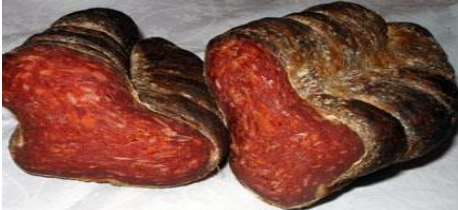
Slika 4.Slavonski kulen