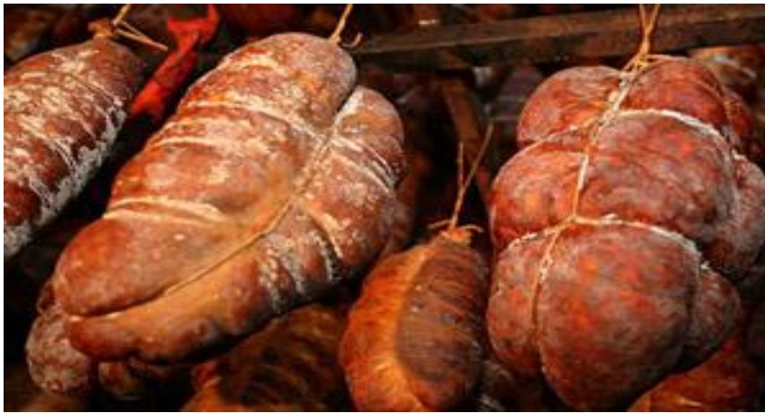
Slika 5. Zrenje kulena

Dobro napunjeni kulen čvrsto se veže tankim konopom, a prije vješanja se još vežu s debljim konopom debljine 2-3mm. Kulen se vješa u pušnice, gdje se dimi prvih nekoliko tjedana. Dimljenje treba biti blago, dimom graba, jasena ili bukve. Nakon dimljenja, kulen se ostavlja do proljeća u pušnici radi sušenja ili se taj proces može odvijati i u zrioni. Zrenje traje 90-120 dana, a cilj zrenja i pravilnog uskladištenja je zadržati i oplemeniti postignutu kakvoću, te postići željena, konačno tražena gurmanska svojstva kulena.