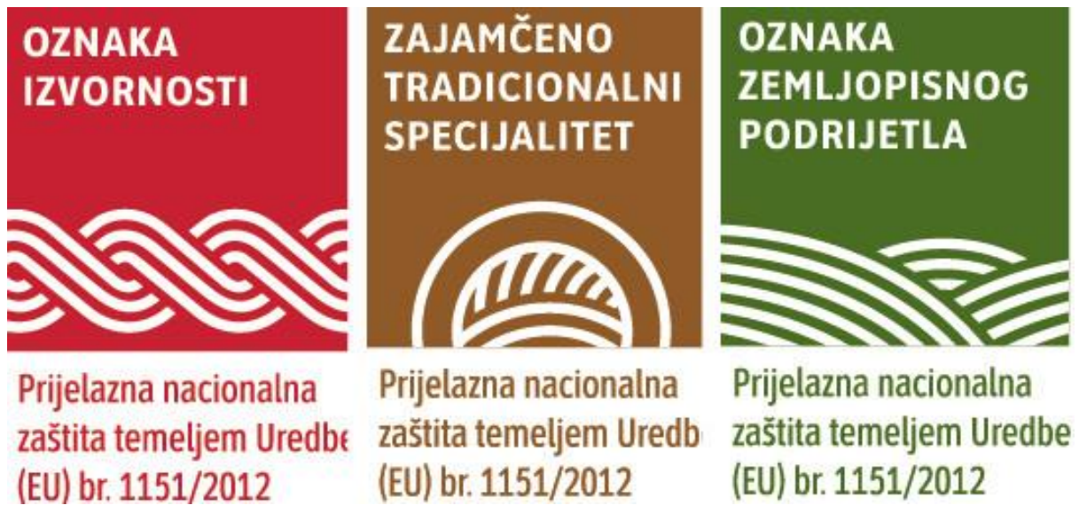
Slika 3. Hrvatske prijelazne oznake