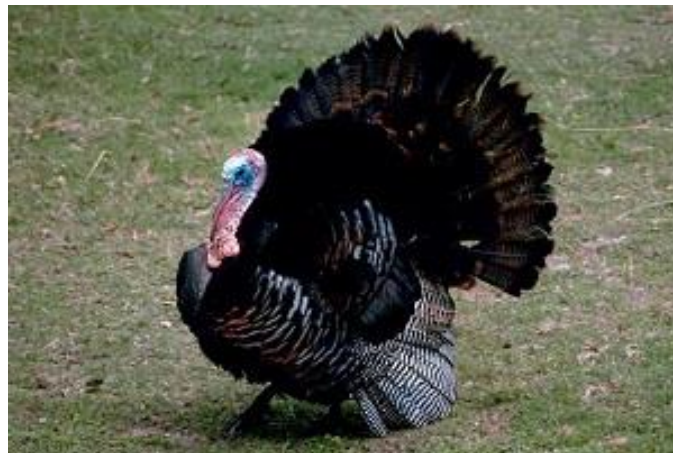
Slika 14. Zagorski puran

Meso Zagorskog purana je proizvod koji se dobiva klanjem purana autohtone hrvatske pasmine zagorski puran u dobi od 6 do 8. mjeseci koji su uzgojeni tradicijskom tehnologijom na području Hrvatskog Zagorja. Težina zagorskih purana u dobi od 6 do 8 mjeseci iznosi 6 do 8 kg, a težina purica 3 do 5 kg. Meso zagorskog purana ima prirodan miris s naglašenom aromom livadske flore, a meso je sočno, finog okusa i poželjne žvačnosti. Na području Zagorja obitavaju četiri soja zagorskih purana koji se koriste za proizvodnju mesa zagorskog purana: Brončani, crni, sivi i svijetli.