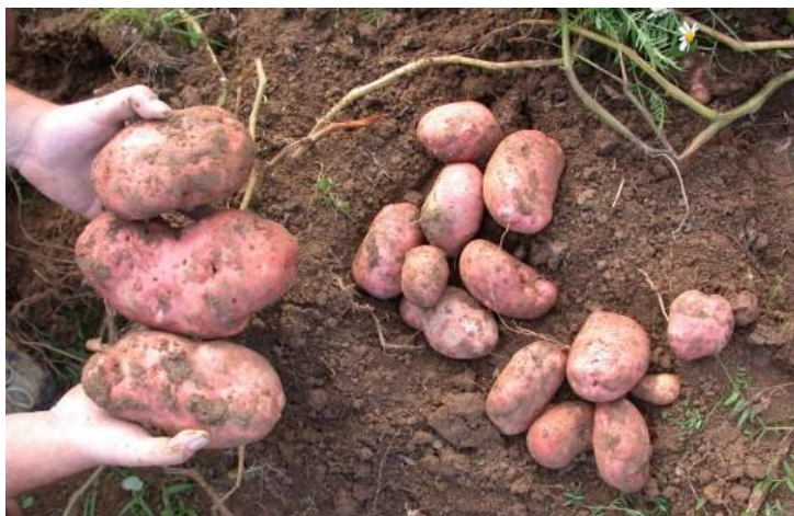
Slika 9. Lički krumpir

Pokožica gomolja je žute do smeđe ili crvenkaste boje, a ljuska može biti glatka ili hrapava. Boja mesa (mekote) gomolja je svijetlo bijele do žute boje, a tekstura mesa gomolja je fina-sitnozrna. Gomolj ima branast okus, prhak ili suh, zbog većeg postotka suhe tvari (visok sadržaj škroba) jer pokazuje sklonost raskuhavanju, odnosno pri jedenju se osjeti punoća u ustima.