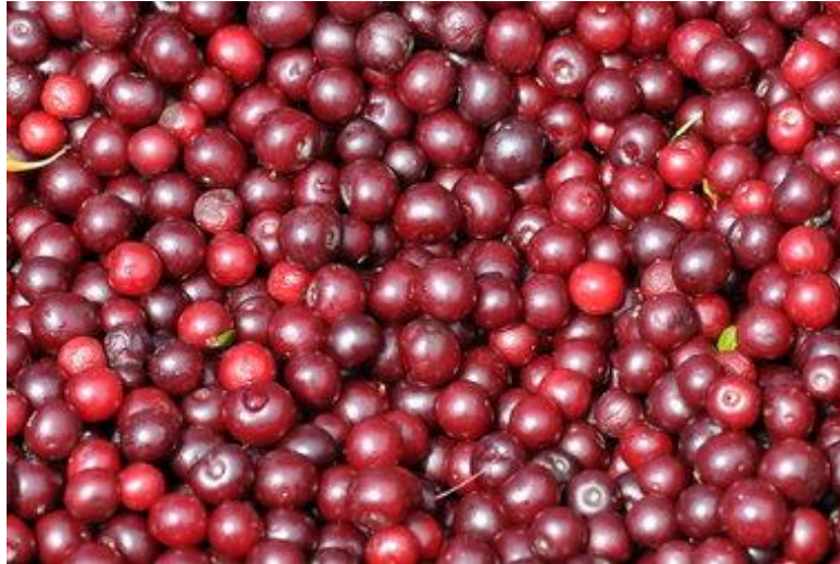
Slika 15. Plod Dalmatinske maraske