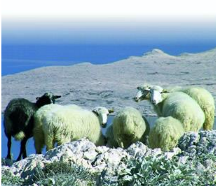
Slika 13. Paška ovca

Paška janjetina je drugi po važnosti proizvod paških ovaca. Dobiva se klanjem janjadi (autohtone paške ovce) stare 25-45 dana, mase obrađenog trupa od 4 do 9 kg. Ovo je najčešće prisutno meso janjadi na tržištu, a dobiva se od uzgajivača paške ovce koji proizvode paški sir. Janjad se do ove dobi hrani isključivo ovčjim mlijekom, što mesu daje poseban ukus. Paška janjetina je specifičnog okusa mesa zbog ambijenta u kojem živi i u kojem se hrani paška ovca (krš, kamenjar, posolica, niska trava, kadulja). Meso paške janjetine je blijedo-ružičaste boje, tankih i nježnih mišićnih vlakana, ukusno i sočno. Na tržištu se može naći i nešto starija janjad, mase trupa 9 do 15 kg. Ove janjetine ima znatno manje, jer se dobiva uglavnom od uzgajivača koji ne proizvode paški sir, već samo meso. Paška janjetina priprema se na razne načine, a najpoznatiji je pečenje na ražnju.