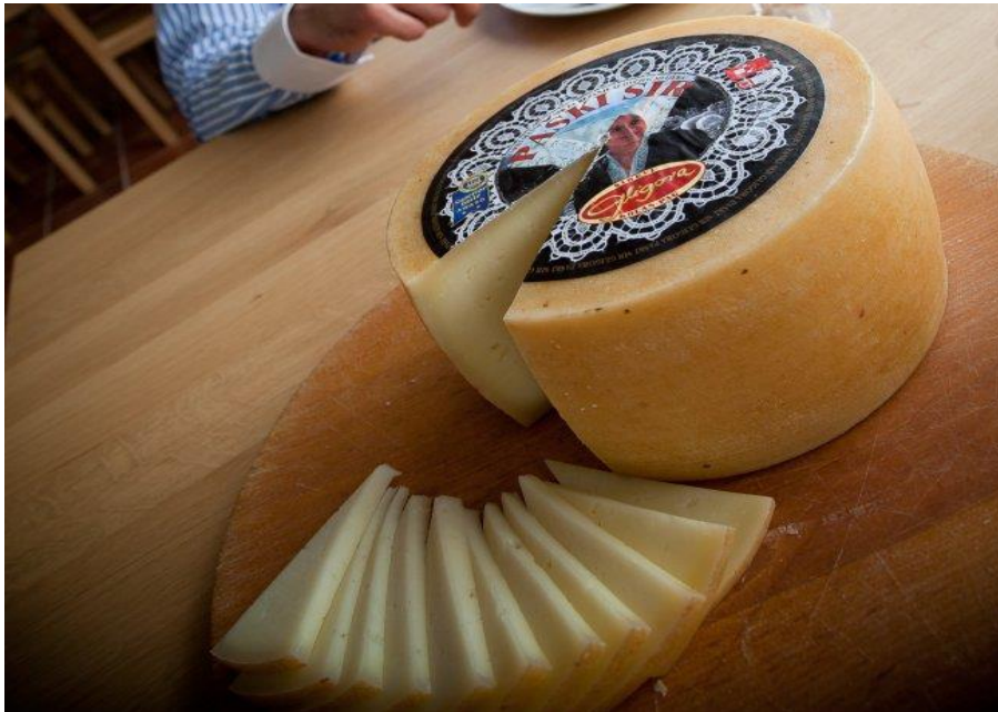
Slika 7. Paški sir

Paški sir spada u kategoriju tvrdih ovčjih sireva. Pravilnog je i cilindričnog oblika, promjera od 8-22 cm, visine 7-8 cm i mase 2-3 kg. Jednolike je žutosmeđe boje, a na prerezu sirno tijesto je jednolično žute boje. Guste je strukture, s manjim brojem sitnih šupljina i male elastičnosti. Ima osebujan miris ovčjeg mlijeka koji je ugodan i karakterističan za ovčje sireve, krhak je i topi se u ustima, te je oštrog i pikantnog okusa.