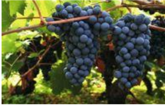
Slika 10. Sorta plavac mali