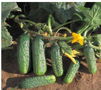
Slika 6. Hibrid krastavca Crispina F1