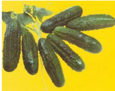
Slika 9. Hibrid krastavca Regal F1

Regal F1 - vrlo popularan hibrid krastavca s pretežno ženskim cvjetovima. Plodovi odlične kvalitete i ujednačenog izgleda. Odličan omjer dužine i promjera ploda 3.3:1. Posjeduje odlična svojstva pri preradi.