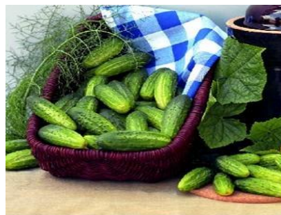
Slika 11. Hibrid krastavca Alibi F1

Alibi F1 - bradavičasti krastavac koji nije partenokarpni već pretežno ženski. Dobre čvrstoće, svjetlije boje i bez gorčine. Vrlo tolerantan prema pepelnici i mozaiku virusa krastavca. Otporan na Cladosporium . Od sadnje do berbe potrebno mu je oko 80 dana.