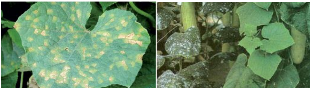
Slika 18 i 19. Simptomi plamenjače i pepelnice na listovima krastavca

Zaštita započinje kada kad krastavac razvije 3-4 prava lista. Plamenjača se može suzbiti fungicidima s površinskim djelovanjem, npr. DITHANE M-45 u koncentraciji 0.15%, RADOZINEB WP u koncentraciji od 0,25%, QUADRIS SC , koji je lokalno-sistemični fungicid, u koncentraciji od 0,075% - 0,1%. Vrlo djelotvorni u zaštiti i suzbijanju plamenjače je kontaktni preventivni fungicid CUPRABLAU SC (Cu 35% + Zn 20 2%) koji se koristi u koncentraciji od 0,3-0,4% ili u količini 3-4 kg/ha (30-40g u 10l vode na 100 m 2 ).