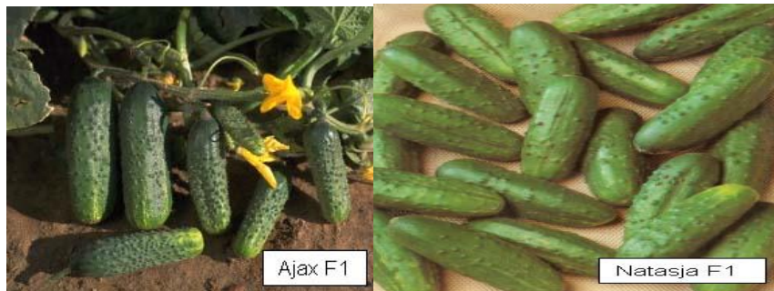
Slika 12. Sorta krastavca Ajax F1 i Natasja F1

Ajax F1 i Natasja F1 – visoki prinosi, pravilni plodovi. Ima manje deformiranih i netržnih plodova. Preradbena kvaliteta je na visokoj razini.