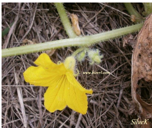
Slika 1. Cvijet krastavca