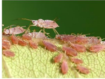
Slika 22. Lisne uši Aphididae sp.