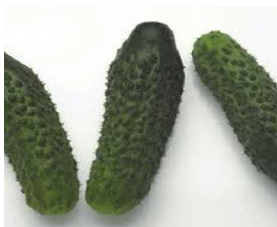
Slika 7. Hibrid krastavca Motiva F1

Motiva F1 - bradavičasti, partenokarpni hibrid. Snažnog je porasta sa odličnom sposobnošću regeneracije nakon berbe. Plodovi su nešto svjetlije boje, vrlo dobre konzistencije. Posebno se preporučuje za berbu I. i II. klase. Otporan je na pepelnicu, Cladosporium , a visoko tolerantan prema CMV virusu.