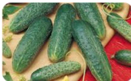
Slika 8. Hibrid krastavca Asterix F1

Asterix F1 - pretežno ženski bradavičasti hibrid. Visoko je tolerantan na plamenjaču, pepelnicu i mozaik virusa krastavca. Otporan na Cladosporium . Plodovi su tamnozeleno boje i bez gorčine. Od sadnje do prve berbe potrebno mu je oko 85 dana.