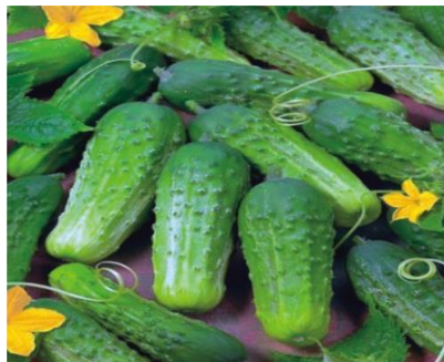
Slika 5. Pariški kornišon