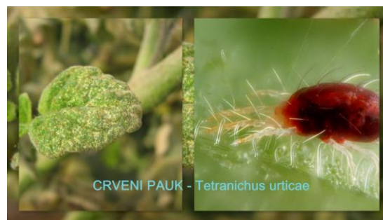
Slika 21. Crveni pauk Tetranychus urticae

Crvenom pauku ne odgovara vlažna okolina, pa je jedna od mjera suzbijanja i češće zalijevanje ili orošavanje nasada. Od velike važnosti je da se u zaštićenom prostoru i oko njega, pred sadnju i tijekom vegetacije uklanjaju korovi i biljni ostaci te njihovo redovito iznošenje iz zaštićenog prostora, čišćenje staza, podizanje zračne vlage, sadnja nezaraženih sadnica i redovita kontrola sadnica. Kod kemijskih mjera su sredstva dosta ograničena a najčešće se koristi VERTIMEC 018 EC u količini od 0,3 – 1,2 l/ha.