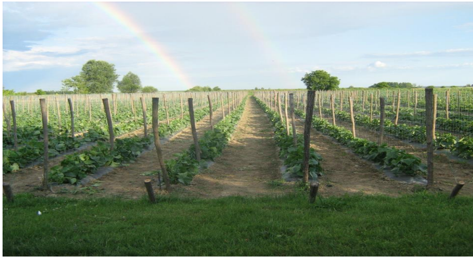
Slika 15. Uzgoj krastavca na armaturi ( izvo.foto )

između rupa je 30 cm. Sjetva se obavlja na dubinu od 2 – 3 cm, gdje u svaku kućicu idu 2 sjemenke.