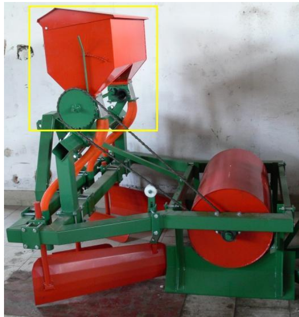
Slika 13. Stroj za formiranje humaka - postavljanje folije i deponiranje gnojiva na humak

Pri takvom načinu uzgoja, ako se koristi navodnjavanje tada se na polagaču ili gredičaru folije postavlja i dio na koji ide kotur drena ili dripa, tj. cijevi za navodnjavanje, koji se zajedno sa folijom postavljaju istovremeno (drip ide ispod folije).