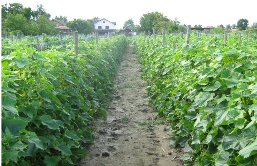
Slika 2. Uzgoj krastavca na armaturi (izv .foto)

Kod nas se krastavac uzgaja na površini od oko 5.400 ha. U Hrvatskoj se godišnje proizvede oko 35 000 tona s prosječnim prinosom od 6,5 t/ha. Za potrebe prerade kod nas se godišnje organizira proizvodnja na oko 400 ha, a s te površine se proizvede oko 7 000 tona krastavaca.