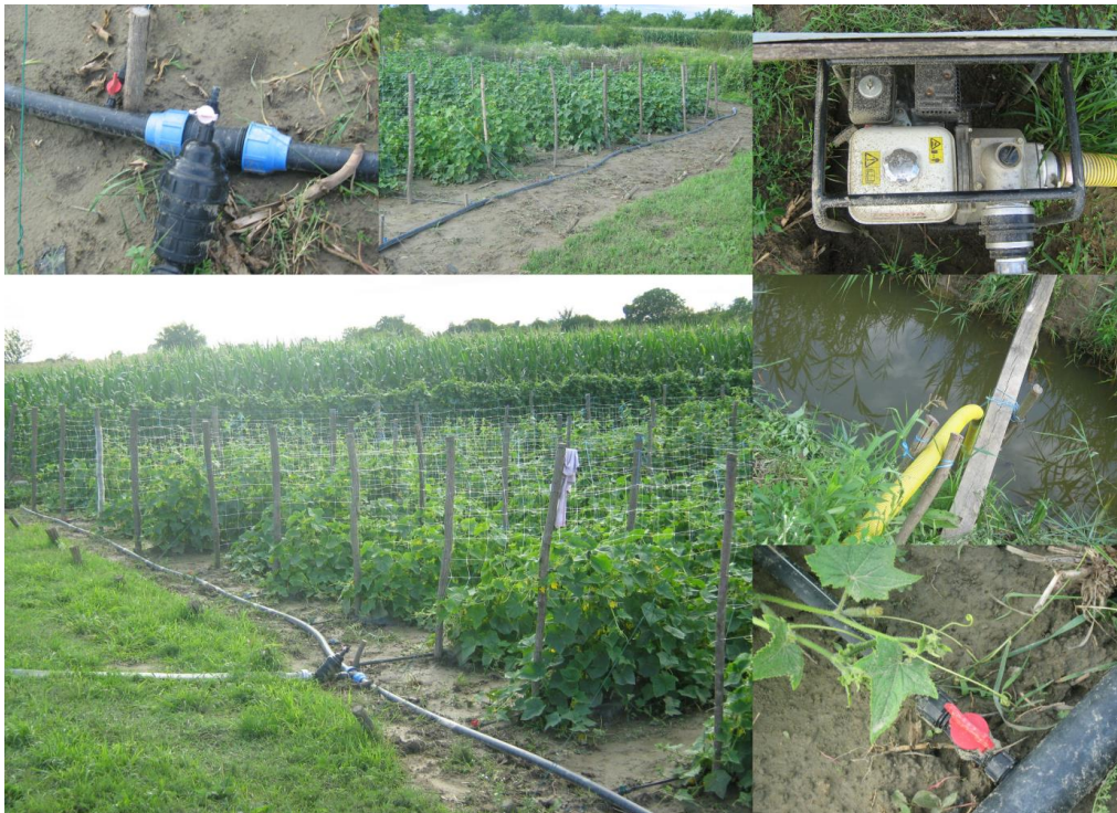
Slika 17. Sustav za navodnjavanje pri uzgoju krastavca na armaturi

Sustav za navodnjavanje, na poljoprivrednom gospodarstvu Podravska Moslavina, sastoji se od crpke za navodnjavanje Honda WB 30 XT, rebraste usisne cijevi promjera 100 mm, vatrogasnog crijeva dužine 15 metara i promjera 60 mm, drenova za navodnjavanje dužine od 5 700 m, alkatana koji je promjera 60 mm, spojnice za alkatan s pročištačem, malih spojnica za drenove u slučaju da je dren negdje oštećen ili da ga je nešto pregrizlo, 40 komada pipa za navodnjavanje koje spajaju alkatan i dren u redu krastavca te čepa za alkatan.