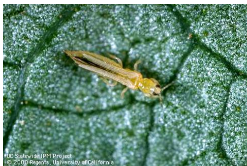
Slika 20. Kalifornijski trips Frankliniella occidentalis

Zaštita se provodi primjenom insekticida MOSPILAN 20 SP u koncentraciji od 0,0125%, CALYPSO SC 480 u koncentraciji od 0,02 %, te LASER u koncentraciji od 0,04 – 0,05 %.