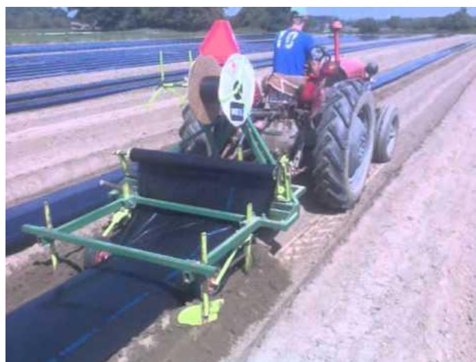
Slika 14. Stroj za postavljanje crne folije i drena za navodnjavanje

Folija sprečava rast i razvoj korova, onemogućuje direktan kontakt nadzemnih dijelova biljke sa tlom pa su smanjene infekcije bolestima čiji se uzročnici nalaze u tlu, a plodovi su čisti.