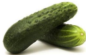
Slika 4. Rajnski kornišon

Od krastavaca za preradu (kiseljenje) najraširenija je sorta Pariški kornišon. Do tehnološke zriobe treba joj oko 50 dana. Plodovi su s gustim krupnim bradavicama i crnim bodljama, a u redovitoj berbi postižu dužinu od 4-12cm. Od sorata u tipu kornišona za uzgoja u vrtovima koristi se Rajnski kornišon.