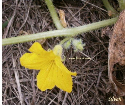
Slika 1. Cvijet krastavca