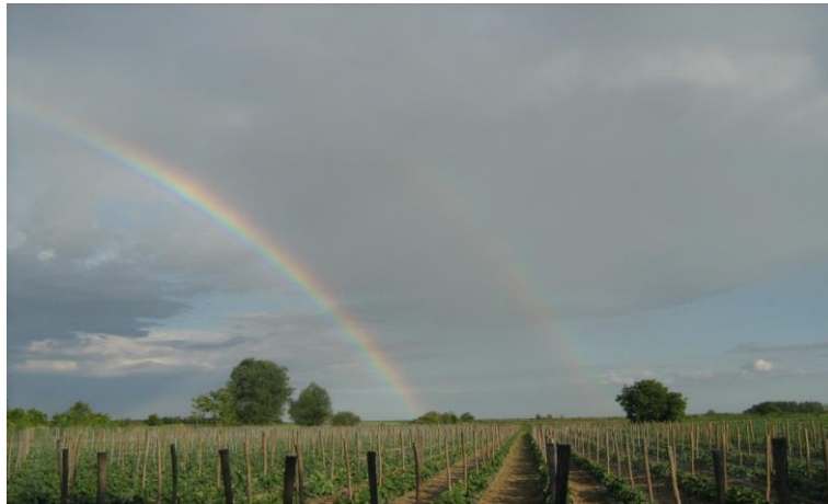
Slika 3. Uzgoj krastavca na armaturi na OPG Podravska Moslavina ( izv.foto )

Od povrća kao predkulture za krastavac trebalo bi izbjegavati rajčicu i krumpir. Dobre pretkulture su mahunarke, lukovičasto povrće, paprika i strne žitarice. Krastavci su jako osjetljivi na herbicide produženog djelovanja primjenjenim u prethodnim kulturama. Radi toga treba izbjegavati predkulture kao što je kukuruz koji je tretiran triazinskim preparatima. Krastavac je dobra predkultura za rajčicu, kupus i papriku.