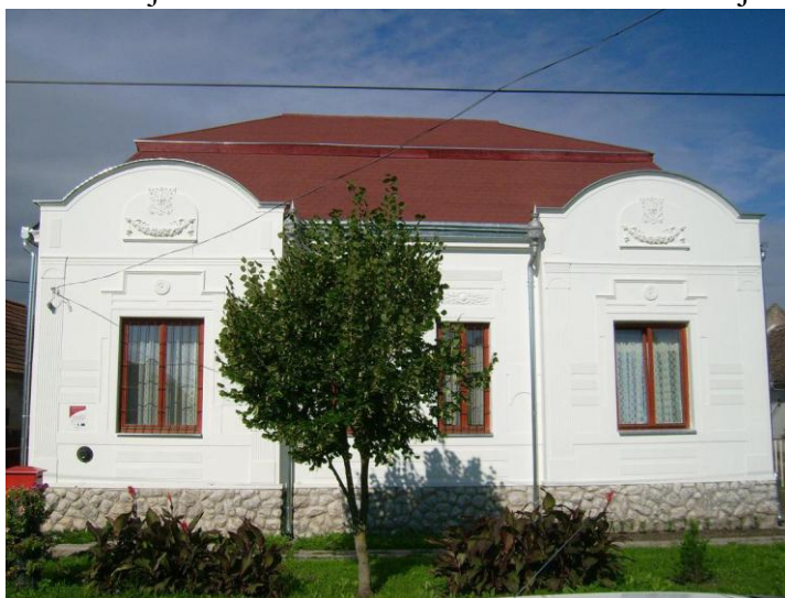
Slika 4.: Renovirana pošta

pošte funkcionirati tzv. mobilna pošta. Mobilna pošta je funkcionirala na sljedeći način: svakodnevno je jednom prešla selo kako bi ljudi mogli obaviti svoje poslove u vezi pošte. Tada je uprava sela odlučila da ovu uslugu neće napustiti. Lokalna samouprava se složila s poštom da će oni plaćati operativne troškove zgrade pošte, dok plaću poštara treba samo pošta platiti.