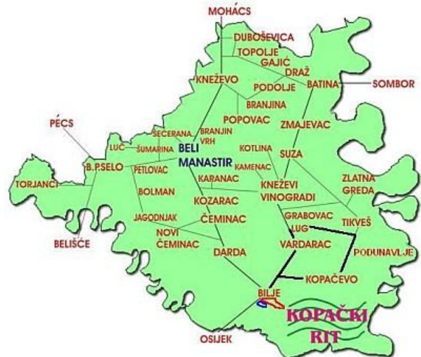
Slika 2.: Karta LAG-a Baranje

Baranja je jedno cjelovito geografsko područje koje je smješteno u središnjem dijelu Panonske nizine, tj. nalazi se na sjeveroistočnom dijelu Republike Hrvatske. Trianonskim mirovnim ugovorom, koji je sklopljen nakon Prvog svjetskog rata, područje je podijeljeno na mađarski i hrvatski dio. Hrvatski dio obuhvaća jednu trećinu, dok mađarski dvije trećine.