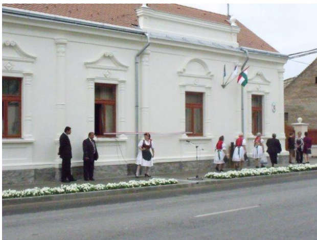
Slika 6.: Renovirana zgrada općine

Unatoč nepovoljnim uvjetima lokalna samouprava zajedno sa svojim aktivnim partnerima redovito ispisuje natječaje za institucije obrazovanja, zdravlja, kulturne aktivnosti, socijalnih usluga kako bi poboljšali okoliš i kvalitetu života. U naselju je romska populacija niža od prosjeka regije za 14,2%.