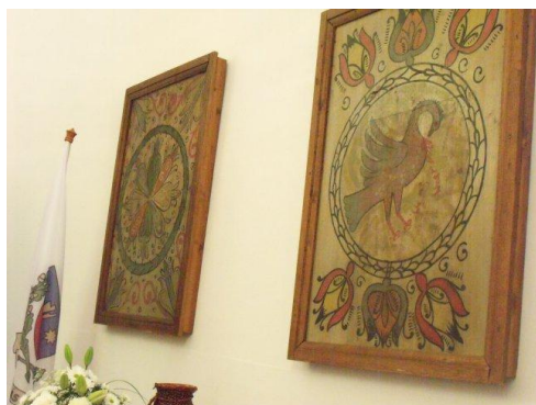
Slika 7.: Oslikane kasete na zidu crkve

Pomoću Programa ruralnog razvoja Nove Mađarske crkva je obnovljena izvana i iznutra, dok je župa obnovljena samo izvana.