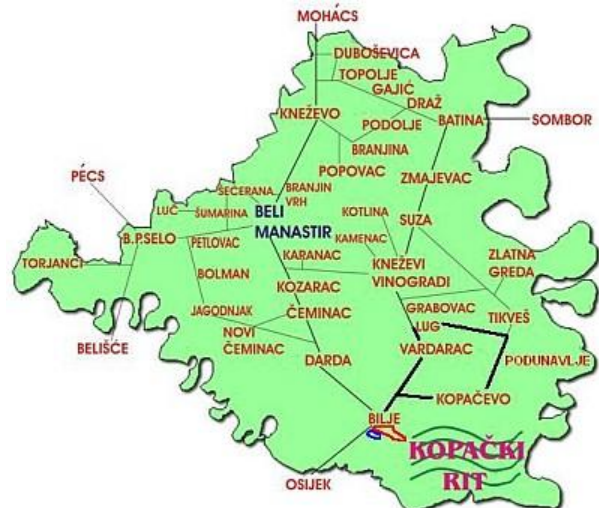
Slika 2.: Karta LAG-a Baranje

Baranja je jedno cjelovito geografsko područje koje je smješteno u središnjem dijelu Panonske nizine, tj. nalazi se na sjeveroistočnom dijelu Republike Hrvatske. Trianonskim mirovnim ugovorom, koji je sklopljen nakon Prvog svjetskog rata, područje je podijeljeno na mađarski i hrvatski dio. Hrvatski dio obuhvaća jednu trećinu, dok mađarski dvije trećine.