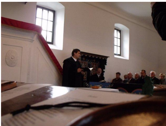
Slika 5.: Reformatska crkva

Unutar okvira programa Reformatska crkvena zajednica regije Kovácshida dobila je za radove nepovratni iznos od 6 720 kn (244 284 Ft) 8 , što ujedno pokriva 100% neto radove.