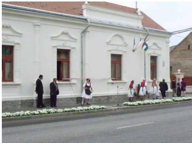
Slika 6.: Renovirana zgrada općine

Unatoč nepovoljnim uvjetima lokalna samouprava zajedno sa svojim aktivnim partnerima redovito ispisuje natječaje za institucije obrazovanja, zdravlja, kulturne aktivnosti, socijalnih usluga kako bi poboljšali okoliš i kvalitetu života. U naselju je romska populacija niža od prosjeka regije za 14,2%.