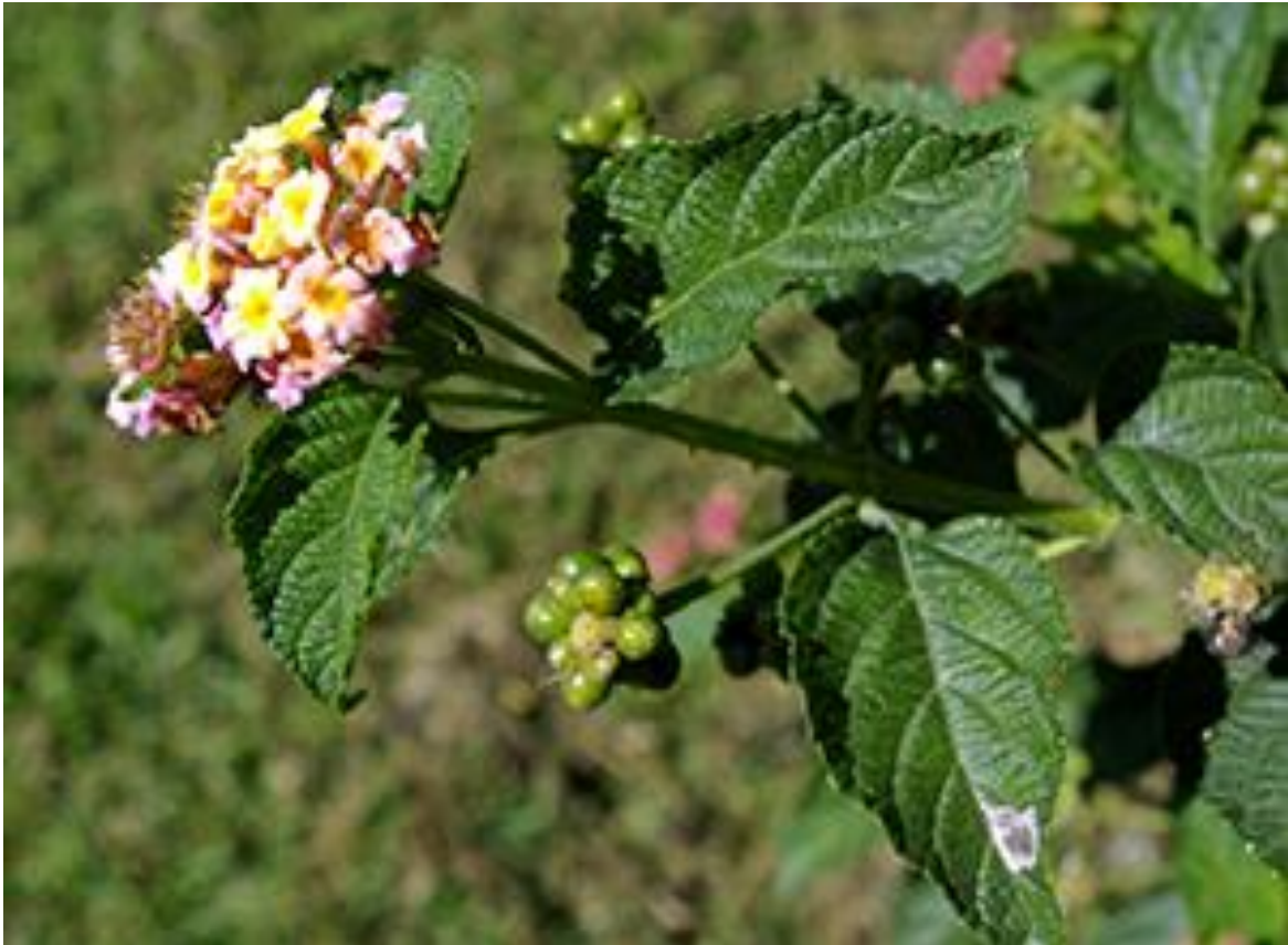
Slika 10. Lantana camara