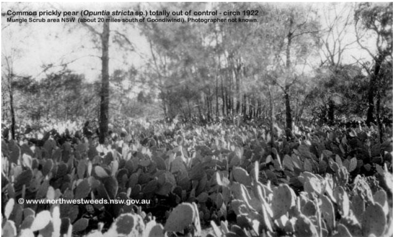
Slika 3. Površine u Australiji inficirane kaktusom