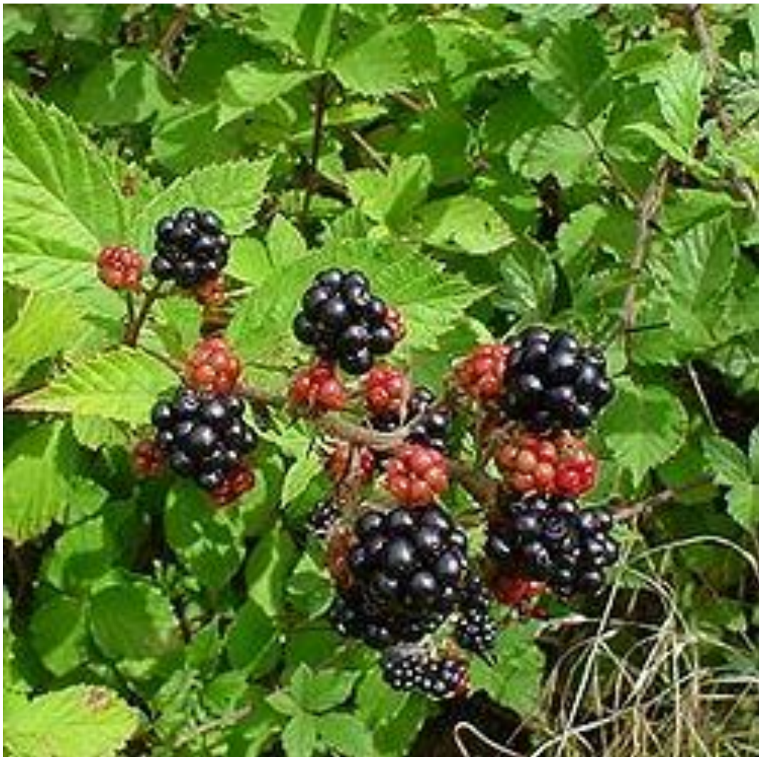
Slika 14. Rubus spp.

Još jedna patogena gljiva, hrđa Phragmidium violaceum , unešena je iz Europe u Čile i Australiju za potrebe biološkog suzbijanja divlje kupine Rubus spp. Divlja kupina je grm ili penjačica, čije su stabljike povinute u luku i duge od 60 do 300 cm (Slika 14.). Prekrivene su bodljicama i jakim trnjem, a u dodiru s tlom se vrlo lako zakorjenjuju. Ima sastavljene listove (3-5 ovalnih lisaka). Cvjetovi su bijele boje, a plod je zbirna koštunica crne ili tamnocrvne boje.