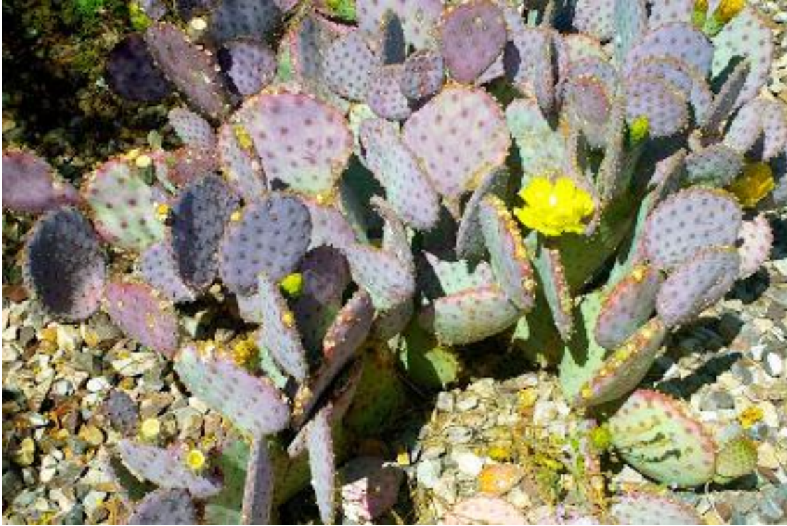
Slika 2. Opuntia ficus-indica (L.) Miller. (indijska smokva)

svibnja do srpnja, a cvjetovi su veliki, sjedeći i žute boje. Plod je jajasto-kruškolika žuta ili crvena boba.