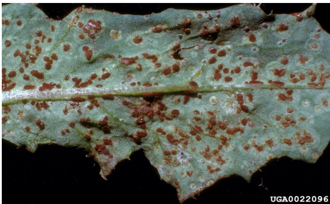
Slika 13. Puccinia chondrillina

Puccinia chondrillina (Slika 13.) je gljivica koja pripada pododjelu Basidiomycota , razredu Hemibasidiomycetes i redu Uredinales . Hrđa je aktivna tijekom cijele godine i može zaraziti sve nadzemne dijelove biljke. Od proljeća do jeseni na biljci se razvijaju smeđi uredosorusi. Uredosorusi se mogu djelomično ili u potpunosti razviti i prekriti lišće i stabljike. Na zaraženim dijelovima biljke uočavaju se rane, smanjena je fotosinteza, povećana je osjetljivost biljaka na druge patogene, smanjena je proizvodnja sjemena i zaustavljen rast biljke.