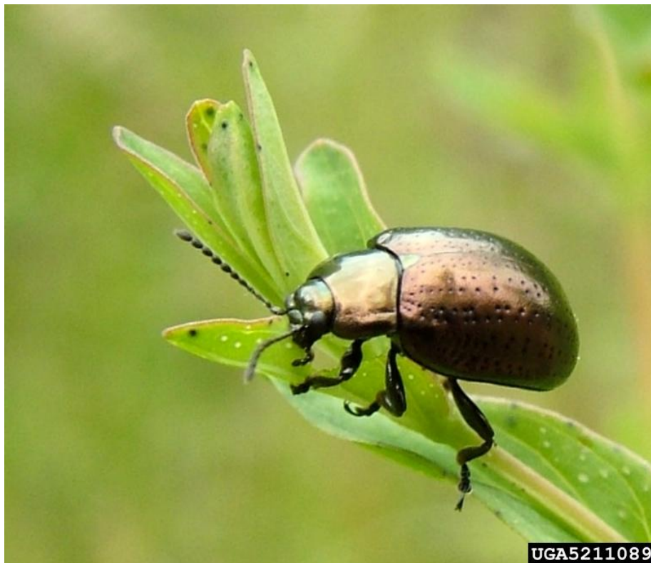
Slika 9. Chrysolina quadrigemina

Chrysolina quadrigemina pripada porodici Chrysomelidae (zlatice) i redu Coleoptera (kornjaši). Imago je metalik plavo do zeleno obojen i dužine 7 mm.