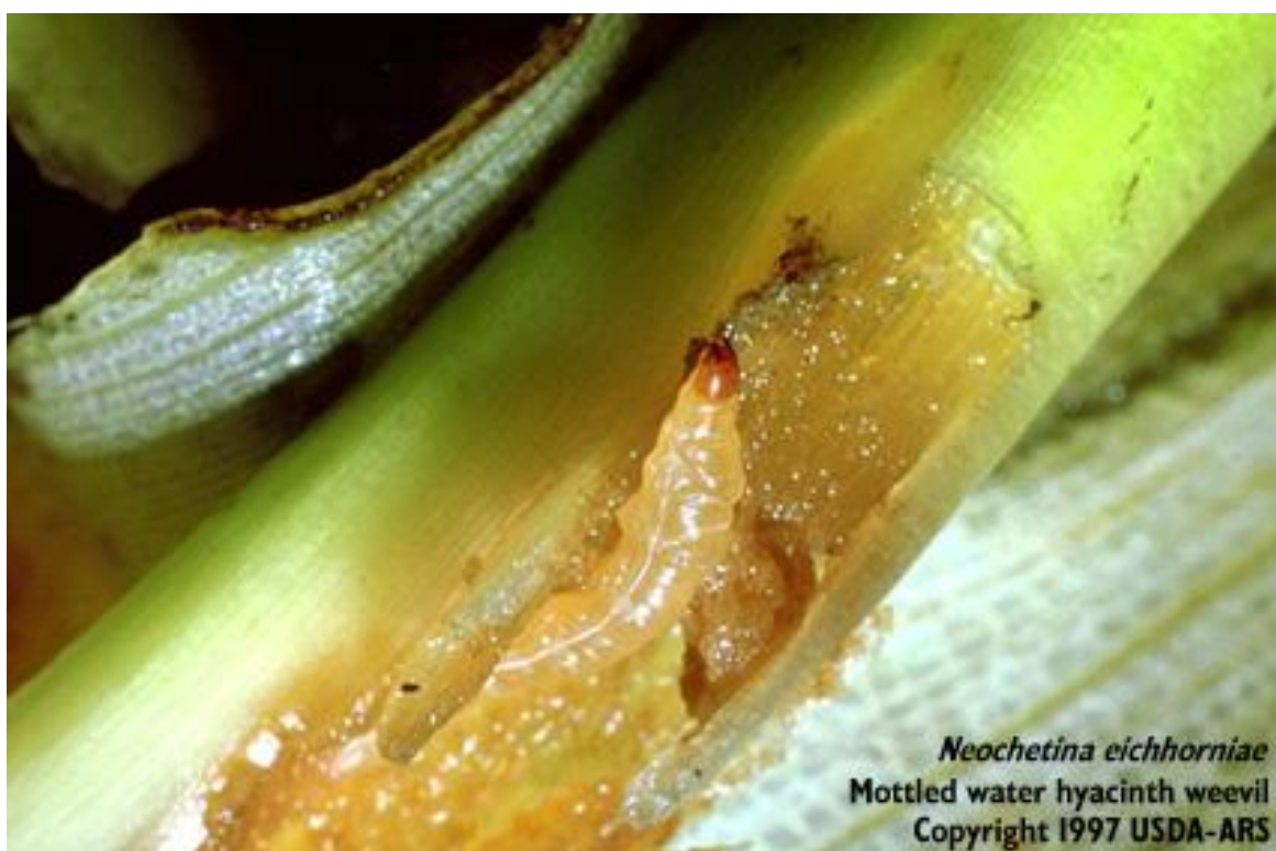
Slika 17. Oštećenja na listovima uzrokovana napadom pipe

Moljac Sameodes albiguttalis i pipe Neochetana brudhi i N. eichhorniae pokazale su se kao najuspješnije u suzbijanju ovog korova. Oni oštećuju listove, čime rast biljke postaje usporen i ona ugiba.