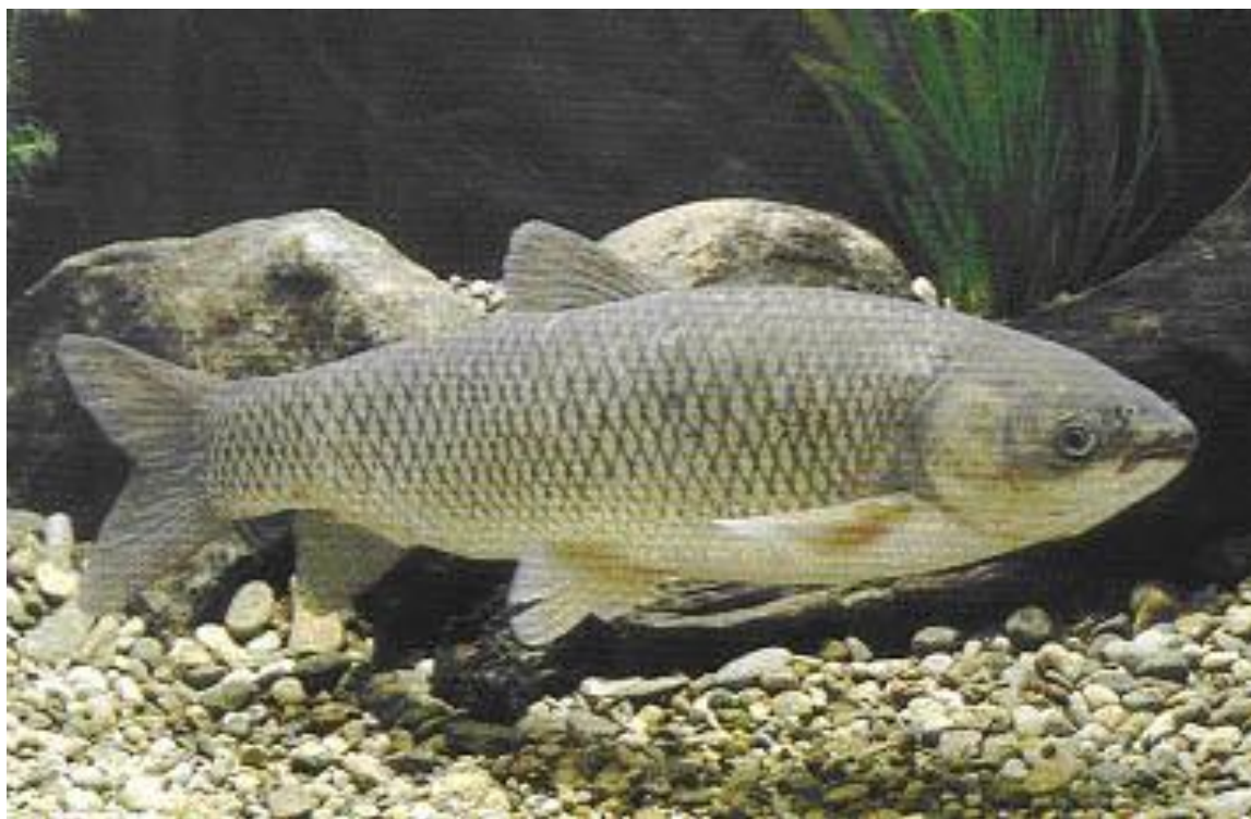
Slika 18. Bijeli amur Ctenopharyngodon idella

Za suzbijanje akvatične korovne vegetacije moguće je koristiti i herbivorne ribe, mada ograničenog dometa, jer su mnoge herbivorne ribe osjetljive na niske temperature. To ih čini ograničavajućim čimbenikom za mnoge regije kontinentalnog klimata. Izuzetak je jedino bijeli amur Ctenopharyngodon idella (Slika 18.).