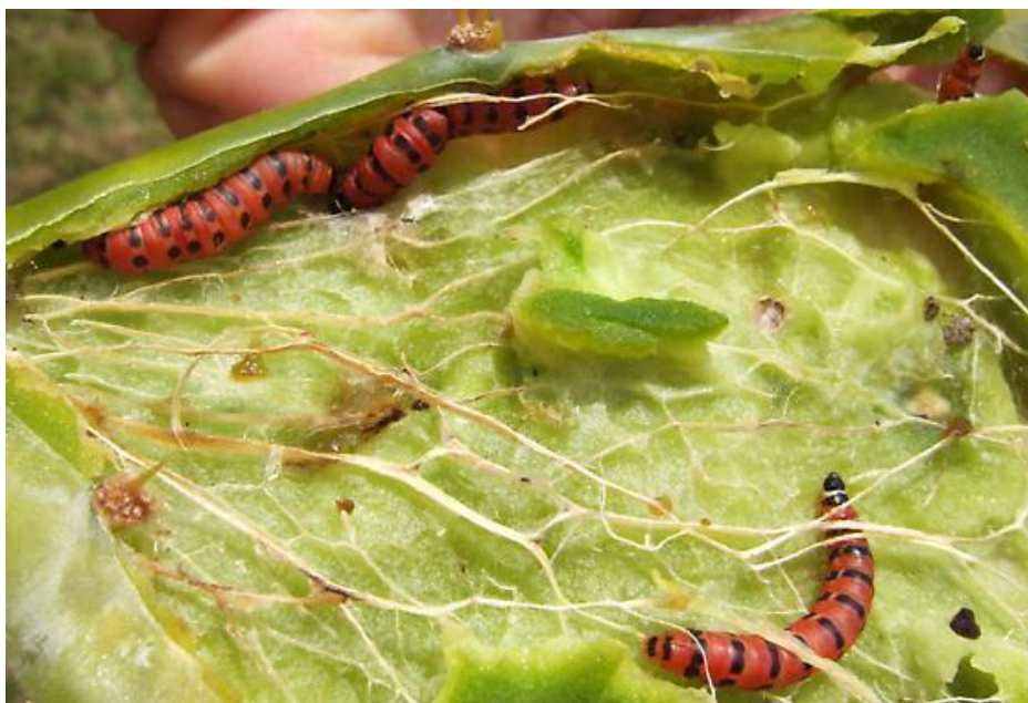
Slika 5. Ličinke moljca unutar kutikule kaktusa

potpunog uništenja kaktusa. Moljac prezimi kao ličinka. Nakon nekog vremena napušta biljku i prelazi na drugu. Tijekom iznimno toplog vremena može se nalaziti u grupama na donjoj strani listova. Mogu se zakukuljiti u krhotine, na otalim listovima i kori stabala. Kukuljenje traje 3 do 6 tjedana. Međutim, zbog velike zaraze kaktusom došlo je do pada populacije Cactoblastis cactorum te je u razdoblju od 1931. do 1933. uslijedio ponovni rast kaktusa.