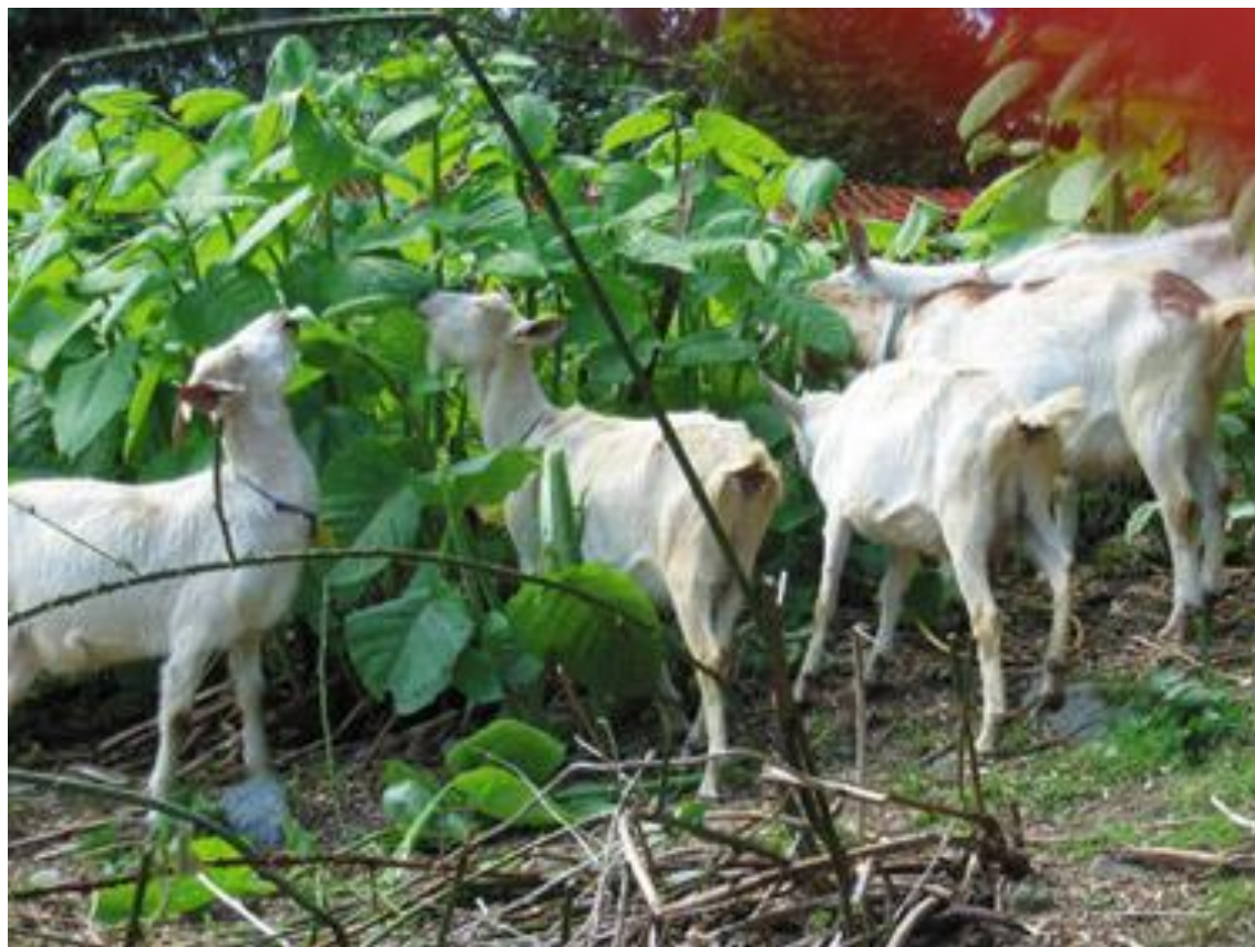
Slika 19. Suzbijanje invazivnih korova pomoću koza

Biološko suzbijanje uključuje i uporabu koza, ovaca i peradi kao vrlo učinkovite pri suzbijanju korova (Slika 19.). Ove životinje mogu vrlo uspješno odstraniti svu nepoželjnu vegetaciju u mnogim situacijama.