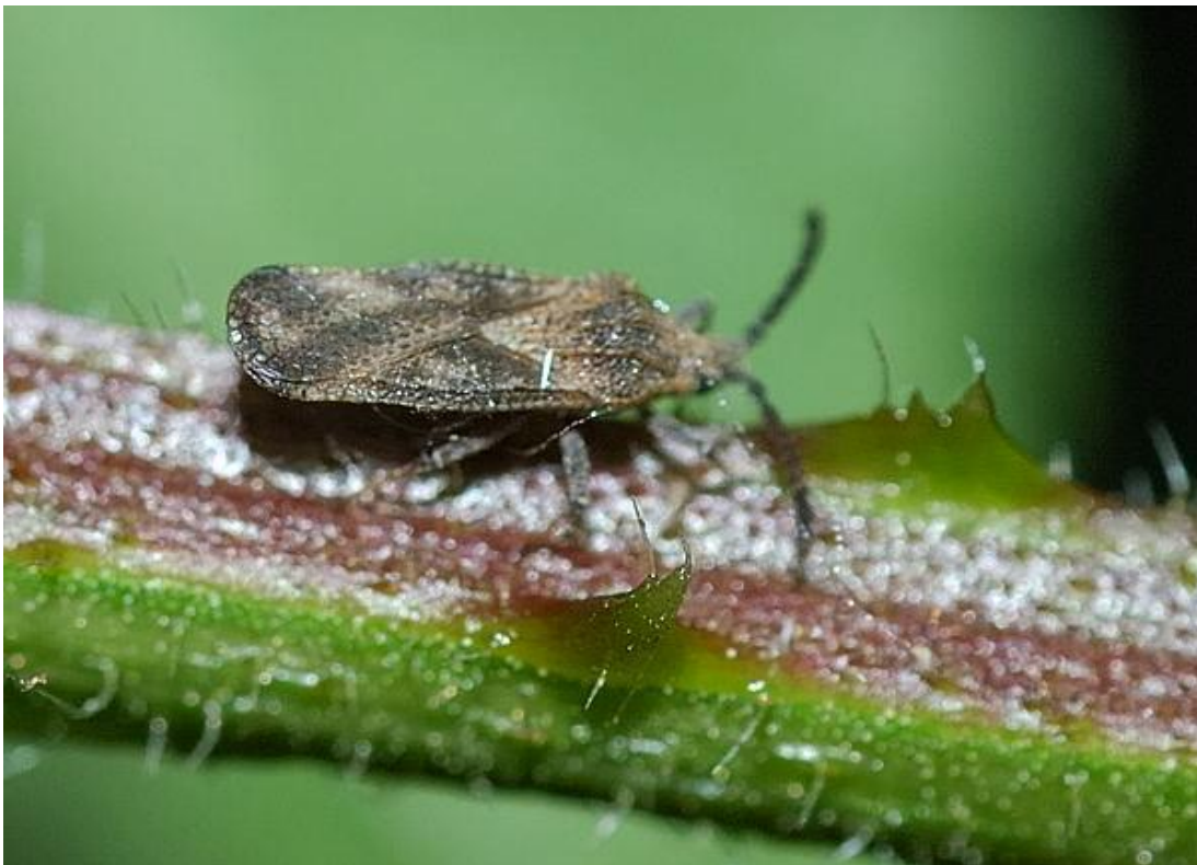
Slika 11. Teleonemia scrupulosa na stabljici

Prema izvješćima iz 1982. godine, ovaj insekt je kao biološki agens uvezen u 20 zemalja, ali stupanj kontrole korova Lantana cumara varirao je od dobrog do nezadovoljavajućeg (Julien, 1982.).