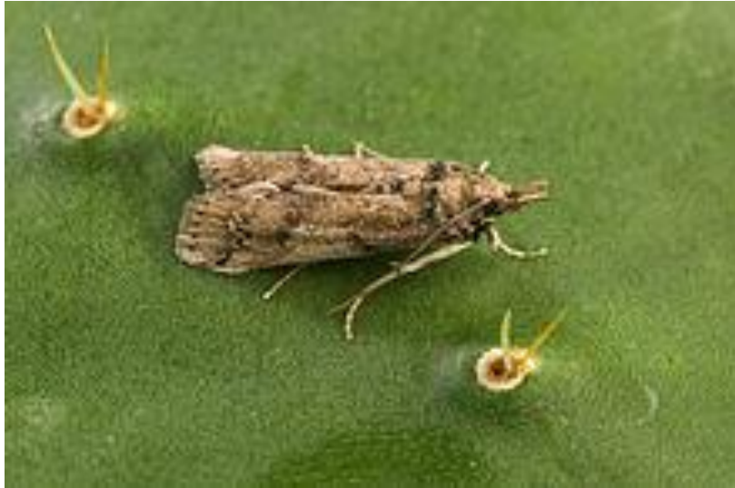
Slika 4. Moljac Cactoblastis cactorum