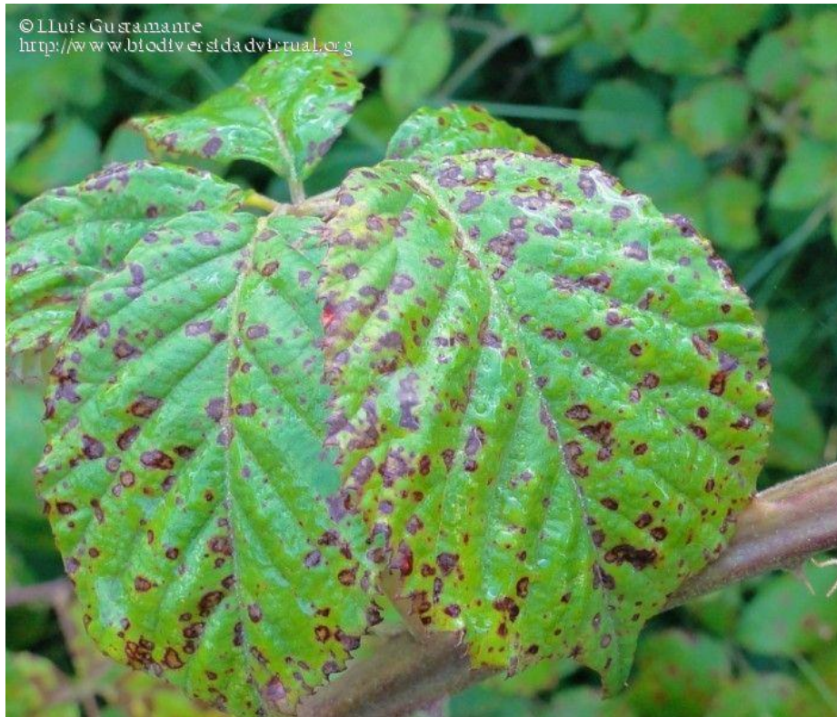
Slika 15. Phragmidium violaceum na divljoj kupini

Tijekom 1973. godine u Čile je, za potrebe biološkog suzbijanja divlje kupine, introducirana gljiva Phragmidium violaceum koja također pripada redu Uredinales . On je makrociklički patogen, a životni ciklus se isključivo odvija na divljim kupinama (Slika 15. Učinkovitost infekcije je najjača na mladim, aktivno rastućim tkivima (Gomez i sur., 2008.).