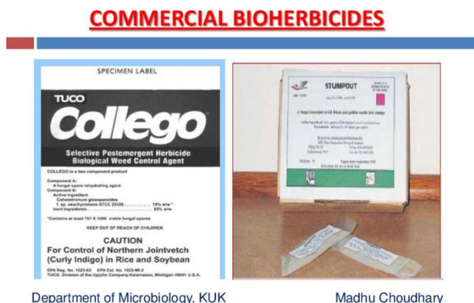
Slika 20. Collego® na osnovi Colletotrichum gloeosporioides f.sp. aeshynomene

Bioherbicid Dr.Bio Sedge® na osnovi je hrđe Puccinia canaliculata i registriran je za suzbijanje vrste Cyperus esulentus (jestivi šilj). Izolat bakterije Xanthomonas campestris pv. Poae izoliran je u Japanu iz vrste Poa annua (jednogodišnja vlasnjača). Bioherbicid Stumpout® na osnovi je basidiomicete Cylindrobasidium laeve i koristi se u suzbijanju izdanaka u rasadnicima drveća i na prirodnim staništima.