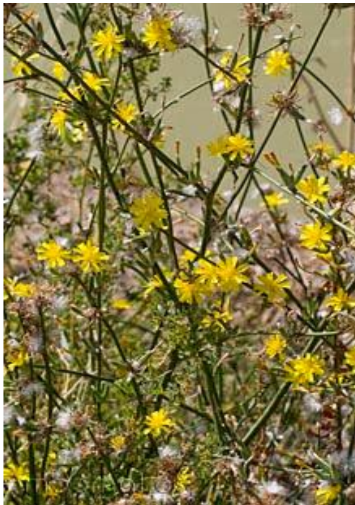
Slika 12. Chondrilla juncea

Chondrilla juncea (Slika 12.) ili zvečka je korov porijeklom iz Europe, Azije i sjeverne Afrike, a invazivna je u mnogim regijama svijeta s umjerenom klimom. Pripada porodici Asteraceae (glavočike).