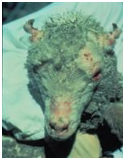
Slika 7. Simptomi fotosenzitivnosti nakon konzumacije gospine trave