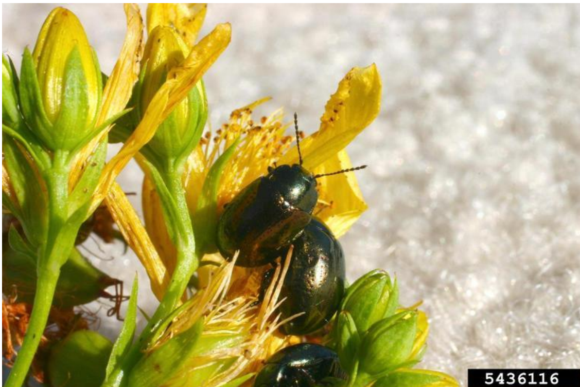
Slika 8. Chrysolina quadrigemina na gospinoj travi

Chrysolina hyperici je puštena u prirodu u proljeće 1945. A Chrysolina quadrigemina u veljači 1946. Obje vrste su se vrlo brzo prilagodile, međutim ubrzo je postalo jasno kako je C. quadrigemina dominantna i vrlo uspješna u suzbijanju gospine trave (Slika 8.).