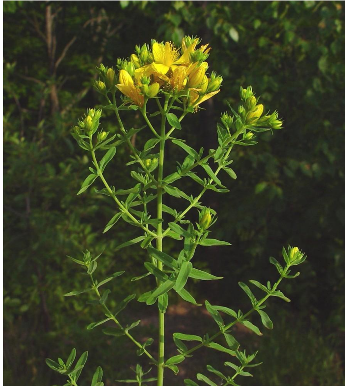
Slika 6. Gospina trava- Hypericum perforatum