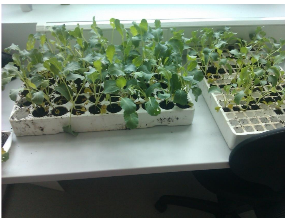
Slika 5. Presadnice u polisterinskim kontejnerima različitog volumena tla

Kontejneri koji su se koristili su polistirenski, dužine 50 cm i širine 33 cm, s 209 sjetvenih mjesta i sa 60 sjetvenih mjesta (Slika 5). Od svake je sorte posijano po 40 biljaka u kontejner s 209 sjetvenih mjesta i 40 biljaka u kontejner sa 60 sjetvenih mjesta. Sveukupno je bilo posijano 160 biljaka od kojih je bilo 40 od svake sorte u kontejnerima s 209 sjetvenih mjesta i 40 od svake sorte u kontejnerima sa 60 sjetvenih mjesta. Kontejneri su se punili supstratom za povrćarske kulture Klasmann potgrond P. To je mješavina smrznutog crnog sphagnum treseta i finog bijelog sphagnum treseta. Dodano vodotopivo gnojivo i mikroelementi. Supstrat je fine strukture 0-5 mm i pH vrijednosti 6. Takav supstrat preporuča se za kontejnere i hranjive kocke do 6 cm.