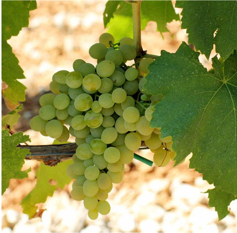
Slika 11. Prateća sorta žilavke –Bena