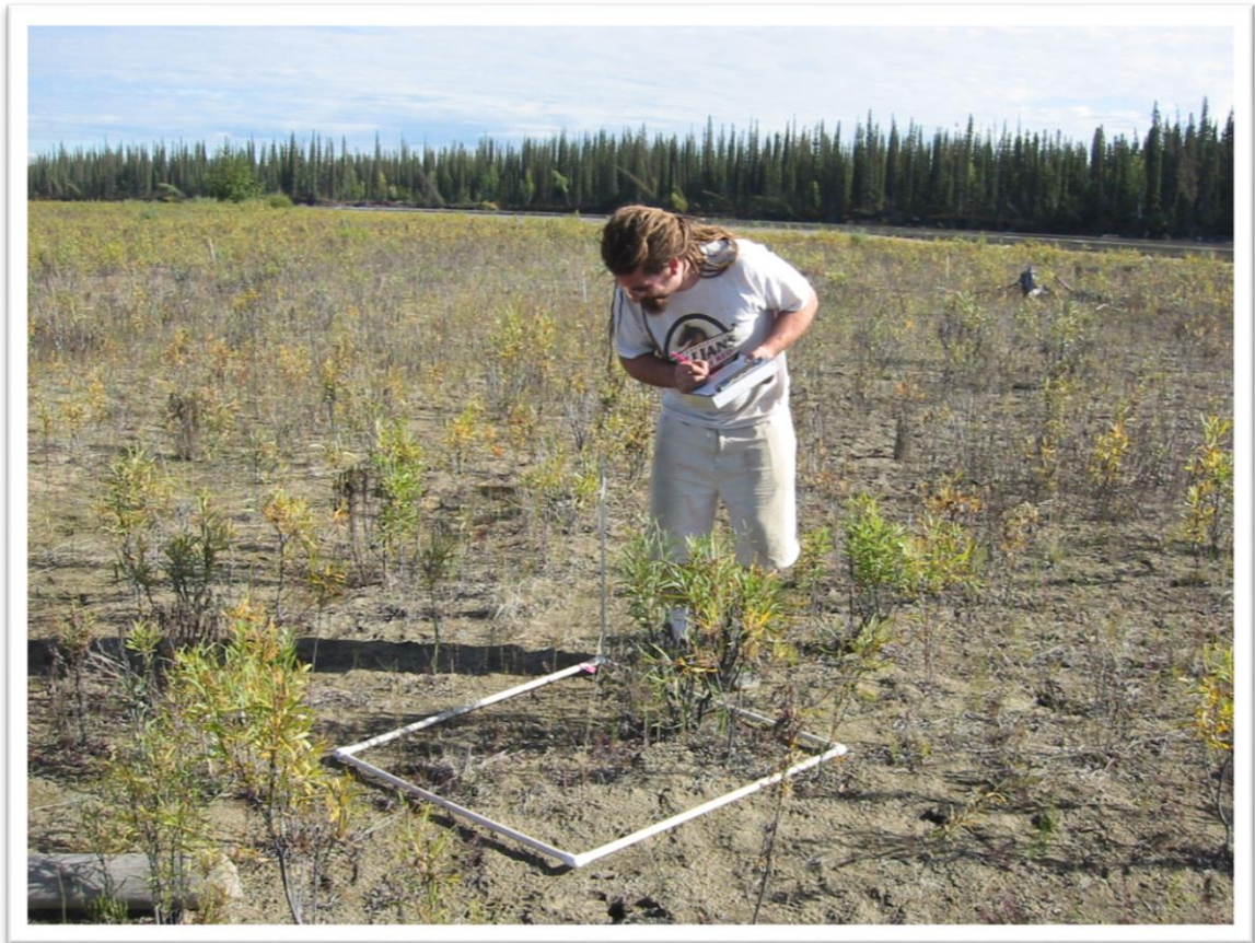
Slika 1. Kartiranje korova metodom slučajnih kvadrata

http://www.lter.uaf.edu/images/OcularVegetationSurvey.jpg