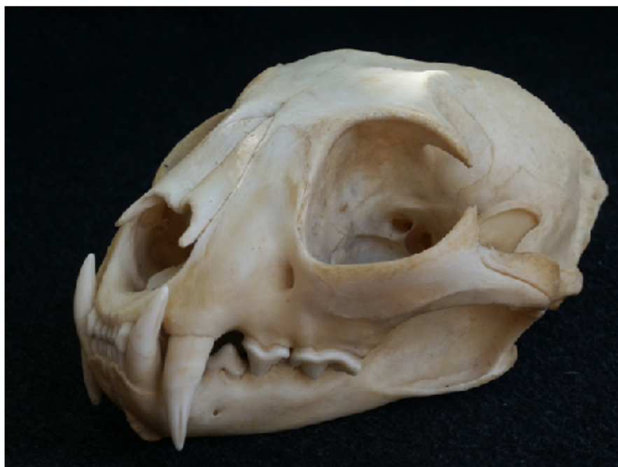
Slika 6. Lubanja risa (izvor: www.life-vuk.hr , pristup: 16.12.2015.)

Pojava drugog donjeg kutnjaka M2 (5,1%) je, međutim, niža u odnosu na druge populacije. Ris ima 28 zubi, zubne formule I 3/3, C 1/1, P 2/2, M 1/1. Lubanje muških jedinki su veće u odnosu na lubanje ženskih jedinki. Ovim istraživanjem utvrđeno da se kranimetrijske vrijednosti populacije balkanskog risa, statistički značajno ne razlikuju od hrvatske i češke populacije.