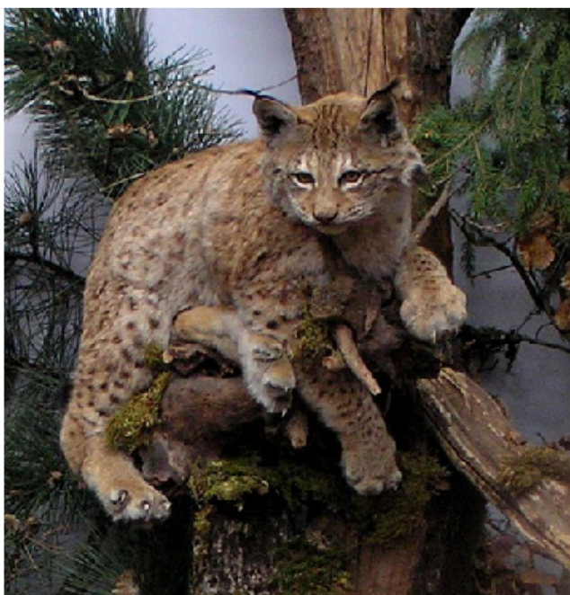
Slika 1. Euroazijski ris

Tijelo je pokriveno gustim tamno ili crvenkasto – sivim krznom, uz karakteristične tamne pjege, podbradak, grudi i trbuh su bijeli. Na vrhu šiljastih uški raste pramen crnih dlaka do 4 cm dugačkih. Kao i sve mačke, risovi imaju okruglaste glave kratke njuške, a u zubalu im se nalazi 28 zuba s jakim očnjacima i kutnjacima oštih rubova, iako ponekad ris može imati još dva zuba (prekutnjaci), ali oni u starijih jedinki otpadnu. Ovaj predator ima jako razvijene osjete vida, sluha, opipa i njuha ( http://wildlife.blogger.ba , 15.11.2015.)