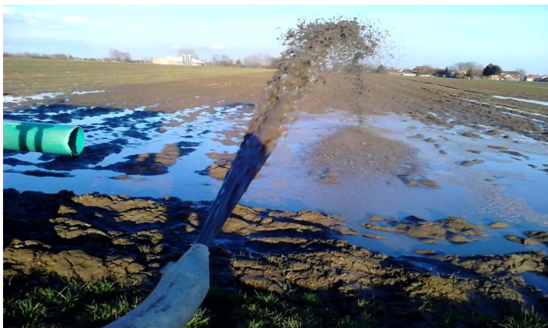
Slika 1. Pretjerano izlivanje gnojovke na poljoprivrednu površinu

Tlo u poljoprivredi ima važnu proizvodnu funkciju i kao „neobnovljiva“ vrijednost iziskuje posebnu pažnju tijekom korištenja te maksimalnu brigu o plodnosti, strukturi, eroziji i onečišćenju. Najčešće štetne tvari u tlu su teški metali, nitrati, fosfati i onečišćenja koja u tlo ulaze primjenom sredstava za zaštitu bilja. Tlo se može onečistiti kroz dulje razdoblje manjom količinom štetnih tvari, nekontroliranim prskanjem ili iznenadnim izlivanjem otpada u nekontroliranom opsegu i količinama. Stanje kvalitete poljoprivrednih tala kontinuirano se pogoršava radi neodgovarajućih biljno-uzgojnih mjera, te zahvata gnojidbe i obrade tla. Posebno štetno na kvalitetu poljoprivrednih tala može djelovati pretjerano izlivanje gnojovke na njihovu površinu, kao što je prikazano primjerom na slici 1.