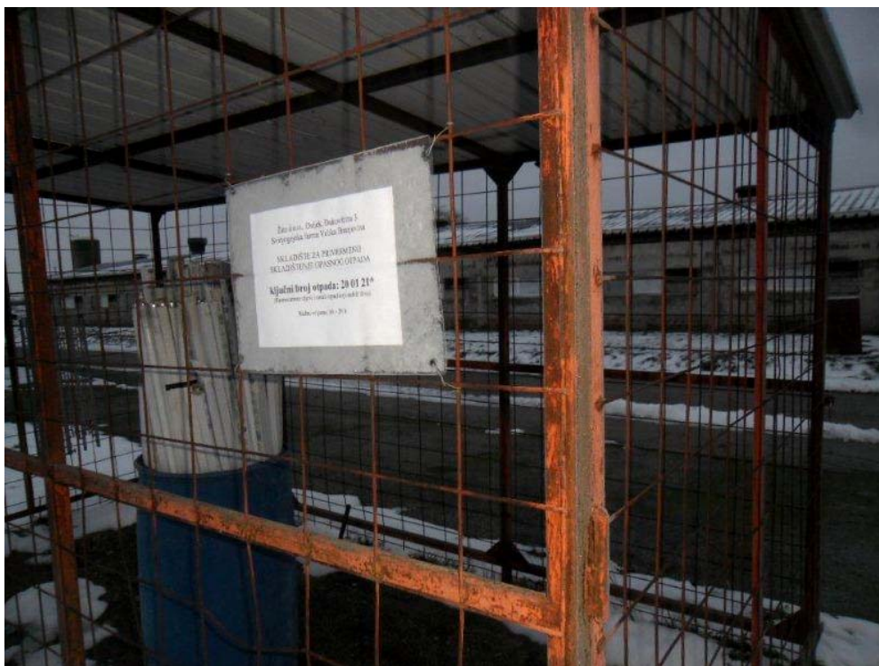
Slika 6. Privremeno skladište opasnog otpada

Podaci o otpadu redovito se unose u Očevidnik o nastanku i tijeku otpada (ONTO) i Prateće listove (PL-O). Kao što je prethodno rečeno, podaci o količinama otpada redovito se upućuju u Registar onečišćavanja okoliša (ROO) koji vodi Agencija za zaštitu okoliša.