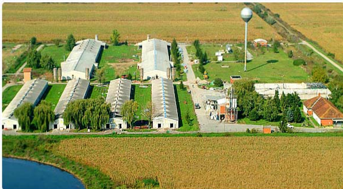
Slika 2. Svinjogojska farma „Velika Branjevina“

Svinjogojska farma Velika Branjevina nalazi se u Osječko-baranjskoj županiji, u Općini Čepin, oko 3 km udaljena od naselja Čepina. Do lokacije farme dolazi se pristupnom lokalnom cestom. Farma se nalazi neposredno uz autocestu A5-Slavonika.