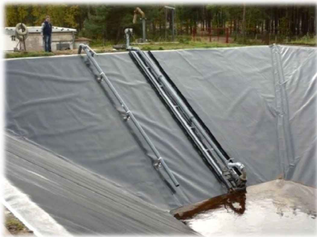
Slika 4. Primjer vodonepropusne lagune za gnojovku