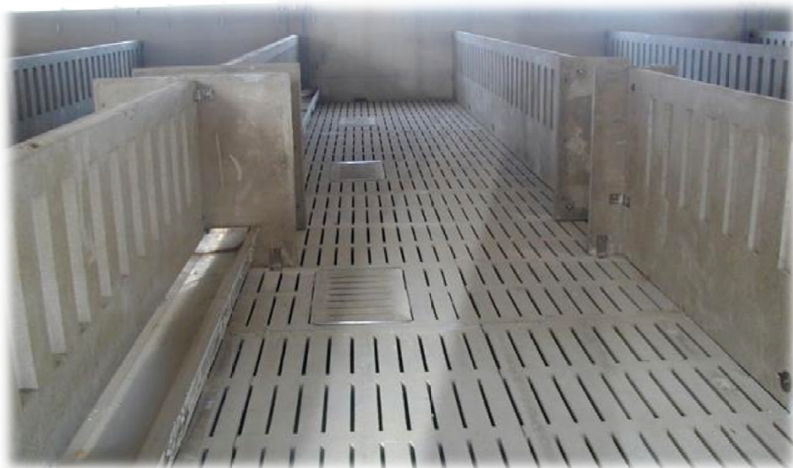
Slika 5. Primjer rešetkastog poda u objektu za držanje svinja

S ciljem smanjenja emisija iz objekata za držanje životinja u objektima mora biti izveden pod s rešetkama koje osiguravaju klizanje izmeta između jame ispod rešetki i time lakše prikupljanje izmeta. Površine na kojima se nalaze životinje moraju biti glatke i lako čistive.