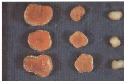
Slika 3. Presjek kvržica

Soja koristi dušik iz zraka preko bakterija koje žive na korijenu biljke u kvržicama (Slika 3.) i nazivaju se kvržične bakterije.