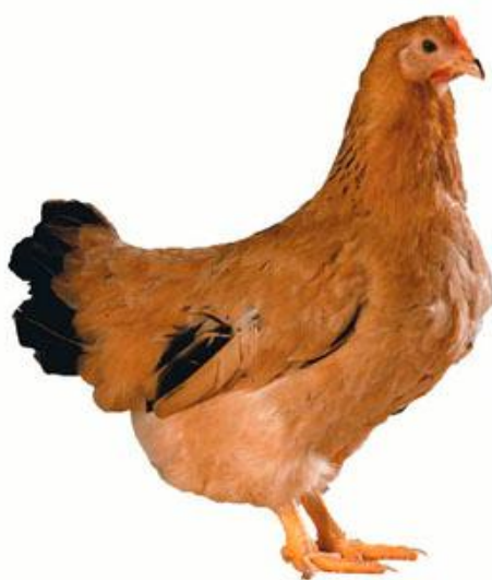
Slika 6. COBB SASSO 150™ (Izvor: The Poultry Site.com, http://www.thepoultrysite.com/focus/cobb/1982/cobb-sasso150-the-natural-choice , 16.08.2011.).

genetski odgovara slobodnom načinu uzgoja. Maksimalni prosječni prirast iznosi do 45 grama po danu. Trup je uniformnog izgleda, a meso sočnog okusa (The Poultry Site, 2011).