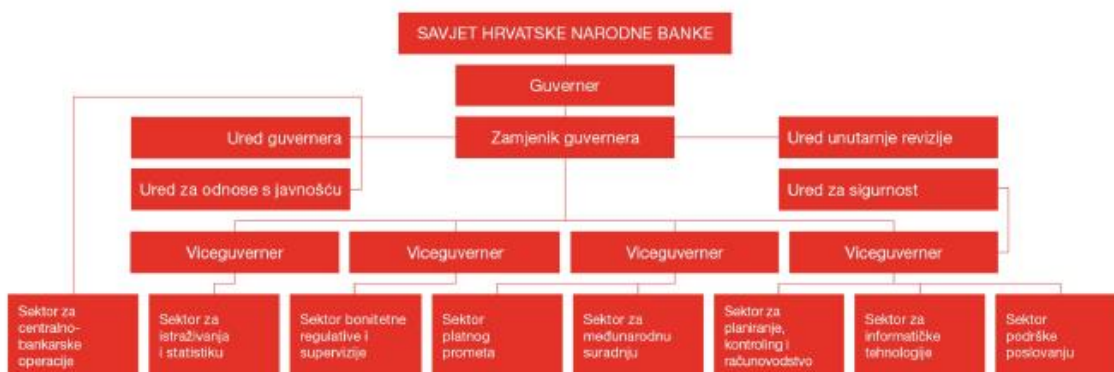
Slika 1. Struktura HNB-a

Struktura HNB-a prikazana je na slici 1. Kao što je vidljivo uprava se sastoji od Savjeta Hrvatske narodne banke, a Savjet čine guverner, zamjenik guvernera i šest viceguvernera. Savjet ima ulogu očuvanja i ostvarenja primarnog cilja, ali također i odlučuje o politici HNB-a. Osim ovih već nabrojanih zadataka i ciljeva, savjet je dužan brinuti i o funkcioniranju HNB-a čija si zadaci nabrojani u daljnjem tekstu.