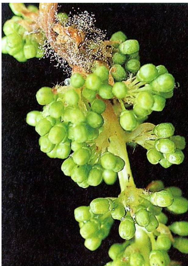
Slika 5. Siva plijesan na peteljki

U uputama međimurske Prognozne službe za zaštitu bilja više se ne preporučuju usmjereno suzbijati prezimljujuću ili prvu generaciju groždanih moljaca, što je bila redovna mjera krajem 1990-ih godina. Sredinom 1990-ih godina groždani moljci bili su proglašeni gotovo “međimurskim neprijateljem broj 1” u vinogradima, a čak se zbog njihove prekomjerne pojave uoči berbe 1996. tražilo i proglašenje elementarne nepogode radi naknadnog razvoja truleži ili sive plijesni grožđa. Tijekom zadnjih 15-ak godina broj primjene insekticida smanjili smo sa 6 do 7 tijekom sezone na samo dvije aplikacije, a pritom smo značajno popravili zdravstvenu ispravnost grožđa, ekološki manje onečistili okoliš, “vratili” ponovno pčele u vinograde i smanjili ekonomske troškove proizvodnje grožđa. U Međimurskim županijskim novinama 2010. godine je objavljen članak autora mr. Milorada Šubića u kojem navodi kako su groždani moljci najvažniji tehnološki štetnici vinove loze u našoj zemlji, koji izazivaju velike izravne i neizravne štete zbog naknadnog razvoja gljivičnih bolesti (siva plijesan, kisela trulež grožđa)