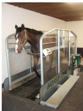
Slika 7. Traka za trening

Trake za trening konja koriste se za ponovno postizanje forme konja nakon ozljede, pripreme za natjecanje te sam trening konja. Može biti korištena u profesionalnim trening štalama od strane ambicioznih jahača i u školi jahanja te osim stručnih osoba mogu ih koristiti i sami uzgajivači s mladim konjima. Testiranjem ove metode treninga se došlo do zaključka da je traka za trening konja idealno rješenje za izgradnju zaokretanja leđa konja, njegovu nosivost te samu ravnotežu leđa. Prilikom jahanja konja sa sedlom gubi se 75 % mogućnosti zaokretanja leđa konja. Mjerenja su pokazala da se nakon tri tjedna treniranja u odnosu na stanku od nekoliko mjeseci, konji vrata u formu. Traka za trening vrlo je otporna na kišu, snijeg te loše vrijeme. Jednostavne su za održavanje ( www.horse-trainerproducts.com ).