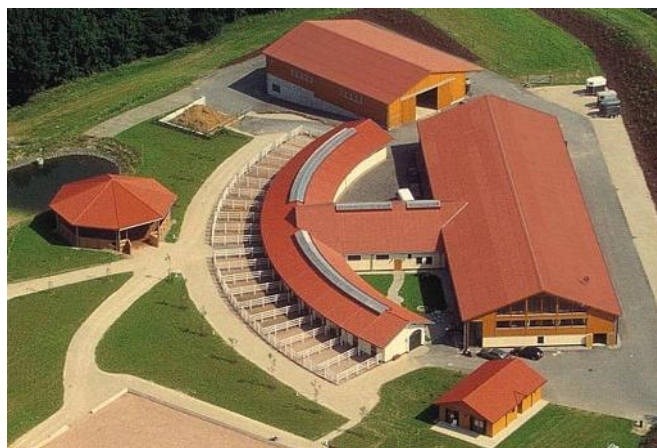
Slika 1. Suvremene staje

osigurati taj prostor za ispust, tada bi morali omogućiti mali ispust uz boksove kako bi konji mogli biti na svježem zraku. Moderne trening štale pored ispusta opremljene su i automatskim šetalicama za konje ili trakama za hodanje, kako bi grla u treningu mogla više puta dnevno šetati i razgibavati se (Đoković i sur., 2012.). Sedlarnica s opremom, kupaona te solarij nalaze se u štali, dakle solarij i kupatilo se nalaze u istom bloku sa sedlarnicom. Prilikom gradnje staje moramo voditi računa o mikroklimatskim uvjetima, temperaturi i vlažnosti, izolaciji itd. Za podove i stropne površine vrlo dobar materijal je drvo. Na podovima je poželjan asfalt jer je ugodan hodu konja te nije klizav što hodnici i podovi ne smiju biti. Zidovi moraju biti glatki, bez izbočina koje mogu biti oštre kao i čavli koji mogu ozlijediti konja. Gumene obloge koje umanjuju klizanje možemo koristiti kao pod u hodnicima. Boksovi moraju biti čisti a to postizemo redovnim dezinficiranjem i čišćenjem. U boksovima se koristi prostirka koja služi za prekrivanje poda. Kao prostirka se može koristiti slama, piljevina te gumene obloge. Slama od ječma bocka i može iritirati kožu ali je i oštra. Što je prostirka deblja bolje upija vlagu te su manje mogućnosti da će se konj ozlijediti prilikom lijeganja i dizanja. Piljevina je vrlo jeftina i udobna. U modernijim stajama se koriste gumene obloge. Treba voditi računa o higijeni pojilica i hranilica (Trailović i sur., 2012.).