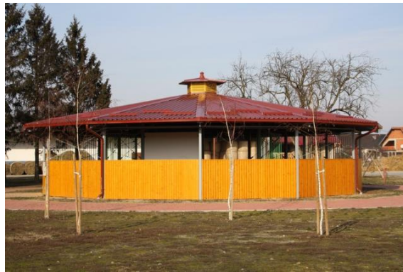
Slika 5. Šetalica