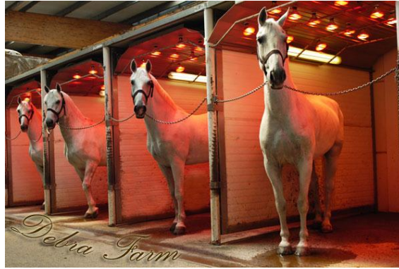
Slika 4. Solarij