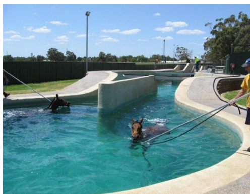
Slika 6. Bazen