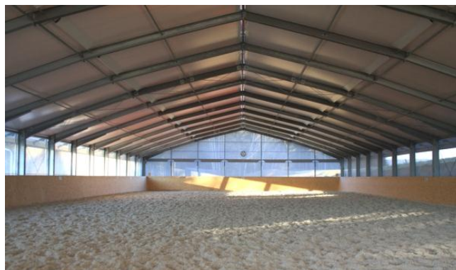
Slika 3. Jahaonica

Pastuharna Đakovo sadrži dvoranu za konjičke sportove te jahaonicu. Jahaonica je zatvorenog tipa oko 4200 četvornih metara površine. Unutar jahaonice se nalazi tribina s 800 – 1000 mjesta za gledatelje. Izgradnja jahaone jedan je od vrlo vrijednih projekata koji iznosi 20 milijuna kuna. Površina jahaonice iznosi 46,65 x 75,00 m. Jahaonica sadrži teren za jahanje, parkur, boksove za konje, ugostiteljski prostor, prostor za jahaću opremu itd. Tu se dakle mogu održavati dresure konja, škole jahanja, terapijsko jahanje, sportska natjecanja te zaprežni sport. Jedna od prednosti zatvorene jahaone ja da ona može poslužiti kao prostor za niz programa kroz cijelu godinu kao što su aukcijske prodaje konja, sajmovi te same izložbe konja ( http://www.ergela-djakovo.hr ). Još jedna od prednosti zatvorene jahaonice je što se konji mogu jahati za vrijeme lošeg vremena (Horse SA, 2011). Pri izgradnji jahaonice pažnja se mora posvetiti ventilaciji i kvaliteti podloge kada se radi zatvorena jahaonica (Pejić, 1996.).