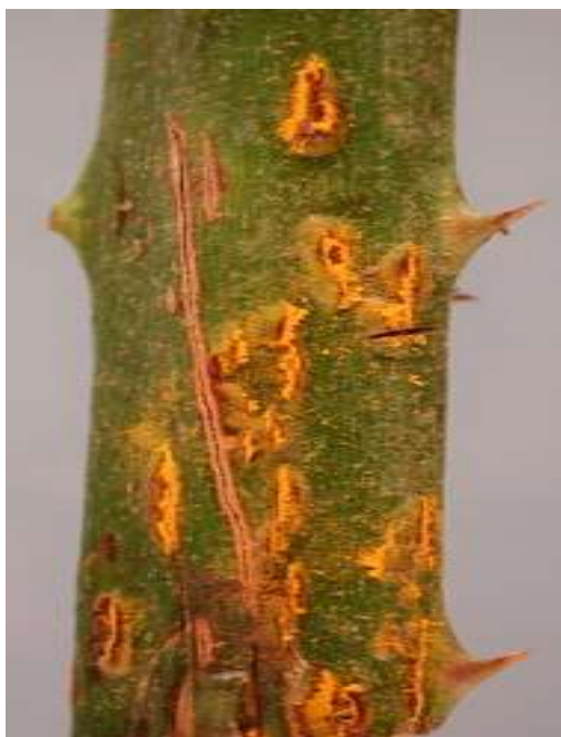
Slika br. 3 Kuehneola uredinis na izdanku kupine

ZAŠTITA: Treba izbjegavati sadnju vrlo osjetljivih sorata, npr. Thronfree , Evergreen . Važan je zahvat rezidba, spaljivanje zaraženih izboja poslije obavljanja berbe. Tom se mjerom znatno smanjuje i infektivan potencijal. Zaštitu treba započeti u proljeće čim se primijete prvi simptomi. Preventivno prskanje protiv kompleksa bolesti na kupini treba započeti prije kretanja vegetacije, a može se nastaviti do cvatnje jednim od fungicida na osnovi bakra. Specifičnu zaštitu treba započeti u proljeće čim se uoče prvi simptomi.