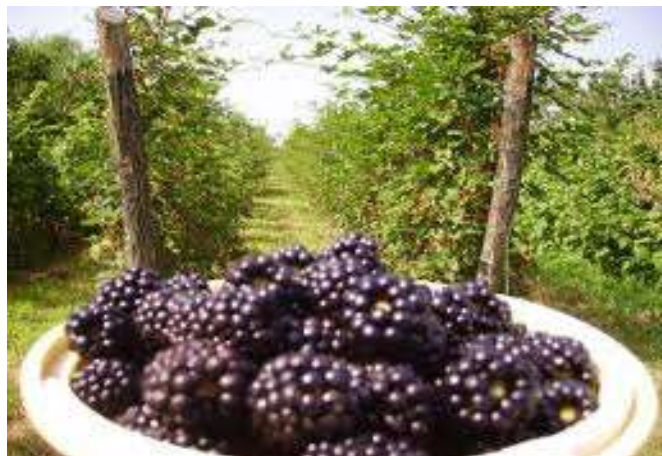
Slika br.1 Plod kupine

Thornfree je vrlo bujna sorta. Sorta ima uspravne izdanke, iz jednogodišnjih izdanaka biljka se grana i donosi obilan rod, kako bi se spriječilo rušenje biljke potreban je naslon. Cvate srednje kasno, i to krajem srpnja i početkom kolovoza. Plodovi ove sorte su izduženog oblika i dosta veliki crno-ljubičaste boje. Meso ploda je dosta aromatično, sočno i kiselo, najviše se plodovi ove sorte koriste u industrijskoj preradi, zbog slabe otpornosti sorte na transport. Prirodi 22 t/ha. ( Miljković, 1991. ). Ova sorta je pokazala osjetljivost na klorozu ako nastupi pomanjkanje željeza i mangana na karbonatnim i alkalnim tlima. Plod kupine se koristi u ishrani kao voće, služi za pravljenje sokova, džemova, pekmeza, vina i slično. Lišće kupine se koristi u raznim čajevima.