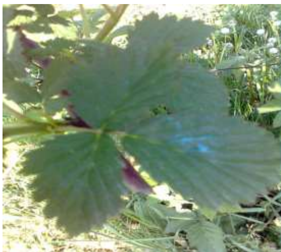
Slika 10 Tretiranje kupinjaka Bordoškom juhom

Najčešća pogreška poljoprivrednika je dodavanje vapna bez vaganja, "od oka", obično previše, čime bordoška juha gubi na fungicidnom djelovanju. Bordoška juha priprema se tako da se u drvenu ili plastičnu posudu stavi 50 l vode, odvaži 1 kg modre galice koju se stavi u platnenu ili jutenu vrećicu obično dan prije nego želimo obaviti zaštitu. Pripremu bordoške juhe treba pravovremeno planirati jer stajanjem bordoška juha gubi na kvaliteti pa se preporučuje da se napravi toliko koliko će se u istom danu potrošiti. ( internet br.2 )