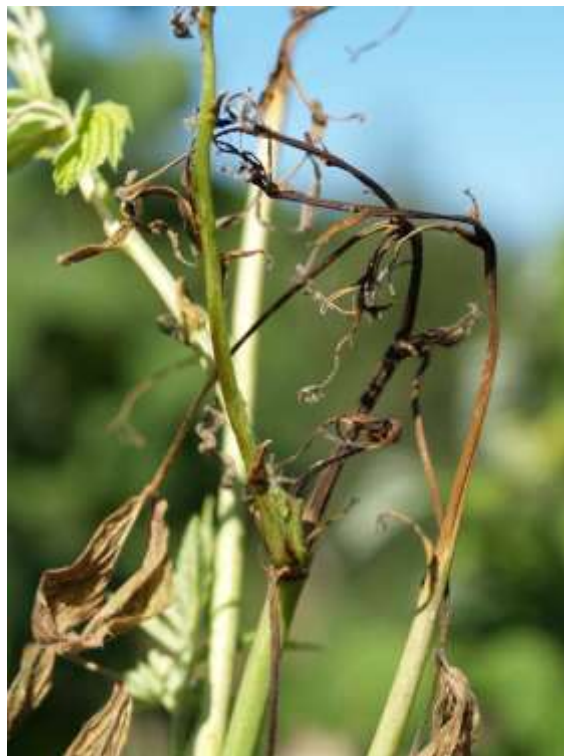
Slika br.8 Didymella applanata

http://plante-doktor.dk/hindbaerstaengelsyge.htm