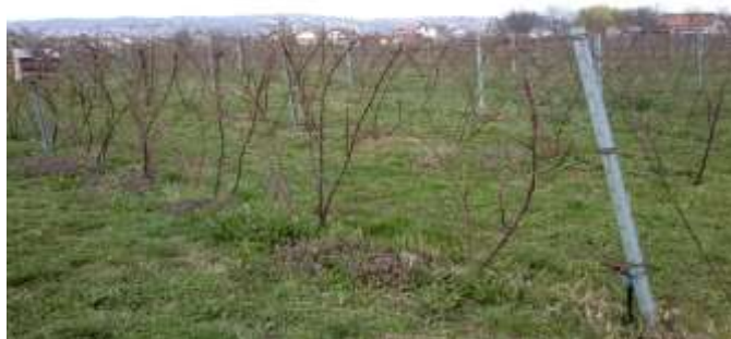
Slika 9. Kupinjak u Slavonskom Brodu

Hranjivom zastirkom nazivamo poluzreli kompost koji se na površini tla lagano raspada, te pri tome oslobađa hranjiva. Oba tipa malčiranja potpomažu stvaranje humusa i mrvičaste strukture ispod svoje površine, te sprječavaju isparavanje vlage iz tla. Na teškim tlima malčiranje je često jedini način da ovakva tla zadrže dobru strukturu i mogućnost obrade kroz duže vrijeme.