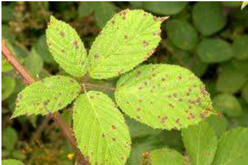
Slika br. 2 Phragmidium violaceum na listu kupine

ZAŠTITA: Treba provesti zaštitu na osjetljivim sortama nakon pojave prvih listića, a zaštitu manje osjetljivih sorata nakon pojave prvih spermagonija. Važan je zahvat rezidba, kojom smanjujemo infektivni potencijal. Zaštitu treba započeti u proljeće čim se primijete prvi simptomi. Djelotvorni su Baycor WP 25, Stoper, Chorus 75 WG, Gong EC, Tilt 250 EC, Stil. Iako oni u Hrvatskoj nemaju dozvolu za primjenu u kupini. (Cvijetković, 2010.)