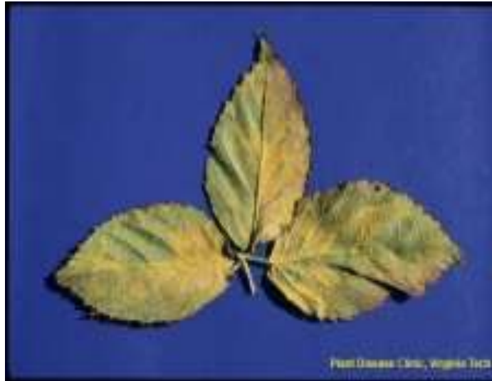
Slika br.4 Kuehneola uredinis na listu kupine