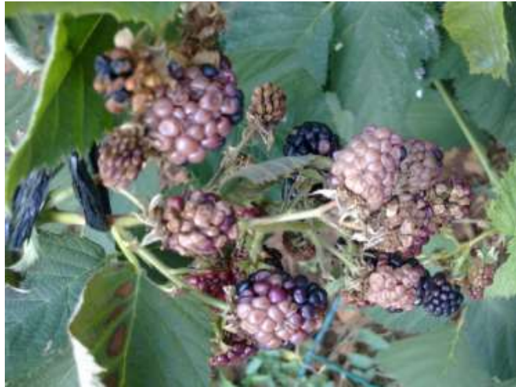
Slika br.6 Botryotinia fuckeliana na plodu kupine

http://imageshack.us/photo/my-images/706/14072011127.jpg/