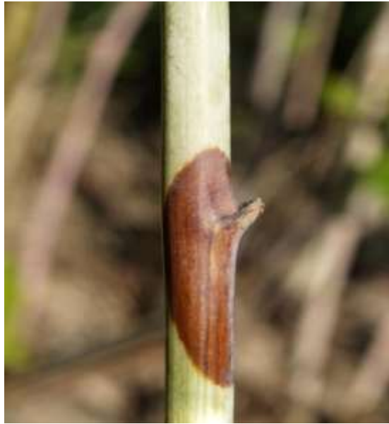
Slika br.7 Didymella applanata na izdanku kupine

http://plante-doktor.dk/hindbaerstaengelsyge.htm