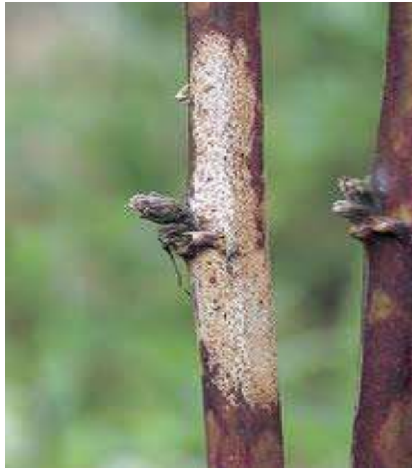
Slika br. 5 Septocytia ruborum na izdanku kupine

ZAŠTITA: Nove nasade treba podizati zdravim sadnim materijalom. Kod uočenih zaraza treba zaražene izboje odrezati i spaliti. (Cvjetković, 2010.).