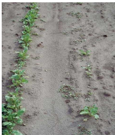
Slika 39. Propadanje biljaka uzrokovane oštećenjem gljive A. cochlioides

Na korijenu vidimo simptome u obliku pjega koje su na početku vodenaste, a kasnije postaju nekrotične. Biljka se suši kada pjege prstenasto obuhvate korijen, a posljedica toga je propadanje biljke (Slika 39.).