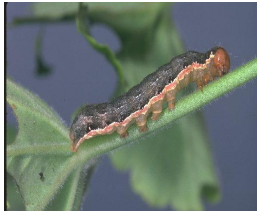
Slika 17. Gusjenica kupusne sovice