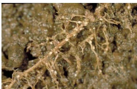
Slika 28. Ciste na korijenu od nematode Heterodera schachtii

Ličinke napadaju korijen. Ženka ostaje pričvršćena usnim ustrojem za korijen, a mužjaci ga napuštaju. Ženke odlažu 200-300 jaja unutar svojih tijela i nakon što uginu predstavljaju cistu koja štiti jaja. Ciste su vidljive na korijenu i limunastog su oblika (Maceljki, 2002.), (Slika 28.).