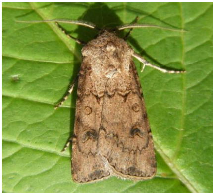
Slika 12. Imago usjevne sovice