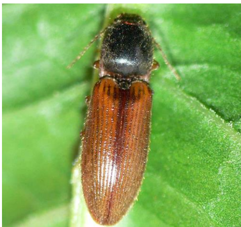
Slika 8. Imago klisnjaka vrste A.sputator Linnaeus