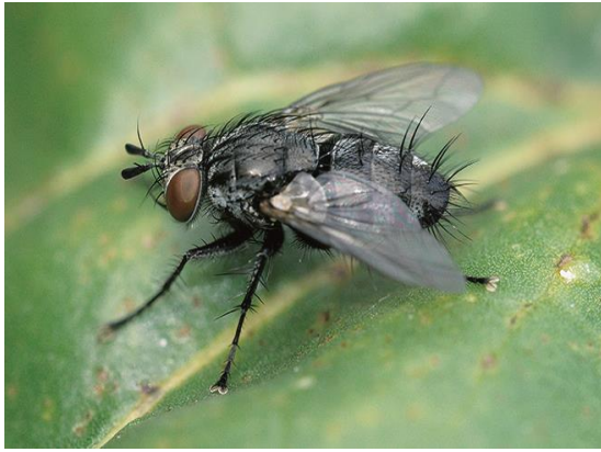
Slika 23. Imago repine muhe