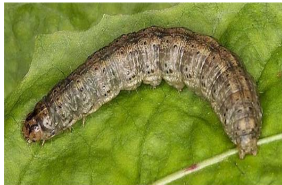
Slika 13. Gusjenica usjevne sovice