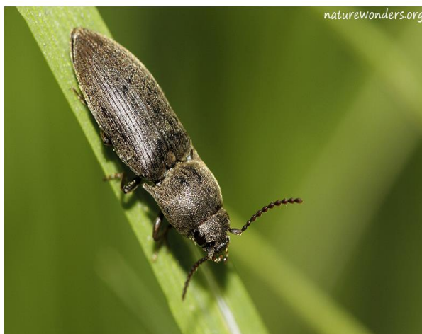
Slika 9. Imago klisnjaka vrste A.obscurus Linnaeus