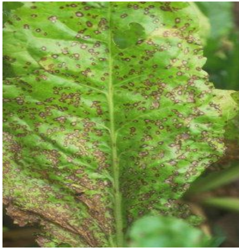
Slika 31. Simptomi na listovima od napada Cercospora beticola