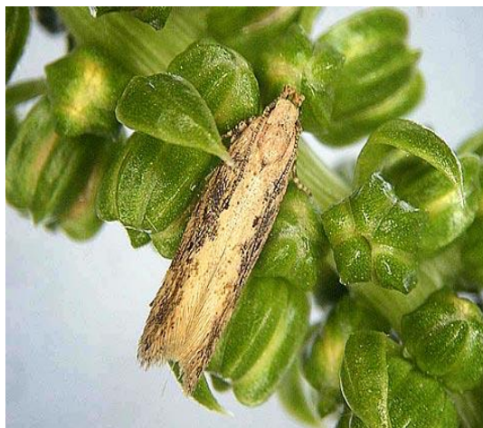
Slika 25. Leptir repinog moljca

Odrasli oblik je leptir svijetlosmeđe boje. Dugačak je 7-8 mm, a raspon krila mu je 12–15 mm (Slika 25.). Gusjenica je ružičaste boje i naraste do 12 mm. Svjetlija je s trbušne strane.