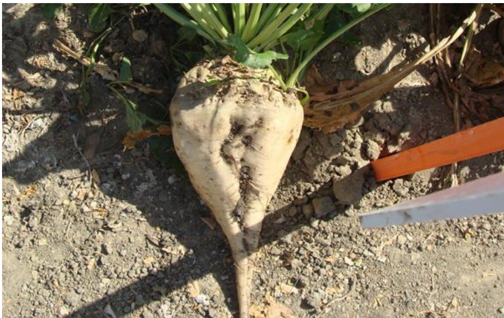
Slika 1. Korijen šećerne repe

Repa je dvogodišnja biljka. U prvoj godini stvara korijen i lišće, a u drugoj godini stabljiku, cvijet i plod. Korijen je vretenastog oblika, a gornji je dio repast ( Slika 1. ).