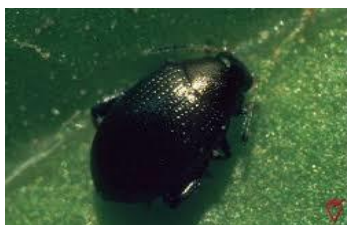
Slika 19. Imago repinog buhaća

Odrasli oblik repinog buhača ima tijelo zeleno–crne boje, metalna sjaja i dužine od 1,5–2 mm ( Maceljski, 2002. ). Osim letenjem može se kretati i skakanjem, pošto su mu bedra stražnjih nogu ojačana. ( Slika 19. ) Ličinke žive u stabljici, korijenu ili miniraju lišće različitih vrsta i to najščešće korova ( Ivezić, 2008. ).