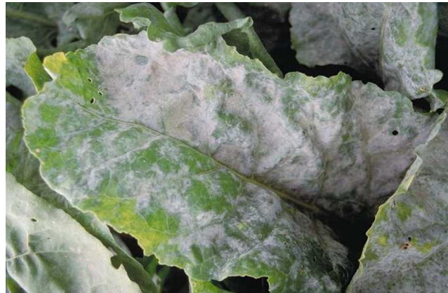
Slika 36. Prevlaka na listovima od napada pepelnice

Napada sve nadzemne dijelove biljke. Najčešće simptome vidimo na listovima. Prvo se primjeti sivi micelij gljive. Listovi su prekriveni sivobijelim ili bijelim baršunastim slojem konidiofora i konidija. Prevlaku vidimo pretežito na gornjoj strani lista (Slika 36.).