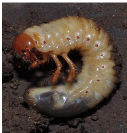
Slika 11. Ličinka običnog hrušta