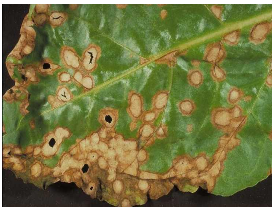
Slika 34. Simptomi Ramularia beticola na listovima

Uzročnik se javlja u svim uzgojnim područjima šećerne repe. Javlja se u slabijem intenzitetu od Cercospora beticola . Najviše se javlja na početku ili na kraju sezone u vlažnim i hladnijim područjima ( http://www.sesvanderhave.com ). Simptome vidimo na listovima u obliku pjega koje su sivosmeđe do sivobijele boje. Pjege su veće, neravnomjerno okrugle, a ponekad mogu biti i pravokutne lisne mrlje. Promjera su od 4–10 mm. Svjetlije su i nepravilnog ruba, nego kod Cercospora beticola . U kasnijoj fazi pjege se spajaju. Tkivo u unutrašnjosti pjege se sasuši, a katkada i ispadne (Kišpatić, 1988.), (Slika 34.).