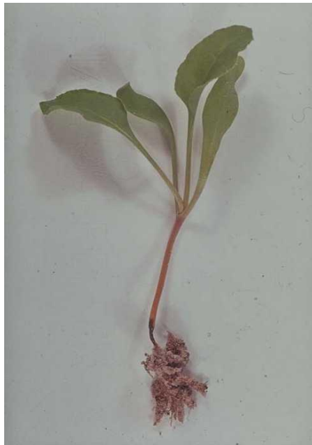
Slika 37. Štete na korijenu uzrokovane djelovanjem gljive Aphanomyces cochlioides

Simptomi su slični za sve uzročnike. Sjeme koje je zaraženo ne klija i često istrune. Biljke propadaju nakon nicanja zbog zaraze korijena, stabljike u tlu ili hipokotila, a bolest se širi od kotiledona do pravih listova (Slika 37.), (Slika 38.).