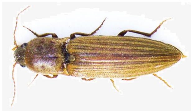
Slika 6. Imago klisnjaka vrste A. lineatus Linnaeus