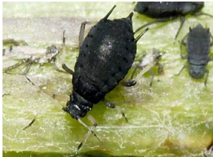
SLIKA 22. Imago crne repine uši

Odrasli oblik crne repine uši je ovalnog oblika i mutnocrne je boje. Ticala su im dulja od polovice tijela s kratkim crnim sifonima. Na zatku imaju veći broj crnih pruga ( Slika 22. ).