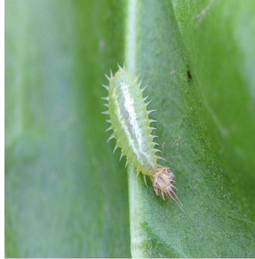
Slika 21. Ličinka repinog štitastog kornjaša