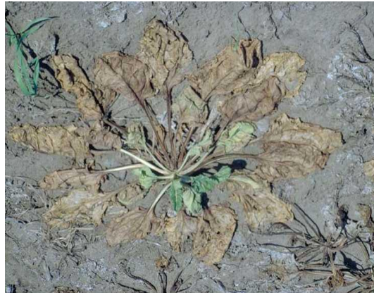
SLIKA 42. Simptomi na listovima od napada Rhizoctonia solani

Kod uznapredovale truleži listovi leže na tlu oko repe u obliku zvijezde ( http://www.Kws.Hr ), (Slika 42.).