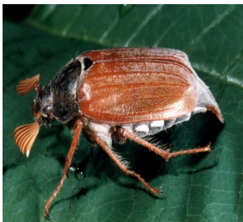
Slika 10. Imago običnog hrušta

Odrasli oblici običnog hrušta dugi su od 20-28 mm i širine oko 10 mm. Glava i nadvratni štit su crne boje, a pokrilje je smeđe. Ticala i noge su smeđe boje. Pronotum je sjajno crne boje i ima bjeličaste dlačice (Slika 10.). Ticala se sastoje od 10 članaka. Broj lepeza na zastavici ticala kod mužjaka iznosi sedam dužih, a kod ženki je 6 kraćih. Trbušni članak se postupno sužava. Ličinka se zove grčica i mliječno bijele je boje. Tijelo joj je savijeno u obliku slova C. Ima veliku glavu i snažan usni ustroj za grizenje. Može narasti do 65 mm i na prsima ima tri para dugih žućkastih nogu (Ivezić, 2008), (Slika 11.).