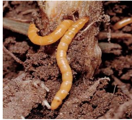
Slika 5. Ličinka-žičnjak