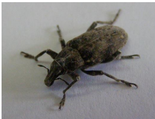
SLIKA 18. Imago repine pipe