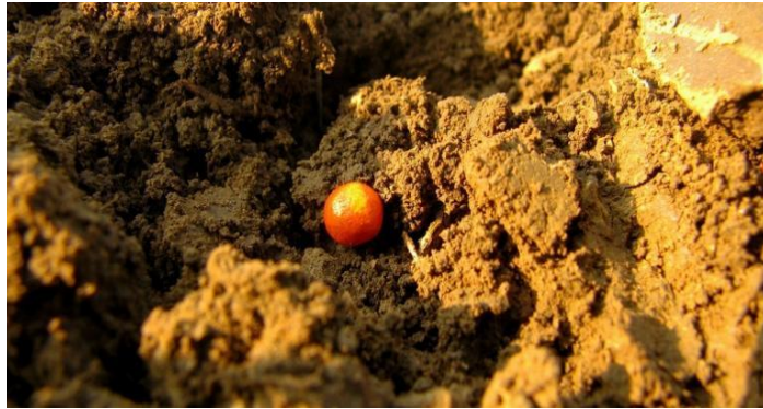
Slika 2. Sjeme šećerne repe