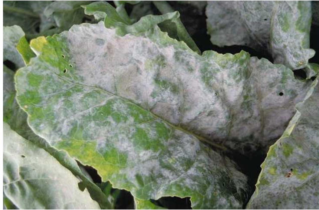
Slika 36. Prevlaka na listovima od napada pepelnice

Napada sve nadzemne dijelove biljke. Najčešće simptome vidimo na listovima. Prvo se primjeti sivi micelij gljive. Listovi su prekriveni sivobijelim ili bijelim baršunastim slojem konidiofora i konidija. Prevlaku vidimo pretežito na gornjoj strani lista (Slika 36.).