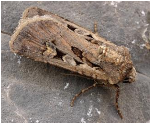
Slika 14. Leptir proljetne sovice