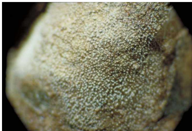
Slika 35. Konidiospore s konidija Ramularia beticola