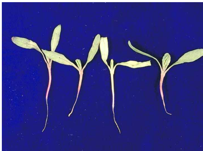
SLIKA 38. Štete na hipokotilu uzrokovane djelovanjem gljive Phoma betae