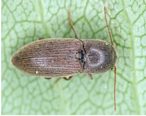
Slika 4. Imago klisnjaka