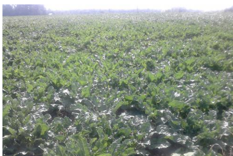
Slika 3. Površina pod šećernom repom na OPG Kesegić