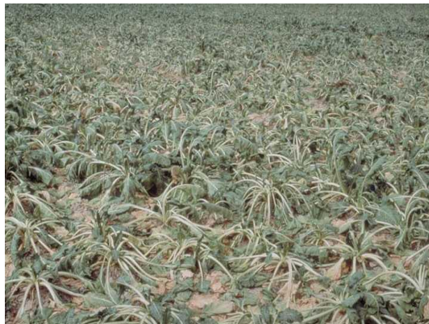
Slika 29. Simptomi na lišću od napada repine nematode

Kutikula ciste štiti jaja od isušivanja i oscilacije temperature. U proljeće ličinke izlaze iz ciste, najčešće pod utjecajem korjenovih izlučevina. Na temperaturi oko 6°C počinje kretanje ličinki, a iz ciste izlaze kada temperatura tla dostigne 10°C. Ličinke mogu migrirati 30-40 cm od biljke i izlaze uslijed vlagom omekšane ciste i ubušuju se u sitne korjenčiće. Presvlače se u ličinke drugog uzrasta. Nakon 10 dana ponovno se presvlače i prelaze u treći stadij. Tijekom porasta tijela ženke dolazi do pucanja korjenčića. Optimalna temperatura za razvoj repine nematode je 18-20°C (Ivezić, 2008.). Ženke mogu održati vitalnost i do 9 godina. Ima 2-3 generacije godišnje. Nematoda prezimi u tlu u obliku ciste (Maceljki, 2002.). Nematoda oštećuje biljke sisanjem korijenovih sokova. Napadnute biljke pri niskoj vlažnosti zaostaju u rastu. U početku napada nematode dolazi do polaganog venuća biljke, a vanjsko lišće vene i poliježe po tlu. Lišće prijevremeno žuti i postupno se suši (Slika 29.).