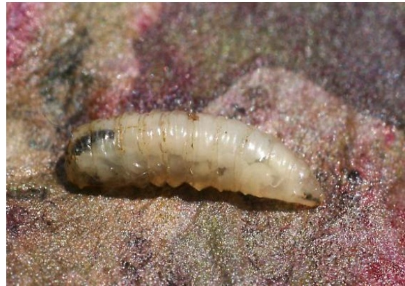
Slika 24. Ličinka repine muhe