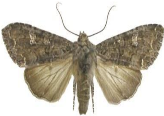
Slika 16. Leptir kupusne sovice