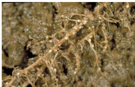
Slika 28. Ciste na korijenu od nematode Heterodera schachtii

Ličinke napadaju korijen. Ženka ostaje pričvršćena usnim ustrojem za korijen, a mužjaci ga napuštaju. Ženke odlažu 200-300 jaja unutar svojih tijela i nakon što uginu predstavljaju cistu koja štiti jaja. Ciste su vidljive na korijenu i limunastog su oblika (Maceljki, 2002.), (Slika 28.).