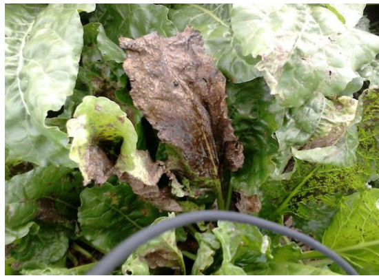
Slika 32. Sušenje lista od napada Cercospora beticola