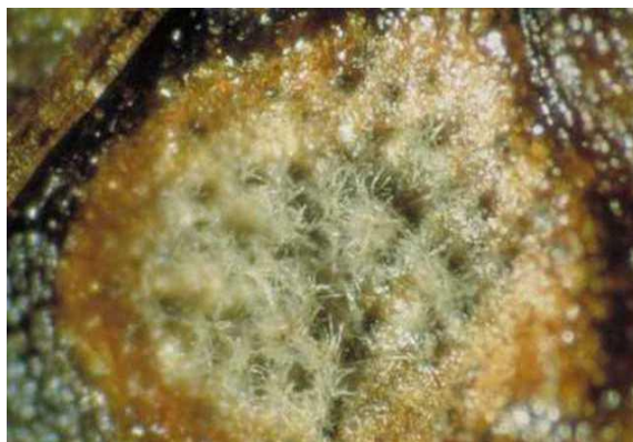
Slika 33. Konidiospore s konidijama na listovima