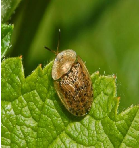
Slika 20. Imago repinog štitastog kornjaša

oblika i ima razgranate čekinje uokrug tijela. Spljoštenog je tijela i naraste do 7 mm (Slika 21.).