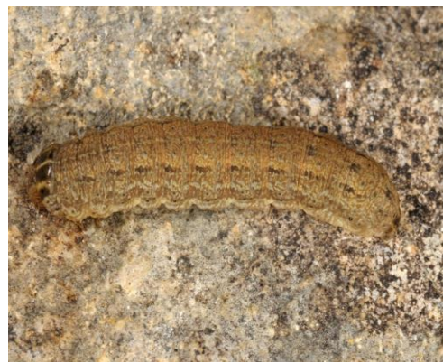
Slika 15. Gusjenica proljetne sovice