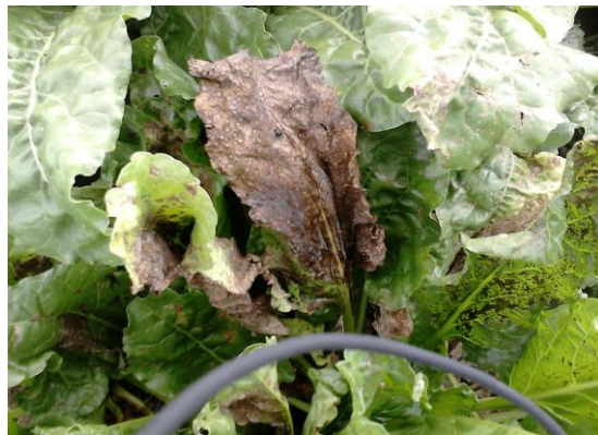
Slika 32. Sušenje lista od napada Cercospora beticola