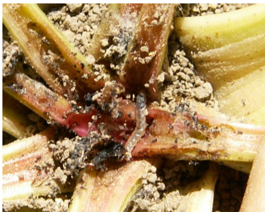
Slika 26. Gusjenica i štete od repinog moljca