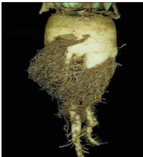
Slika 30. Oštećenje korijena od napada repine nematode