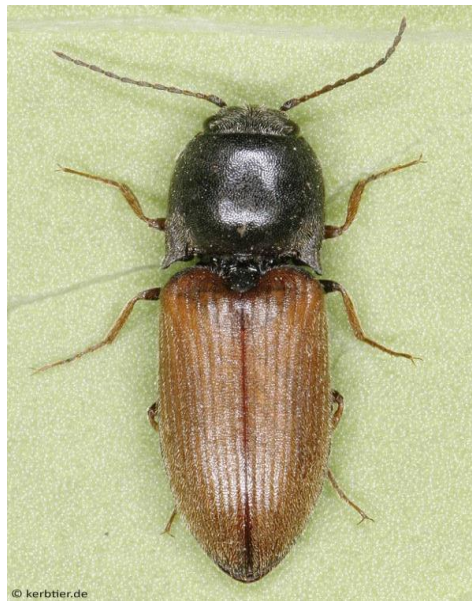
Slika 7. Imago klisnjaka vrste A.ustulatus Schaller