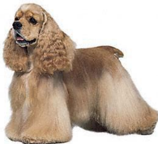
Slika 8. Američki koker španijel

Postoji još pasmina španijela: cocker, engleski springer španijel, velški springer španijel, irski vodni španijel, klamber španijel, sasikski španijel i poljski (field) španijel.