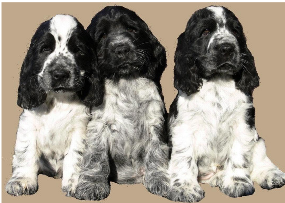
Slika 5. Štene engleskog koker španijela (crno-bijela boja)