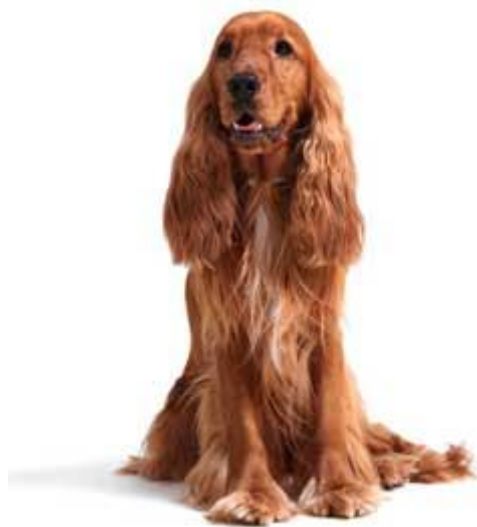
Slika 2. Engleski koker španijel (crvena boja)