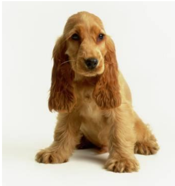
Slika 4. Štene engleskog koker španijela (crvena boja)