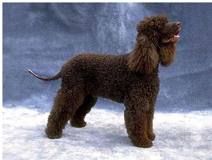
Slika 11. Irski vodni španijel