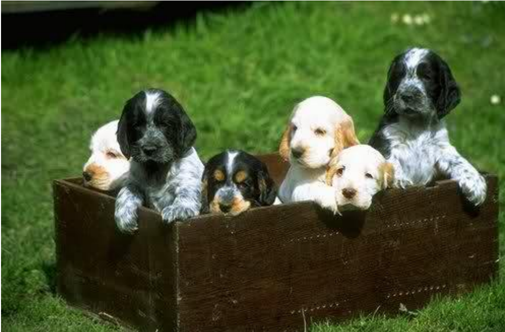
Slika 1. Štenad engleskog koker španijela

Na izložbama se psi svrstavaju u dvije kategorije: 1. bijelo-narančasti psi i 2. psi ostalih boja.