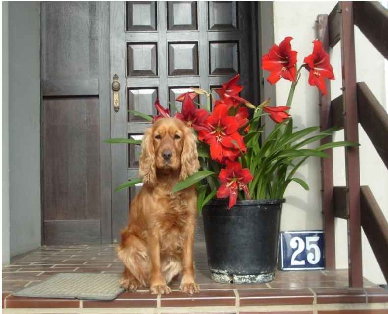
Slika 3. Engleski koker španijel (crvena boja)