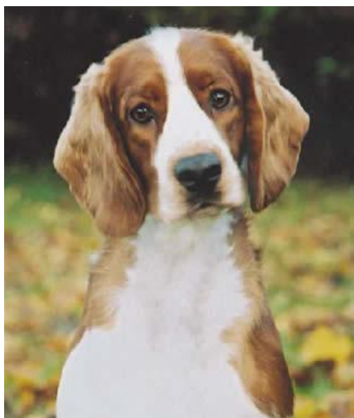
Slika 10. Velški špringer španijel