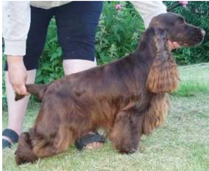
Slika 7. Engleski koker španijel (smeđa boja)