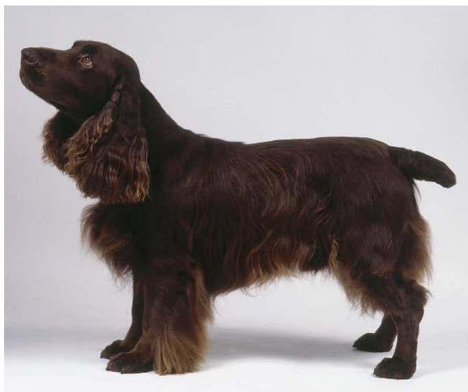
Slika 14. Poljski (field) španijel