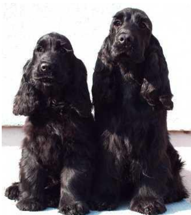
Slika 6. Engleski koker španijel (crna boja)