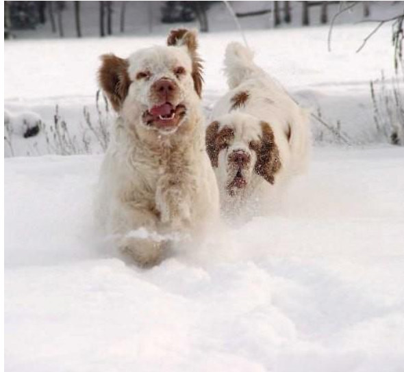
Slika 12. Klember španijel