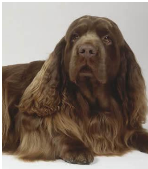
Slika 13. Sasex španijel