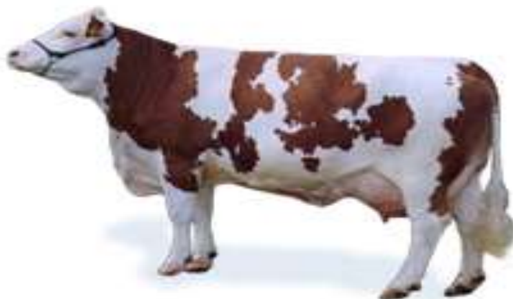
Slika 1. Krava simentalске pasmine http://interboves.com/tr/fleckvieh.html

brežuljkastim krajevima Hrvatske. Ta je pasmina po zastupljenosti dominantna u Hrvatskoj (oko 70%).