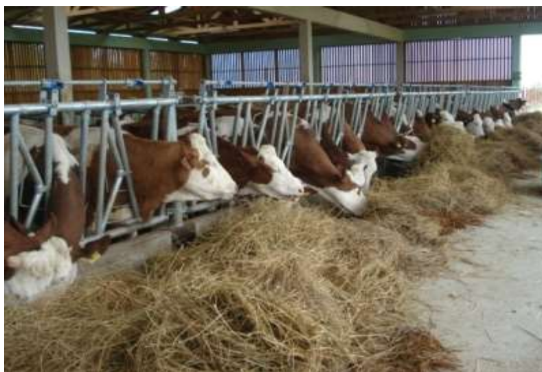
Slika 3. Hranidba krava

Važan čimbenik u hranidbi mliječnih krava te proizvodnji mlijeka je kvantitativno i kvalitativno dostatna hranidba krmivima besprijekorne higijenske čistoće. Pravilnim izborom krmiva, i njihovim međusobnim odnosom u obroku, značajno se utječe na proizvedenu količinu, a potom i na sastav, odnosno na kvalitetu mlijeka kao finalnoga proizvoda. Kvalitetna hrana i pravilna tehnologija hranidbe preduvjet je izbjegavanja mnogih zdravstvenih poremećaja, koji se u praksi često javljaju, a označavaju se kao alimentarne ili „bolesti hrane“.