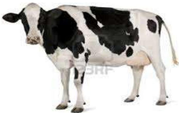
Slika 2. Krava holstein pasmine

Prema količini apsolutne proizvodnje mlijeka, holštajn pasmina je najmliječnija pasmina goveda. Podrijetlo te pasmine je SAD. Većina zemalja Europe za proizvodnju mlijeka preferira holštajn pasminu. Svojom je vanjštinom vrlo prepoznatljiva.