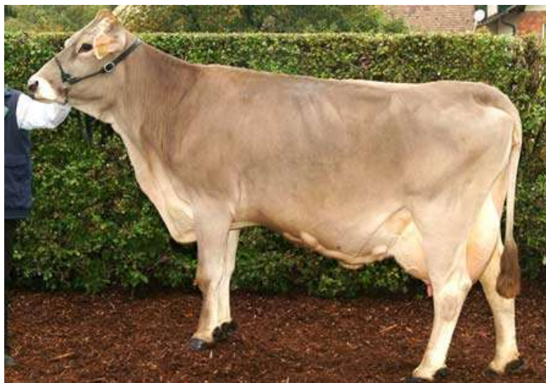
Slika 3. Krava smeđe pasmine

Smeđa goveda obuhvaćaju nekoliko pasmina: smeđa švicarska, smeđa njemačka, smeđa austrijska te američka mliječna smeđa pasmina. Podrijetlo te pasmine je Švicarska i Austrija. Europske pasmine smeđega goveda kombiniranoga su tipa, dok je američka smeđa pasmina selekcijski usmjerena na visoku proizvodnju mlijeka. Iako se ta pasmina u Hrvatskoj najviše drži u Gorskom kotaru, Dalmaciji, Lici i Istri, također se nekoliko desetaka krava nalazi i kod proizvođača u Osječko-baranjskoj županiji.