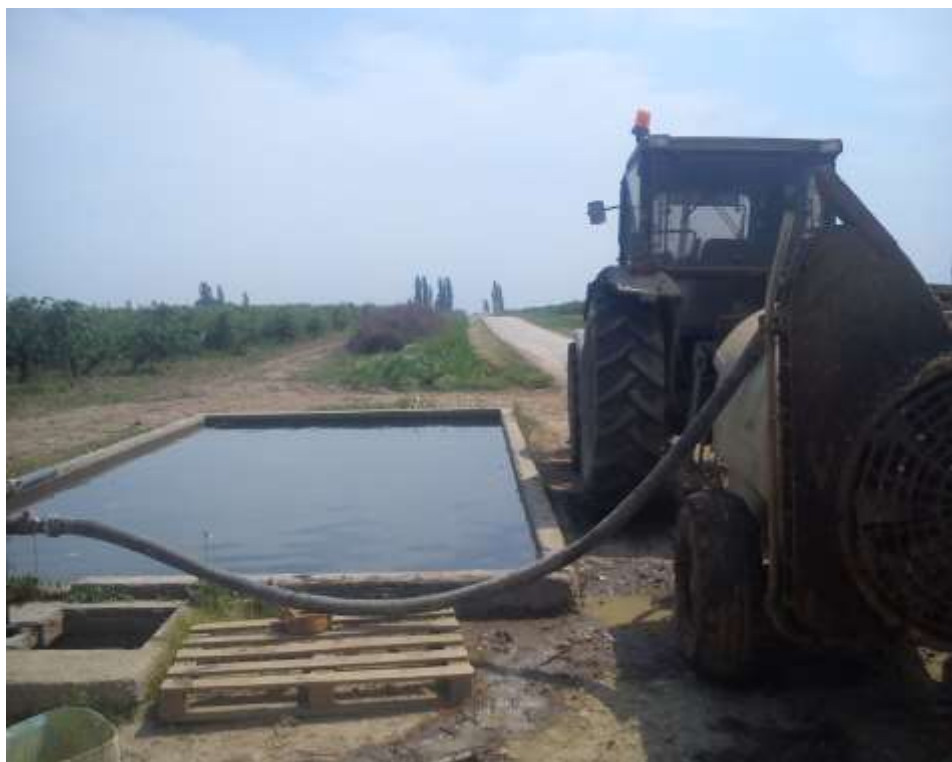
Slika 4. Punjenje atomizera iz bazena