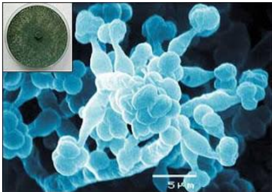
Slika 8. Trichoderma harzianum

Hrvatskoj je registriran za suzbijanje gljive Botrytis cinerea na vinovoj lozi i jagodama (Macelj, 2005; Lučić, 2009) .