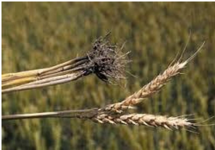
Slika 3. Uzročnik patološkog polijeganja žitarica ( Gaeumannomyces graminis tritici )

Kompeticija podrazumijeva da se korijen biljke domaćina (rizosfera) mora naseliti organizmom koji se primjenjuje za biološko suzbijanje uzročnika bolesti prije nego što dođe do infekcije patogenom (Grahovac i sur., 2009.).