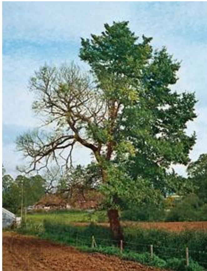
Slika 2. Drvo zaraženo sa Dutch elm disease (uzročnik paleži hrasta i kestena) www.britannica.com/EBchecked/media/5307/English-elm-afflicted-with-Dutch-elm-disease

Primjer inducirane otpornosti je hipovirulentni izolat Endothia parasitica (uzročnik paleži hrasta i kestena- Dutch elm disease ). Navedeni izolat je potpuno eliminirao bolest u Europi i istoku SAD-a (Scibilia i Shain,1989.) (Slika 2.).