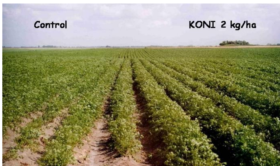
Slika 6. Utjecaj biofungicida na suncokret u odnosu na kontrolu http://bioved.eu/konislid/Dia13.JPG