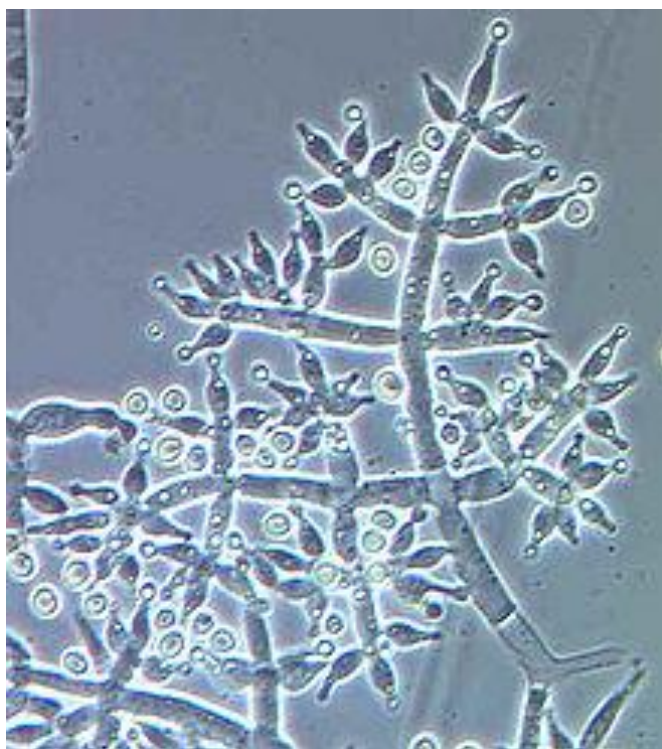
Slika 7. Trichoderma harzianum

Phytophthora spp. , Rhizoctonia solani , Chondrostereum purpureum , Sclerotium rolsfii i Heterobasidium annosum (Cook i Baker, 1983.) .