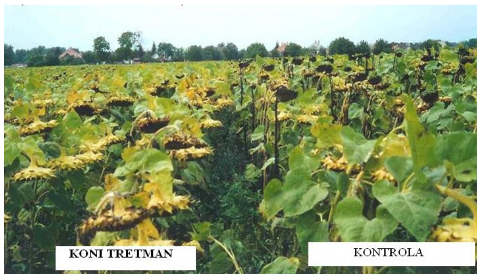
Slika 5. Utjecaj biofungicida na suncokret u odnosu na kontrolu

S. sclerotiorum i S. minor . On značajno povećava brojnost gljive C. minitans koja je prirodno prisutna u tlu te uništava sklerocije gljive Sclerotinia sp. (Ocsko i sur., 2008.) (Slika 5. i 6.).