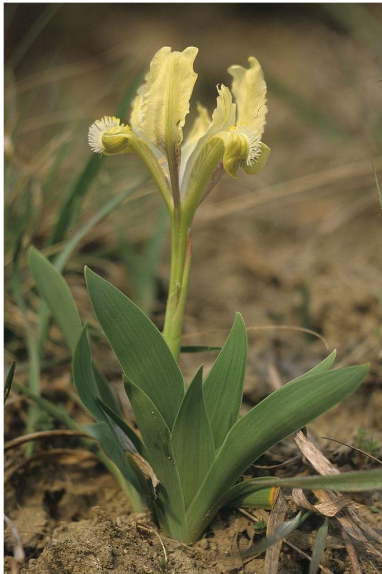
Slika 5. Iris pumila L. (panonska perunika)

Panonska je perunika sličnog izgleda kao i prethodna vrsta, iako ipak nešto većih dimenzija, što je i za očekivati, budući da je ova vrsta tetraploid tj. broj kromosoma joj je 32. Također cvjeta u ožujku i travnju. Dugo se mislilo da ova vrsta, inače široko rasprostranjena na suhim i pješčanim staništima u Panonskoj nizini (Mađarska, Srbija, Austrija) i nije prisutna u flori Hrvatske, ali je nedavno zabilježena na jednom lokalitetu u Baranju (Mitić i Cigić, 2009.).