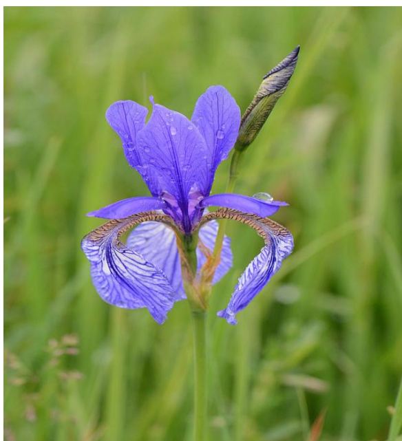
Slika 12. Iris sibirica L. subsp. sibirica (tipična sibirska perunika)

Sibirska perunika raste na nizinskim vlažnim i močvarnim livadama. Rasprostranjena je na području srednje i istočne Europe, Balkanskog poluotoka, Kavkaza, Male Azije, te zapadne i srednje Azije. Na području Hrvatske dolazi većinom na vlažnim i močvarnim livadama u njezinom kontinentalnom dijelu, ali se njena staništa sve više prorjeđuju i smanjuju. Nalazi se u kategoriji VU (osjetljive biljke) (Zaštita prirode,2001.).