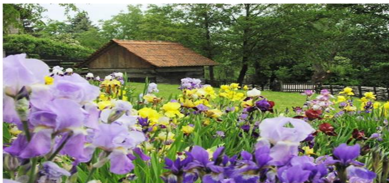
Slika 15. Hrvatski vrt perunika u Donjoj Stubici