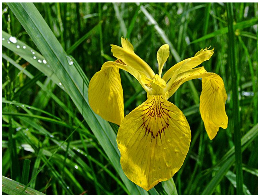
Slika 9. Iris pseudoacorus (močvarna žuta perunika)

Ovo je inače široko rasprostranjena vrsta na vlažnim i močvarnim staništima, nalazimo je u Europi, na Kavkazu, Maloj Aziji, u zapadnom Sibiru i sjevernoj Africi. U Hrvatskoj je prisutna na gotovo svim vlažnim i močvarnim staništima: od sjevera (Hrvatsko zagorje), istoka (Slavonija, Baranja) i središnjeg dijela (okolica Zagreba) do juga (Dalmacija, Velebit) (Mitić i Cigić, 2009.).