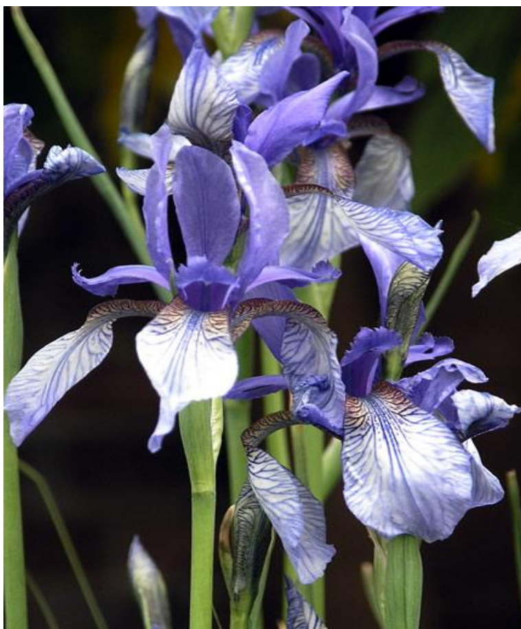
Slika 13. Iris sibirica L. subsp. errirhiza (kojnička perunika)

Kojnička perunika opisana je prema prvom primjerku sabranom na planini Kojnik u Sloveniji Pospichal (1897.), Wraber (1999.,2001.), a zabilježena je na svega nekoliko izoliranih planinskih lokaliteta Hrvatske, Slovenije i Bosne i Hercegovine. Tu raste na sušim krškim, karbonatnim staništima (travnjacima) u montanom pojasu (Wraber 1999.,2001.; Šilić 2002.).