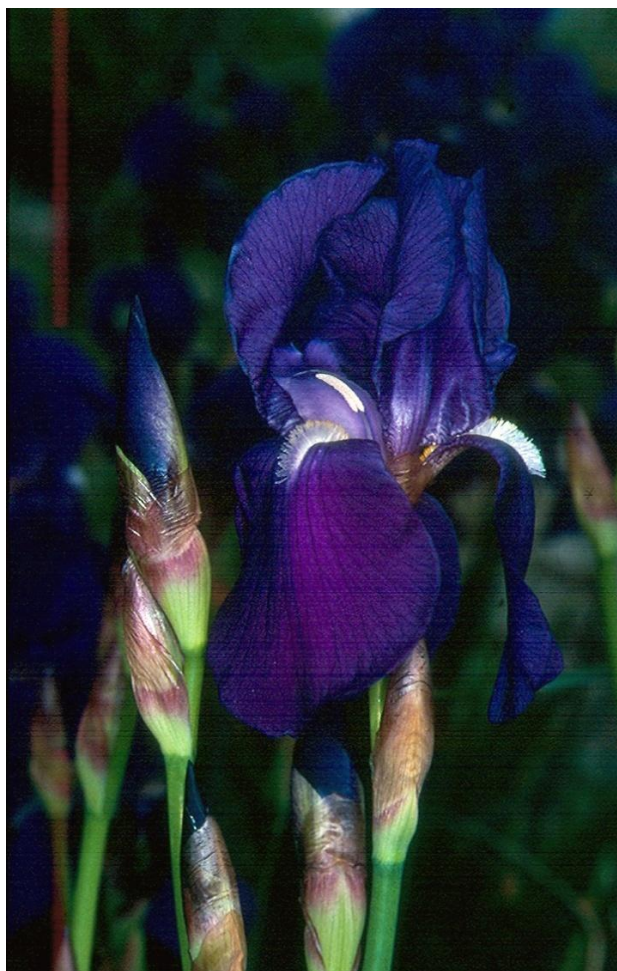
Slika 8. Iris illyrica (ilirska perunika)

Srodstveno ova vrsta pripada seriji Pallidae, čija su osnovna karakteristika suhokožičaste spate. Ova endemična kvarnersko-liburnijska perunika rasprostranjena je duž sjevernog Jadranskog primorja, uz talijansku i slovensku obalu, te u Hrvatskoj na sjevernom dijelu Jadrana (Tommasini, 1875.). Smatramo je subendemom.