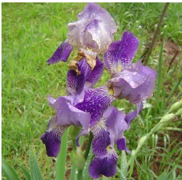
Slika 3. Patuljasta perunika