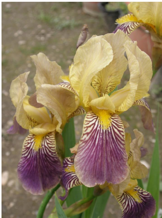
Slika 11. Iris rotschildii (Rotshildova perunika)

Rotshildova perunika je jedini prirodni samonikli križanac perunike u flori Hrvatske (Degen, 1936.). Roditeljske vrste su joj ilirska perunika ( Iris illyrica ) i šarena perunika ( Iris variegata ), što se vidi i po njenom izgledu u kojem su objedinjene značajke obaju roditelja. Ova perunika također ima podzemnu stabljiku (rizom), visinom je slična roditeljskim vrstama, uspravna stabljika visoka je do 40 cm, te nosi nekoliko šarenih cvjetova (boju su dobili od oba roditelja). Listovi su srpasto savijeni, široki 1-3 cm, nježni kao kod ilirske perunike, ali s izraženim žilama kao kod šarene perunike. Ovojni listovi (spate) su pri dnu zeleni kao kod šarene perunike, no pri vrhu suhi kao kod ilirske perunike. Vanjski listovi perigona su ljubičastožućkasti, a unutrašnji mutno žuti ili svijetlo ljubičaste boje. Čak i režnjevi tučka pokazuju značajke obaju roditelja, po sredini su žuti, a po rubovima ljubičasti. „Brada“ je uglavnom žuta. Prirodni križanac ilirske perunike ( Iris illyrica ) i šarene perunike ( Iris variegata ) raste na Srednjem Velebitu, na vrhovima iznad Karlobaga (Mitić i Cigić, 2009.).