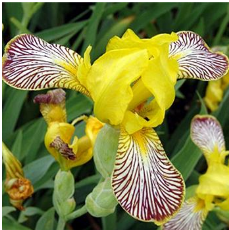
Slika 14. Iris variegata L. (šarena perunika)

Ova lijepa perunika u Hrvatskoj je zabilježena u brdskom području Gorskog Kotara i Velebita i Slavonije, a rasprostranjena je i na sličnim staništima diljem Europe (od Njemačke i Austrije do Rumunjske i Bugarske) (Mitić i Cigić, 2009.).