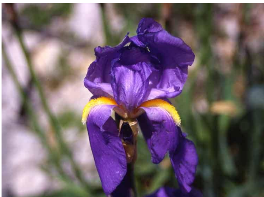
Slika 10. Iris pseudopallida („lažno“ blijeda perunika)

Biljka uspijeva na vapnenačkim kamenjarima i kamenjarskim pašnjacima priobalnog Jadranskog područja, do 600 metara nadmorske visine. Rasprostranjena je na području južne Dalmacije, Hercegovine i primorskom dijelu Crne Gore i Albanije, te je kao takva subendemična. Populacije ove perunike relativno su brojne i nisu za sada ozbiljnije ugrožene, najvjerojatnije zbog vrlo uspješnog vegetativnog razmnožavanja rizomima (Mitić i Cigić, 2009.).