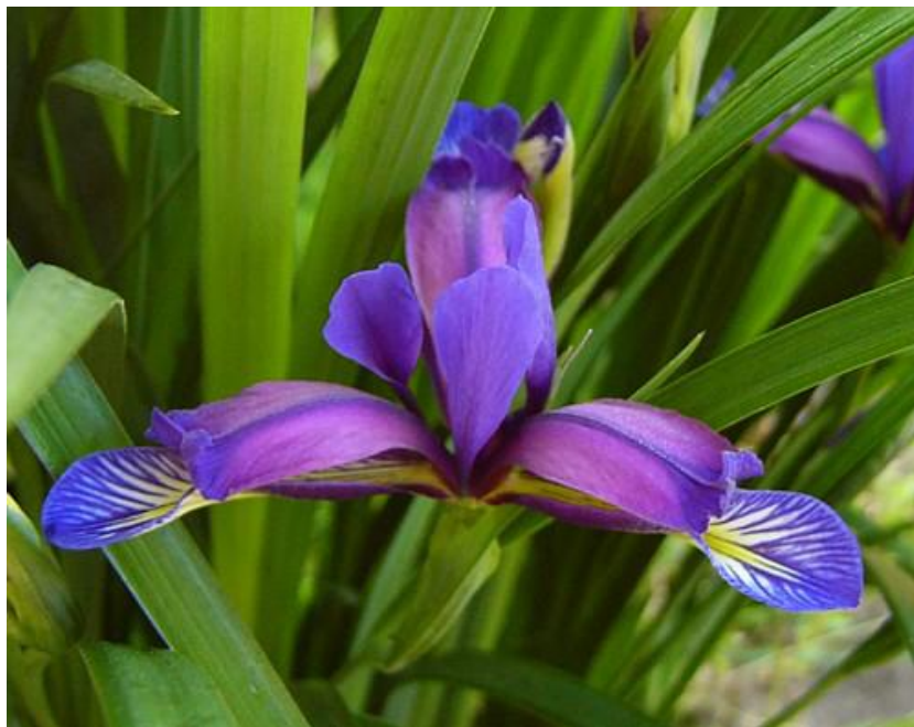
Slika 7. Iris graminea L. (uskolisna perunika)

Uskolisna je perunika široko rasprostranjena po cijeloj Europi i Sjevernoj Americi. Ovo je jedna od rijetkih šumskih perunika rasprostranjena na šumskim staništima u središnjoj Hrvatskoj, Hrvatskom primorju, Gorskom kotaru i na Velebitu.