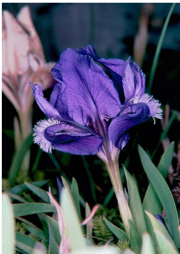
Slika 4. Iris adriatica (jadranska perunika)

Usko je endemična vrsta, rasprostranjena samo u Srednjoj Dalmaciji (u okolici gradova Zadar, Šibenik, Drniš i Unešić, te na otocima Čiovu, Braču, Viru i Kornatima). Raste na mediteranskom i submediteranskom tipu kamenjarskih pašnjaka. Njena staništa ugrožena su zbog zaraštavanja te je uvrštena u kategoriju NT (gotovo ugrožene biljke).