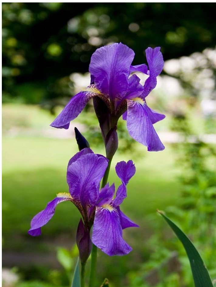
Slika 6. Iris croatica (hrvatska perunika)

Hrvatska perunika raste u zapadnom kontinentalnom području Hrvatske (Strahinščica, Cesargradska gora, Medvednica, Samoborsko gorje i Gorski Kotar), te na sličnom području Slovenije. S obzirom na rasprostranjenje u Hrvatskoj i susjednoj Sloveniji, smatramo je subendemom (Mitić i Cigić, 2009.).