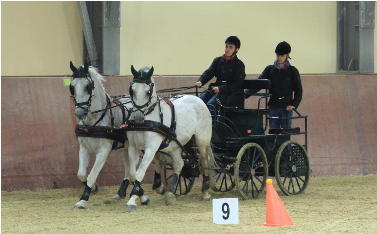
Slika 3. Pravilna hranidba je od iznimne važnosti za konje koji se koriste u trodnevnim zaprežnim natjecanjima

anaerobne glikolize je stvaranje mliječne kiseline i brzo se razvija umor kako dolazi do padanja pH vrijednosti u mišićima. Kao primjer brzina kojom se kreću konji tijekom endurance natjecanja je unutar raspona aerobne proizvodnje ATP-a. Tijekom početka utrke, kraja utrke i penjanja na uzbrdice kod konja nastupa anaerobna proizvodnja ATP-a (Duren, 1995.).