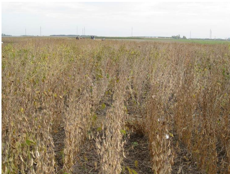
Slika 5. Izgled soje pred žetvu

t/ha). U ovoj godini apsolutno najveći urod zrna izmjeren je kod tretmana s bakterizacijom sorte Ika (4,6 t/ha), a kod sorte Tena u istoj godini izmjerena veličina uroda zrna bila je tek neznatno niža (4,5 t/ha). Sorta Ika je u obje godine istraživanja najbolje reagirala na bakterizaciju te je u 2013. godini urod zrna u odnosu na kontrolu povećan za 14,7%, a u 2014. godini za 17,9 %. Koliko uvjeti povećane vlažnosti mogu biti važni za povećanje uroda zrna navode i Candogan i sur. (2013.) za agroekološke uvjete zapadne Turske.