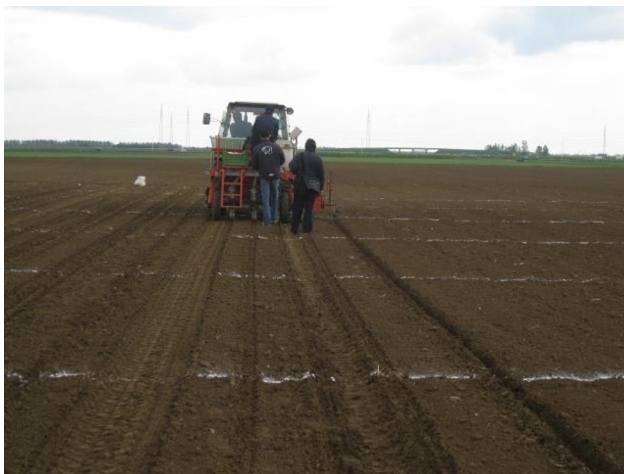
Slika 2. Sjetva soje na pokusnim površinama Poljoprivrednog instituta Osijek

Na pokusnom polju Poljoprivrednog instituta Osijek (eutrični kambisol; pH 6,5; humus 2,13%; 22,6 mg P 2 O 5 /100g tla; 30,4 mg K 2 O/100g tla) tijekom 2013. i 2014. godine postavljeni su pokusi s dvije varijante (kontrola i bakterizirano sjeme) u četiri ponavljanja. Sjetva je obavljena ručno u optimalnom roku za soju u svakoj godini ispitivanja (Slika 2.). Pokusna parcela iznosila je 12,5 m 2 (5 redova x 5m dužine x 0,5 m međuredni razmak) uz planirani broj od 650000 biljaka/ha za rane i 580000 biljaka/ha za srednje rane sorte. Prije sjetve, sjeme kod tretmana s bakterizacijom je tretirano (inokulirano) mikrobiološkim preparatom koji sadrži bakterije soja Bradyrhizobium japonicum za simbiozno vezivanje molekularnog dušika iz zraka. Pokusi su tretirani herbicidnom kombinacijom Dual Gold 960EC (alfa-metolaklor) + Sencor WP 70 (metribuzin) (11+0,5 kg) poslije sjetve, a prije nicanja. Uz dvije međuredne kultivacije, pokusi su bili bez korova tijekom vegetacije. Pokusne parcele su požete kombajnom. Urod zrna određen je vaganjem zrna sa svake pokusne parcele uz mjerenje vlage zrna. Urod zrna po parceli preračunat je na vlagu 13% i u tone po hektaru (t/ha). U žetvi je izmjerena visina i težina biljaka, te broj etaža i broj mahuna.