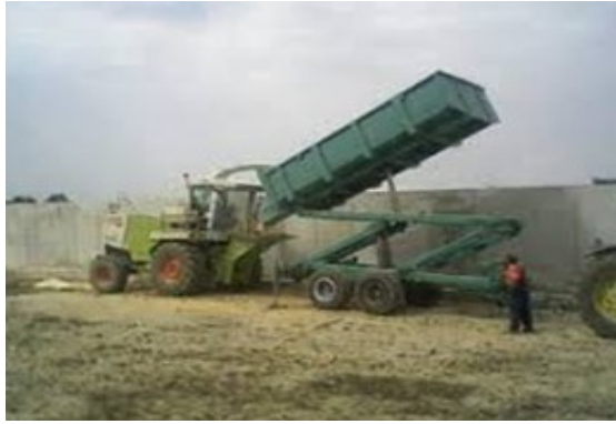
Slika 20. Usitnjavanje zrna VVK (foto: D.Banožić, 2015.)