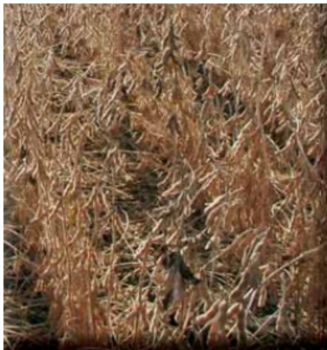
Slika 23. Sorta Podravka 95