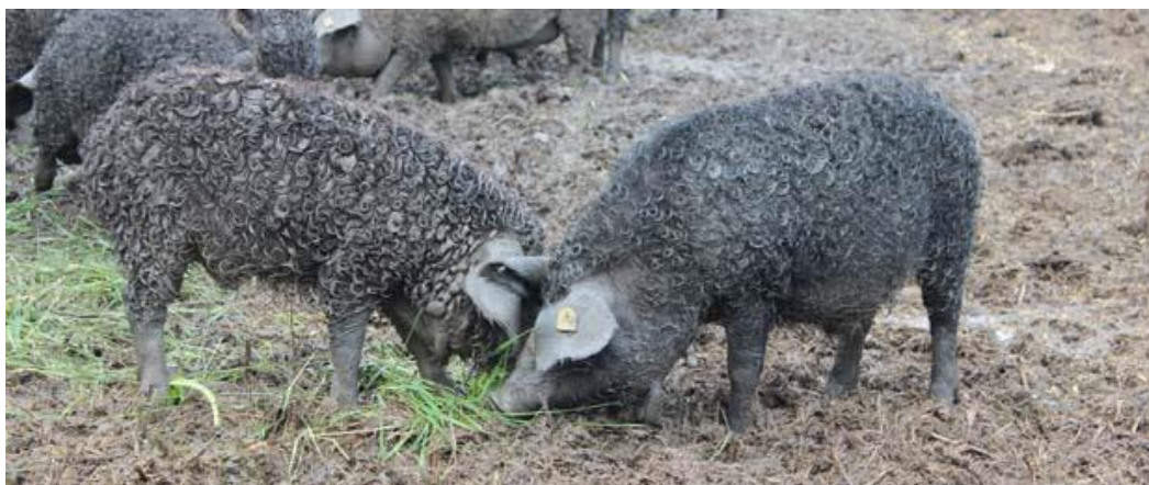
Slika 7. Mangulica