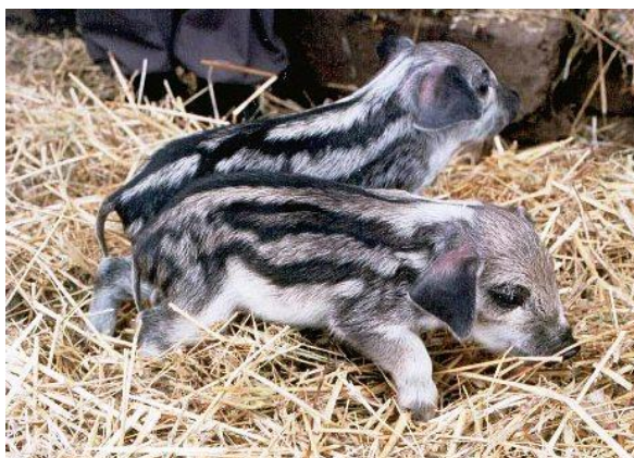
Slika 6. Prasad mangulice

skromnijim uvjetima držanja i slabijoj kakvoći hrane ( Uremović Z., Uremović M., 2002.). Danas je značajna u smislu očuvanja autohtonih pasmina i njihova genoma. Uzgoj magulice održao se u Mađarskoj.