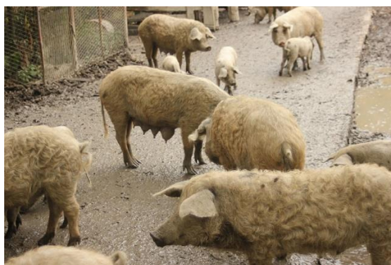
Slika 10. Turopoljska svinja

Uz crnu slavonsku svinju, turopoljska svinja također spada u autohtonu pasminu koja je nastala na području Turopolja. Pripada primitivnim pasminama svinja, te u masnu pasminu. Tijelo je duboko i kratko, obraslo kovrčavom dlakom, žućkasto prljave boje s crnim mrljama (Kralik 2011.) te je koža nepigmentirana (Kralik, 2007.). Plodnost je srednja te krmača prasi 6 do 7 prasadi u leglu. Prasad s 8 tjedana dostižu 12 kg, a sa 6 mjeseci 40 kg. Tovljenici postižu 150 do 160 kg sa 16 – 18 mjeseci s visokim randmanom od 85 % (Uremović Z., Uremović M., 2002.). Vrlo otporna pasmina i pogodna za ekstenzivan uzgoj.