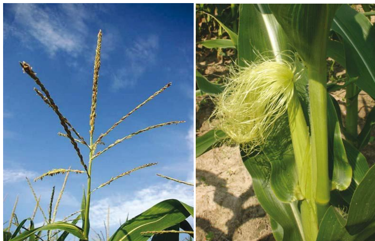
Slika 4. Muški cvijet kukuruza. Slika 5. Ženski cvijet kukuruza.

izdanaka iz točke rasta u pazuhu listova na glavnoj stabljici, a može i na zapercima. Klip se sastoji od zadebljalog vretena (oklasak) na kojem se uzdužno u parnim redovima nalaze klasići sa ženskim cvjetovima. Vreteno klipa (oklasak) nalazi se na dršci klipa, a u zreлом stanju različite je boje, od bijele do raznih nijansi crvene boje te čini 18-20% od ukupne mase klipa. Broj redova parnih klasića može se kretati od 4-32. Kod većine naših hibrida se kreće od 8-20. Uvijek je paran, a vezan je za paran broj klasića na vretenu klipa. Tučak se sastoji od plodnice, dugog vrata i još duže njuške (svila). To su dugačke svilenkaste niti prekrivene dlačicama. Dlačice izlučuju ljepljivu tekućinu, koja pomaže hvatanju polenovih zrnaca nošenih zračnim strujanjima. Polen, koji padne na bilo koji dio "svile", sposoban je izvršiti oplodnju. Nakon oplodnje potamni i suši se.