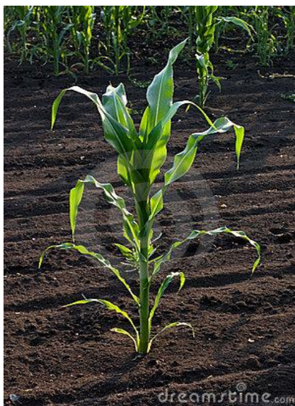
Slika 2. Stabljika kukuruza

Članci stabljike pokriveni su rukavcima listova u čijim se pazusima zameću točke rasta (pupovi) bočnih izdanaka. Iz ovih bočnih pupova na donjim, a posebno podzemnim, koljencima mogu se razviti sekundarni izdanci slične građe kao i glavna stabljika, koji se kod kukuruza naziva zaperci. Formiranje zaperaka karakteristika je nekih skupina kukuruza i nekih hibrida, poglavito vrlo ranozrelih, ali i neki drugi čimbenici (uvjeti tla, gustoća sjetve, način sjetve, rok sjetve, dužina dana, intenzitet osvjetljenja) imaju utjecaja na formiranje zaperaka. Iz preostalih pazušnih pupova formiraju se začeci klipova od kojih se obično 1-5 potpuno razvije, a nalaze se oko sredine visine stabljike.