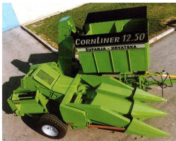
Slika 8. Berač komušać

Komušaćki stol sastoji se od 12 komušaćkih valjaka, 6 metalnih i 6 gumenih, iznad kojih su gumene rotirajuće zvijezde i jedno vratilo sa šest gumenih lopatica. Ispod kombajna je sječka sa 36 noževa koja sječka kukuruzovinu i ravnomjerno ju raspoređuje po polju.