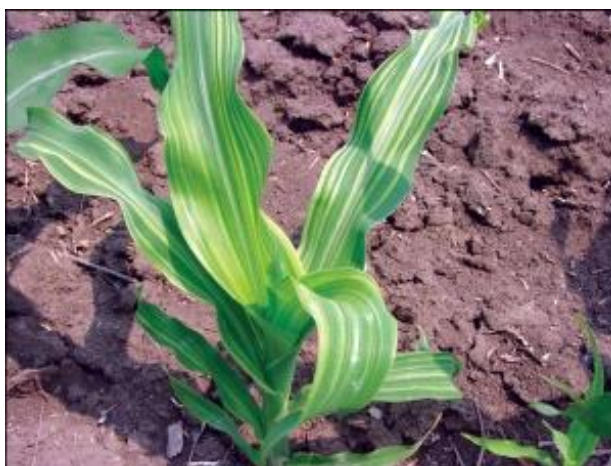
Slika 3. List kukuruza

Listovi se, prema mjestu gdje se zameću i nalaze te prema značaju, dijele na klicine listove, prave listove (listovi stabljike) i listove omotača klipa (listovi "komušine"). Klicini listovi imaju svoje začetke u klici sjemena. Ima ih 5-7, a potpuno se razviju u prvih 10-15 dana nakon nicanja kukuruza. Nakon što se formiraju pravi listovi, klicini listovi gube svoj značaj i veći dio ih propadne odnosno osuši se u prvom dijelu vegetacije. Pravi listovi (Slika 3.) nalaze se na stabljici. Na svakom koljencu nalazi se po jedan list, pa njihov broj varira kao i broj koljenaca. Najraniji hibridi u nas formiraju 13-18 listova, srednje kasni 18-21, a kasni 21-25. Listovi omotača klipa ili listovi "komušine" razvijaju se na koljencima skraćenog bočnog izdanka odnosno na dršci klipa. Listovi komušine imaju zaštitnu ulogu, jer štite klip i zrna na njemu od uzročnika bolesti, štetnika, ptica kao i nepovoljnih vanjskih čimbenika (Pospišil, 2010.).