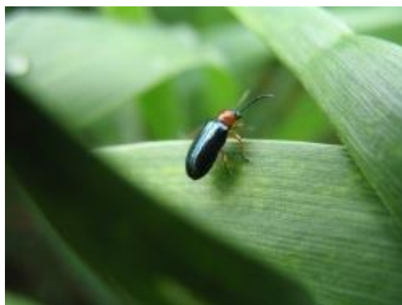
Slika 4. Oulema melanopus imago