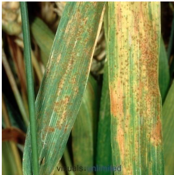
Slika 13. Puccinia recondita (foto: http://visualsunlimited.photoshelter.com/image/I0000ddarQYVKzCw )

Suzbijanje - Sjetva tolerantnijih sorata, primjena fungicida.