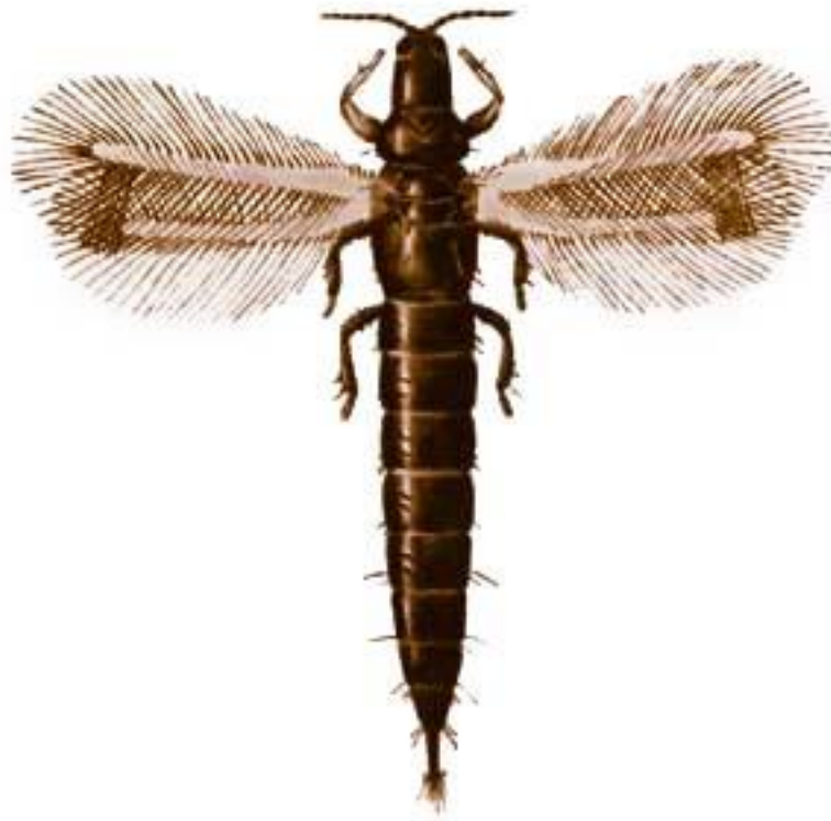
Slika 7. Haplotrips tritici

Suzbijanje – Primjenom kemijskih sredstava.