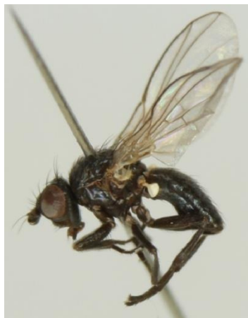
Slika 5. Agromyza luteitarsis

Suzbijanje – Primjena kemijskih sredstava, ali nije baš dobra jer može uništiti i korisne kukce, najefektivniji način je upotreba parazitskih osica.