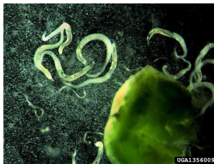
Slika 8. Anquina tritici

Suzbijanje - Plodored te sjetva deklariranog zdravog sjemena.