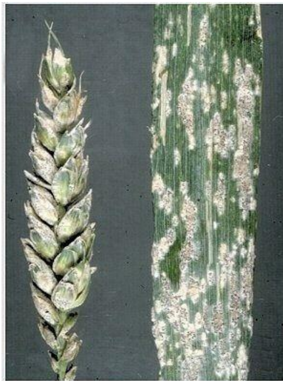
Slika 11. Erysiphe graminis

Suzbijanje - tretiranje fungicidima, izbalansirana gnojidba, plodored, sjetva otpornih sorata, te izbjegavanje gustog sklopa.