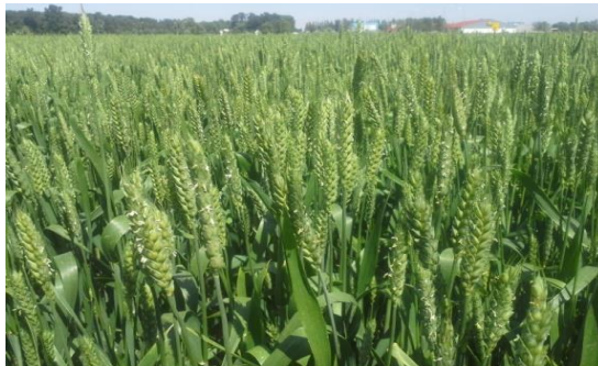
Slika 17. Sorta pšenice Katarina