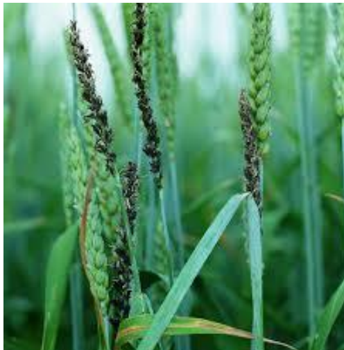
Slika 16. Ustilago nuda tritici

Suzbijanje - sjetva otpornih sorata, odstranjivanje snjetljivih klasova, što je efikasno kod uzgoja sjemenske pšenice. Sjetva tretiranog sjemena, aprobacija sjemenskih usjeva.