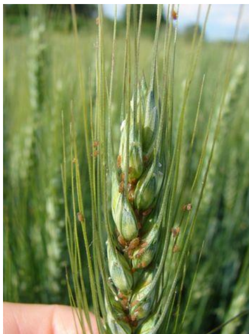
Slika 6. Lisne uši na klasu

Suzbijanje – U primjenu kemijskim sredstvima se ide ako je zaraženost lisnim ušima 20 – 30%. Treba obratiti veliku pozornost ako se ustanovi prisutnost prirodnih neprijatelja lisnih ušiju kao što su božje ovčice (bubamare), jer su im one prirodni neprijatelj. Preporučljivi su selektivni insekticidi zbog prirodnih neprijatelja lisnih ušiju kako ih se nebi uništilo.