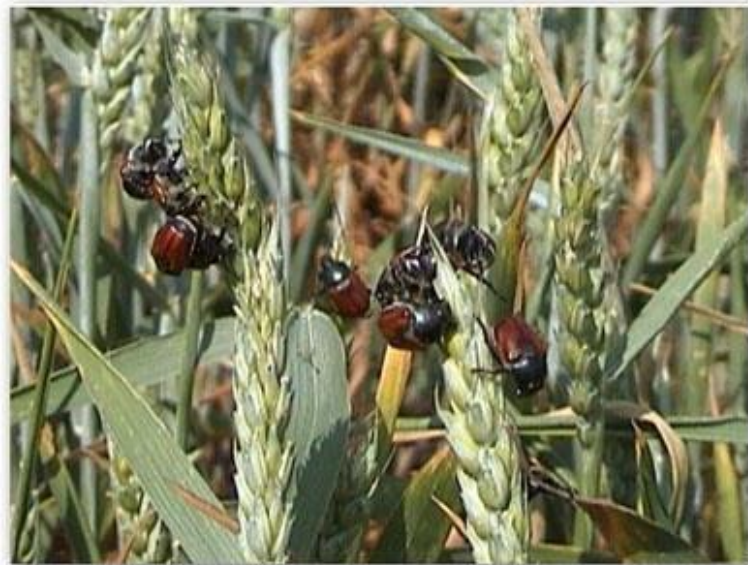
Slika 2. Anisoplia spp.

Suzbijanje - Preoravanje ruba polja strništa, jer u kolovozu ženka na tim mjestima odloži jaja, te se tada mogu uništiti. U slučaju masovne pojave žitnog pivca, primjenjuju se odgovarajući insekticidi (Ivezić 2008.).