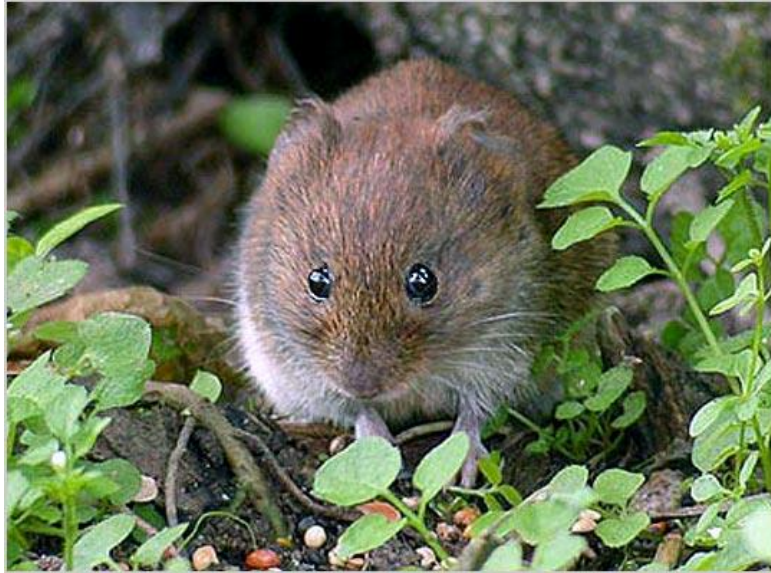
Slika 10. Microtus arvalis

Suzbijanje – za suzbijanje se koriste rodenticidi.