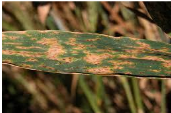
Slika 14. Septoria nodorum

Suzbijanje - Agrotehničke mjere borbe (plodored, zaoravanje zaraženih ostataka, izbalansirana gnojidba), tretiranje sjemena fungicidima.