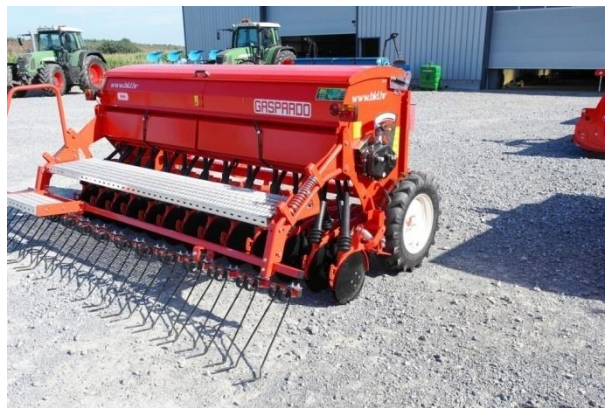
Slika 19. Sijačica GASPARDO