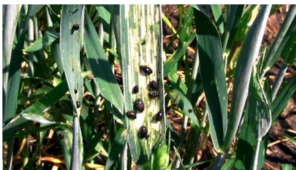
Slika 3. Oulema melanopus ličinka

Suzbijanje - Jedna od preventivnih mjera je duboka jesenja obrada tla, gdje se žitni balac unosi u dublje slojeve i tako se uništava. Kod jačeg napada tijekom vegetacije, osnovno suzbijanje ličinki vrši se kada je utvrđena 1 ličinka po zastavici. Ranim uočavanjem može se dobro suzbiti tretiranjem rubnih dijelova parcela, a kasnije cijelog usjeva. (Ivezić 2008.) Suzbijanje ovog štetnika obavlja se od sredine travnja.