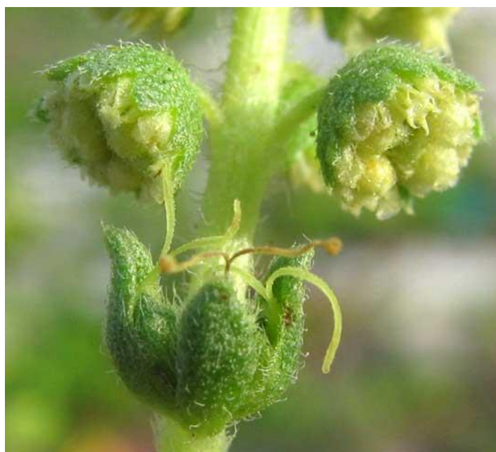
Slika 4. Muški i ženski cvjetovi ambrozije