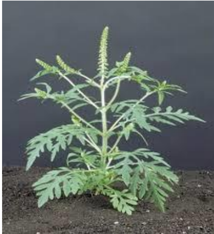
Slika 1. Ambrozija ( Ambrosia artemisiifolia L.)

Ambrosia artemisiifolia L. (pelinolisni limundžik, partizanka, fazanuša, Krausova trava) je jednogodišnja zeljasta biljka (Slika 1.).