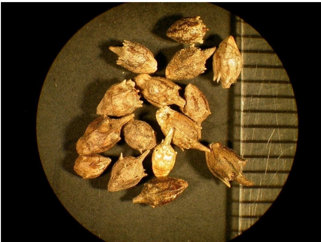
Slika 5. Roška

Plod ambrozije je okruglasto jajolika roška ili ahenija. Roška ima 5 do 7 zuba poput trnja, a središnji zub je najveći (Slika 5.).