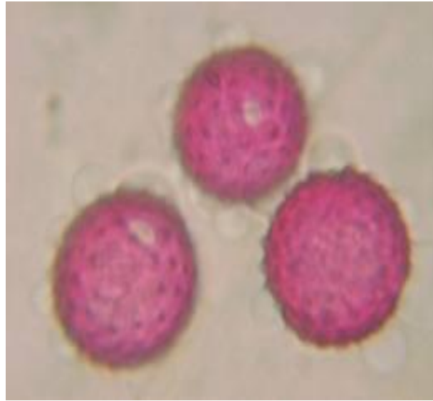
Slika 6. Peludna zrnca ambrozije

Pelud ambrozije je aeroalergen i najčešći je uzročnik ljetnih polinoza, te je jedna od najranije prepoznatih alergena (Slika 6.).