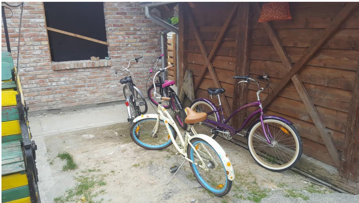
Slika 6. Dodatni sadržaj na imanju, (vlastita fotografija 04.06.)

vina, ljenčarenje na ležaljka, sudjelovanje u radovima u domaćinstvu, karaoke, tamburaška ili romska glazba po izboru gosta.