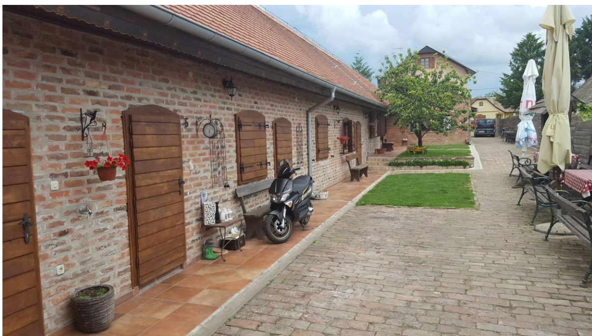
Slika 8. Izgled imanja, (vlastita fotografija, 04.06.)

Iz svega navedenoga kroz Porterov model konkurentnosti da se zaključiti da ono što drugi u vezi konkurencije smatraju kao nepogodnost, seljačka gospodarstva, te poduzetnici u mjestu Karanac i okolici su to prebacili u svoju korist. Sa promoviranjem svega što imaju proširuju ponudu i ne boje se konkurencije, a nivo prijetnje konkurencije i novih konkurenata je ocijenjen vrlo nisko.