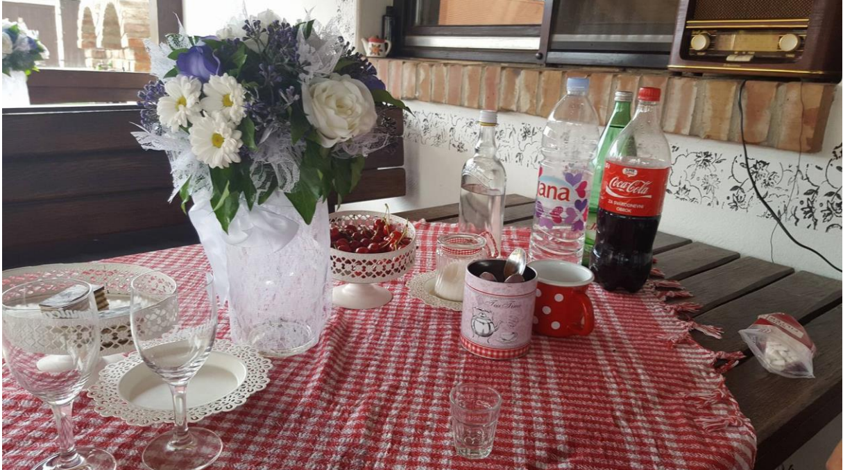
Slika 7. Ponuda na imanju

i raznolikost ponude jer svakom gostu omogućavaju da odabere nešto za sebe i da se kroz raznolikost ponude može iznova i iznova vraćati.