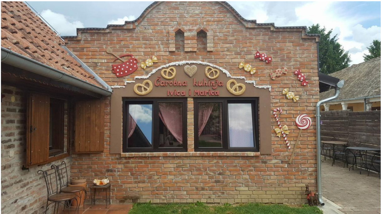
Slika 5. Izgled imanja

Gospođa Nada Piljići i gospodin Marko Piljić zajedno sa sinom rade obiteljski, te sami obavljaju cjelokupni posao, no kako gospođa Nada navodi surađuju sa drugim OPG-ovima, čak štoviše sa susjedima. Jedni proizvode aroniju, drugi se pak bave lješnjacima, te smatra da su napravili dobru stvar, te kako su ih zbog toga susjedi u mjestu bolje prihvatili, jer su uključili širu zajednicu.