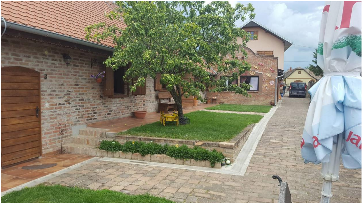
Slika 2. Prikaz imanja, (vlastita fotografija, 04.06.)