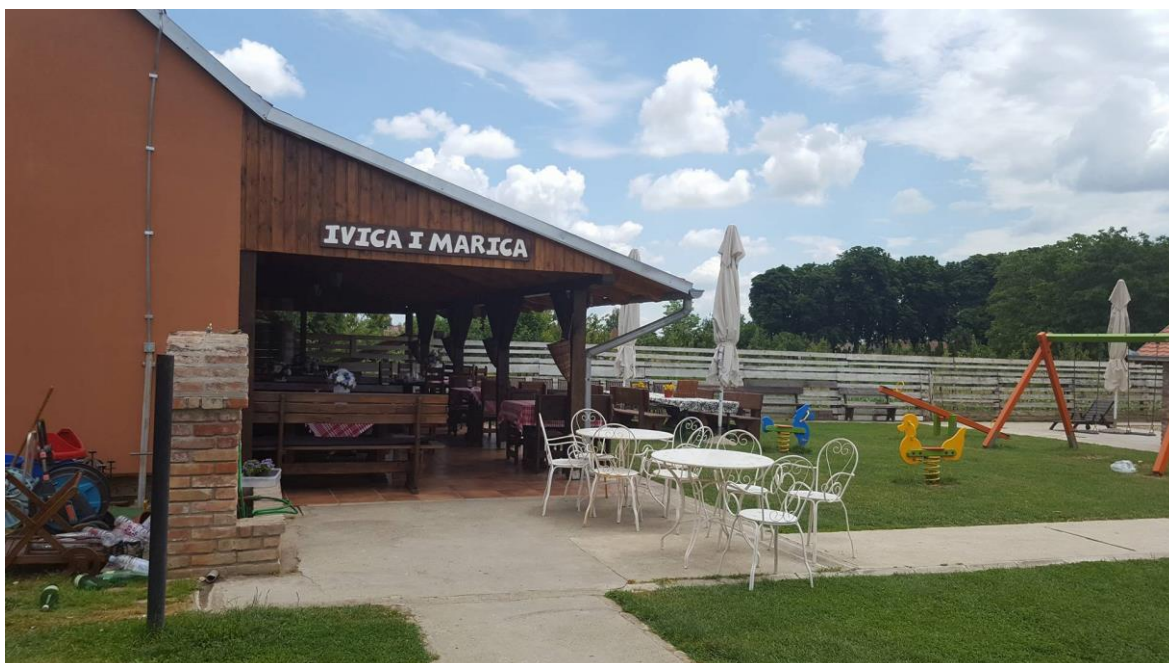
Slika 3. Izgled imanja, (vlastita fotografija, 04.06.)

Posebni oblici ruralnog turizma su turizam na seljačkim gospodarstvima, rezidencijalni turizam, zavičajni turizam, sportsko-rekreacijski turizam, avanturistički turizam, zdravstveni turizam, edukacijski turizam, tranzitni turizam, kamping turizam, nautički kontinentalni turizam, kulturni turizam, vjerski turizam, lovni turizam, ribolovni turizam, vinski turizam, gastronomski turizam, prirodi bliski turizam, ekoturizam, mješovite i ostale vrste turizma. 22