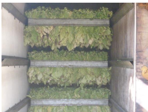
Slika 13. Punjenje sušare s duhanom

Tek ubran list duhana sadrži 90% vode i 10 % suhe tvari. Sušionice se ravnomjerno pune i hermetički zatvaraju (slika 13.).