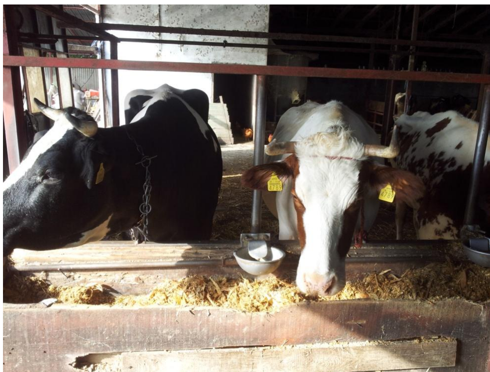
Slika 8. Držanje krava na vezu