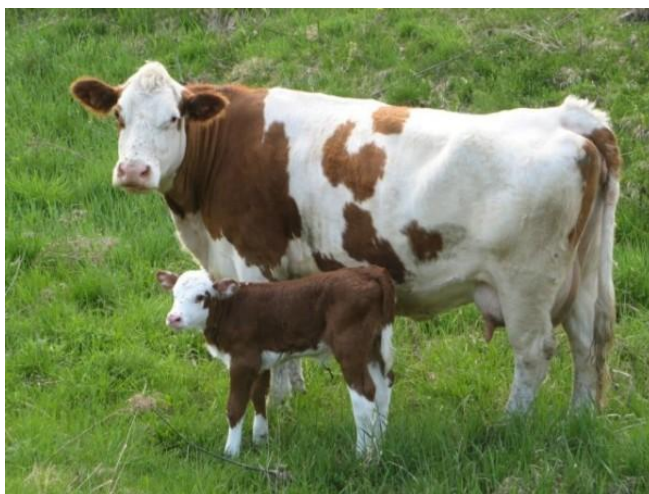
Slika 2. Krava simetalske pasmine

Simentalska pasmina na području Hrvatske uvezena je krajem 19. stoljeća u Križevce. Danas je simentalska pasmina najzastupljenija u Republici Hrvatskoj iako je njihov broj u znatnom padu u zadnjih 20-ak godina. Simentalska pasmina u Republici Hrvatskoj uzgaja se kao kombinirana pasmina što znači da se uzgaja i za meso i za mlijeko. Simentalska pasmina nastala je na području Švicarske (dolina rijeke Simme). Boja ove pasmine je od svijetložute do crvene sa bijelim šarama. Simentalac je pogodan za pašu zato je najbrojnija pasmina u nizinskim dijelovima Hrvatske. Standardna laktacija (305 dana) simentalske pasmine prema podacima HSC (2003.) iznosila je 4618kg mlijeka. Prosijek godišnje proizvodnje simentalske pasmine iznosi 4000 - 5000kg mlijeka. Odnos prednje i zadnje četvrti kod simentalca nije idealan za strojnu mužnju međutim to se nastoji popraviti selekcijom.