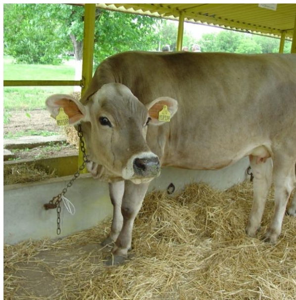
Slika 4. Krava smeđe pasmine

Smeđa pasmina goveda najmanje je zastupljena u Republici Hrvatskoj, a potječe iz Švicarske i Austrije. Ova pasmina uzgaja se u unutrašnjosti Dalmacije, Lici, u Istri i u Gorskom Kotaru. Smeđa pasmina pogodna je za ekstezivan govedarski uzgoj. Smeđa pasmina otporna je te je pogodna za uzgoj na planinskim pašama. Krave smeđe pasmine uzgajaju se kao kombinirana pasmina (za proizvodnju mlijeka i mesa). Godišnja proizvodnja mlijeka u laktaciji od 305 dana je mala i iznosi 3.500 - 4000 kg.