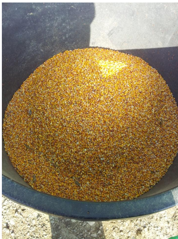
Slika 5. Kukuruz

Hranidba krava jedna je od najvažnijih faza u govedarskoj proizvodnji, zato je potrebno poznavati tehnološke faze proizvodnje. Tehnološke faze proizvodnje su: suhostaj, telenje i pueperij, laktacija. U govedarskoj proizvodnji koriste se različita krmiva ovisno o godišnjem dobu. Neka od krmiva koja se koriste u hranidbi su: kukuruz, lucerna, sijeno, sjenaža i druga. U ljetnom periodu krave se najčešće hrani pašom koja obiluje hranjivim tvarima, a kretanje na svježem zraku povoljno djeluje na plodnost, kondiciju i zdravlje krave.