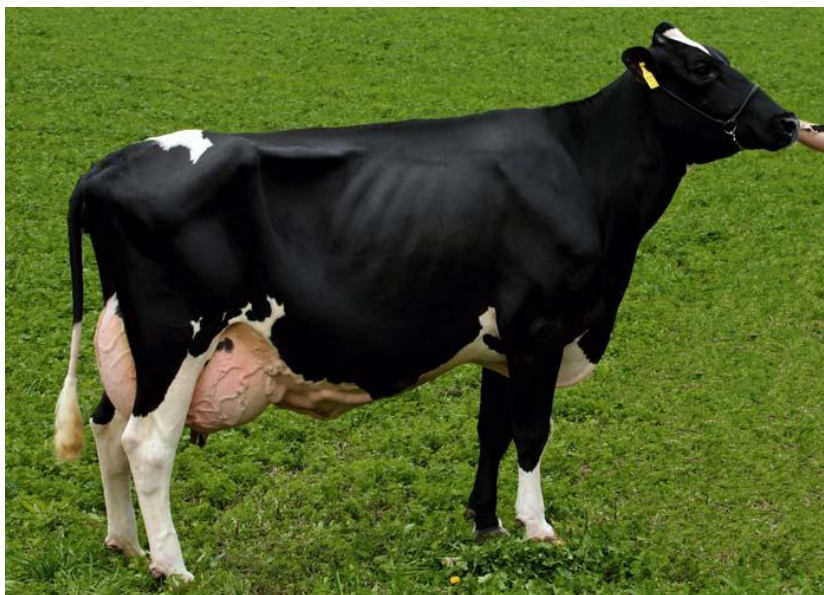
Slika 3. Krava holstein pasmine

Holstein pasmina druga je najzastupljenija pasmina u Hrvatskoj. Ova pasmina uzgaja se isključivo zbog mlijeka. Na velikim farmama uzgajaju se isključivo krave holstein pasmine, dok se na malim farmama uz mali broj krava holstein pasmine uzgajaju i krave simentalske pasmine. Holstein pasmina manje je otpornija od simentalske pasmine, zbog toga je njezin broj u Hrvatskoj manji u odnosu na simentalsku pasminu. Ova pasmina nastala je u pokrajini Frizija i odlikuju je neke karakteristike kao što su crno-bijela boja i velika godišnja proizvodnja mlijeka od oko 8.500kg u laktaciji od 305 dana, ali ova pasmina može proizvesti i više od 10.000kg mlijeka što predstavlja najveću proizvodnju mlijeka. Hranidba ove pasmine zasniva se na kvalitetnim voluminoznim krmivima sa određenom količinom koncentrata. Zbog manje otpornosti holstein pasmina je podložna mastitisu.