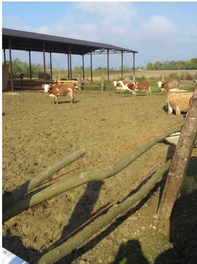
Slika 9. Slobodan način držanja krava

Kada se krave drže na slobodan način potrebno je izgraditi zaklon kako bi se krave sklonile od kiše i vjetra, i kako bi imale prostor pod krovom na koji će im se davati hrana, a da se ne smoći od kiše ili snijega.