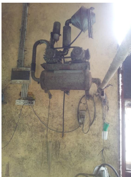
Slika 6. Muzni uređaj (stacionirani dio)

Kako ne bi došlo do zagađivanja mlijeka vrlo je važna higijena mužnje. Čimbenici koji utječu na sastav mlijeka su broj somatskih stanica i broj mikroorganizama.