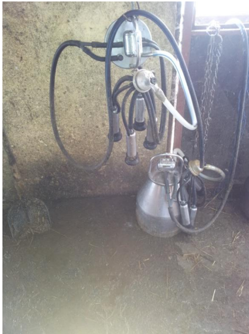
Slika 7. Muzni uređaj (pokretni dio)