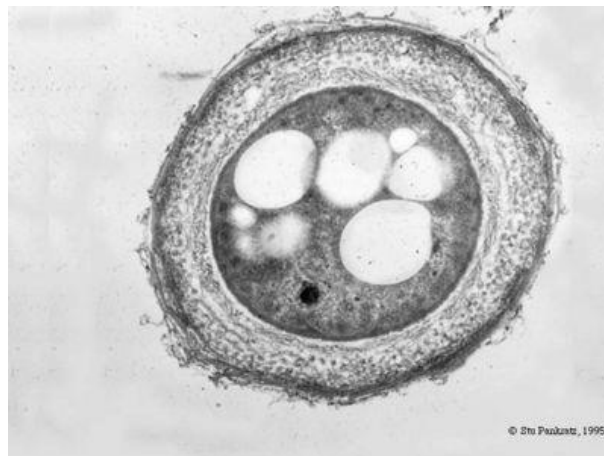
Slika 4. Bakterija Azotobacter chroococcum u stadiju ciste

Organizmi kao što su Azotobacter igraju vitalnu ulogu u svakom ekosustavu, koji rade da bi dušik bio dostupan svim organizmima. Bakterije roda Azotobakter i slične bakterije mogu pretvoriti dušiku amonijak kroz proces fiksacija dušika, nakon čega se amonijak pretvara u proteine.