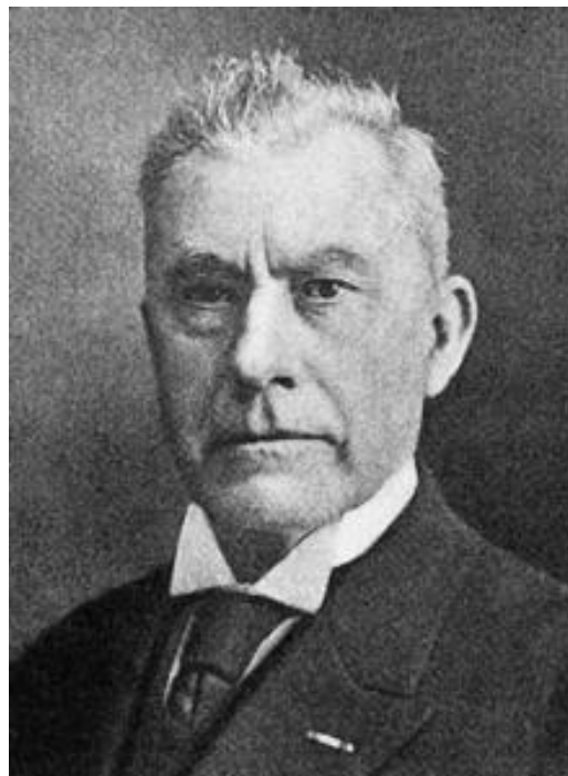
Slika 3. Martinus Beijerick

Azotobacter je rod korisnih bakterija koje se nalaze u neutralnim do lužnatim tlima, u vodenim sredinama, a i na nekim biljkama. Unatoč hladnoj klimi i relativno niskoj pH vrijednosti njihova prisutnost može se utvrditi i na Antartiku. U suhim tlima vrsta roda Azotobacter u obliku cista mogu preživjeti i do 24 godine. Rod Azotobacter otkrio je 1901. godine Martinus Beijerick. Ona ima nekoliko metaboličkih mogućnosti, uključujući i atmosfersku fiksaciju dušika konverzijom u amonijak.