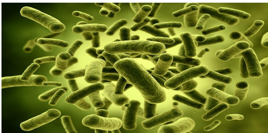
Slika 1. Bakterije

Oblik bakterijske stanice može biti sferičan (koki), štapićast (bacili) ili spiralan (spirili). Neke vrste bakterija poput aktinomiceta nalikuju micelijima gljiva, a nitastog oblika su oblika. Oblik, boja i veličina bakterijske kolonije važna su svojstva (fenotip) vidljiva na krutoj hranjivoj podlozi (agarskoj ploči).