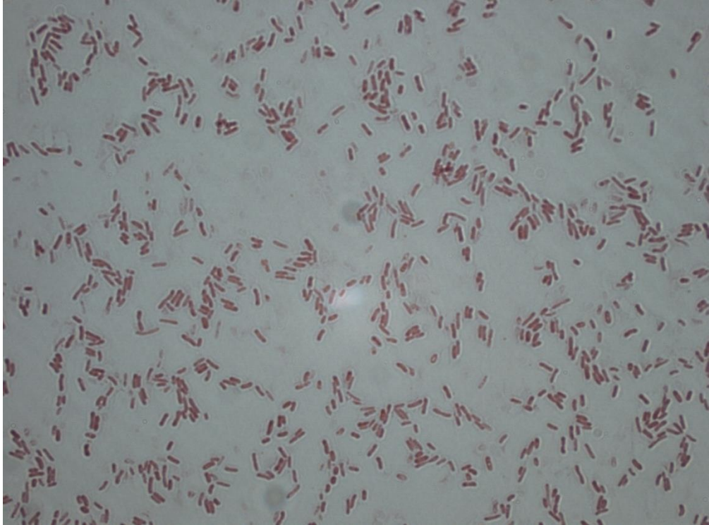
Slika 2. Azospirillum brasilense

Prema znanstvenicima Tarrand i sur. (1978.) rod Azospirillum je u početku podijeljen na dvije vrste: