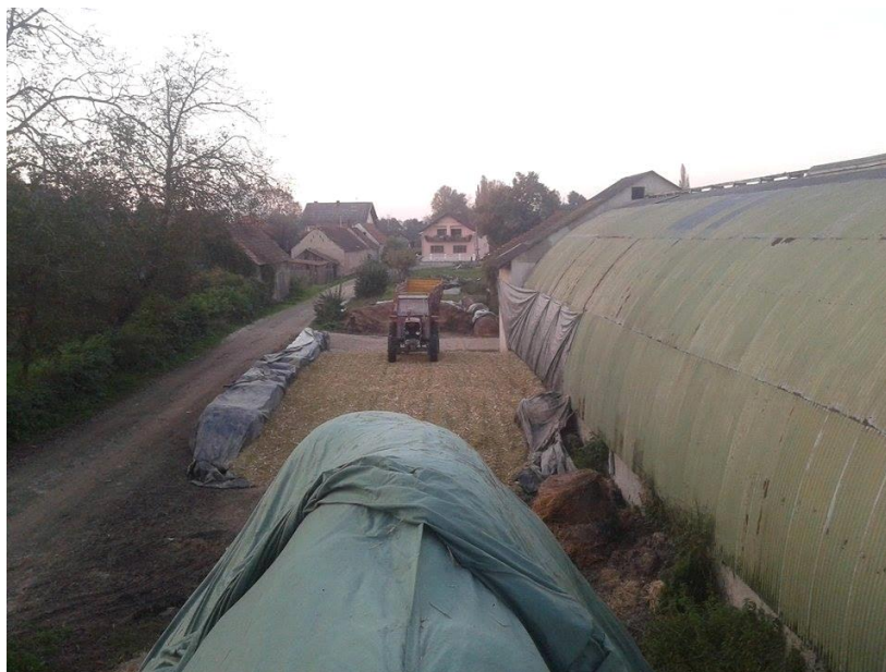
Slika 4. Silaža kukuruza na istraživanom OPG-u