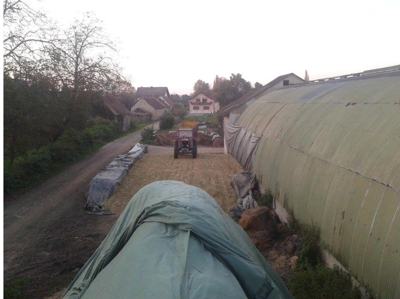
Slika 4. Silaža kukuruza na istraživanom OPG-u