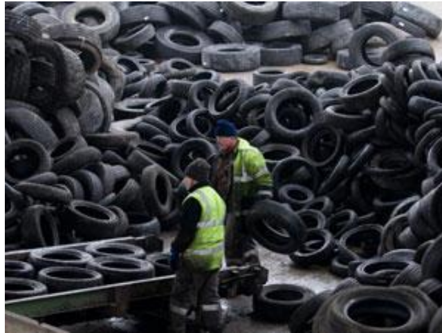
Slika 8. Recikliranje guma

sakupljanje, uporabu i recikliranje otpadnih guma koje su tvrtke dobile temeljen Dozvole za gospodarenje otpadom. Tvrtke koncesionari potpisali su ugovor s Fondom za zaštitu okoliša i energetske učinkovitost čime su definirani uvjeti djelatnosti sakupljanja i uporabe otpadnih guma.