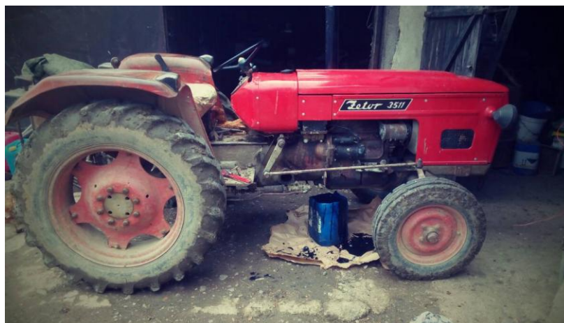
Slika 10. Ispuštanje ulja iz traktorskog motora

Rabljeno motorno ulje koristi za tehničku zaštitu poljoprivredne mehanizacije, iako uporaba istog za tehničku zaštitu nije dopuštena (Jurić i sur., 2001.)