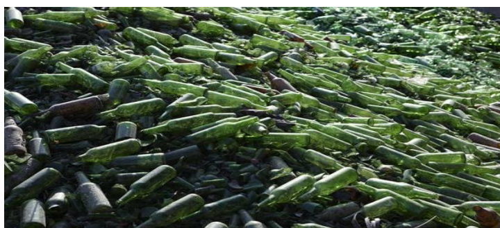
Slika 2. Recikliranje stakla

Staklo je vrlo pogodan materijal za recikliranje. Staklo čini udio 5 - 10 % komunalnog otpada. Reciklirano staklo može se koristiti za mnoge sekundarne namjene. Recikliranjem stakla postižu se velike uštede energije. Energija koja se uštedi recikliranjem jedne staklene boce, dovoljna je da žarulja od 100 W gori 4 sata. Odvojenim skupljanjem i recikliranjem staklenog ambalažnog otpada osigurava se ušteda prirodnih resursa te se smanjuje onečišćenje zraka, vode i tla.