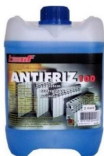
Slika 12. Antifriz

U ovu kategoriju spadaju različite tekućine koje sadrže opasne tvari (antifriz, tekućine za kočnice, tekućine za odmašćivanje i uklanjanje korozije, itd.). Otpadni antrifriz je najvažniji predstavnik. On je izrađen na bazi etilen-glikola. Opasnim ga otpadom čine zbog tragova teških metala i drugih tvari, kao što su olovo, kadmij, bakar, krom, živa, benzen i antikorozivni aditivi. Antifriz može biti smrtonosan za životinjski i biljni svijet ako dospije u kanalizaciju ili ako se proguta.