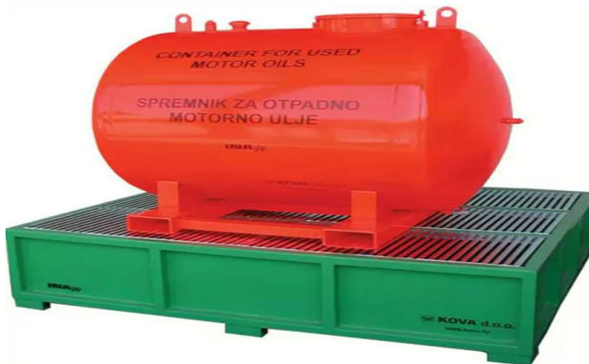
Slika 15. Spremnik za otpadno motorno ulje