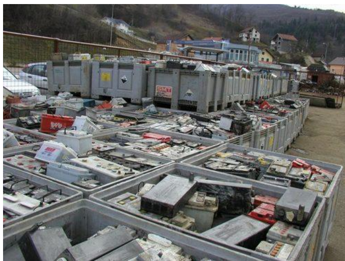
Slika 17. Spremnici za propisno skladištenje otpadnih akumulatora

Skladištenje starih akumulatora treba biti u zatvorenim prostorima, a ukoliko se isto provodi na otvorenom površina na kojoj se skladišti, površina mora biti nepropusna i zaštićena od mogućeg dotoka oborina ili istjecanja kiseline iz spremnika.