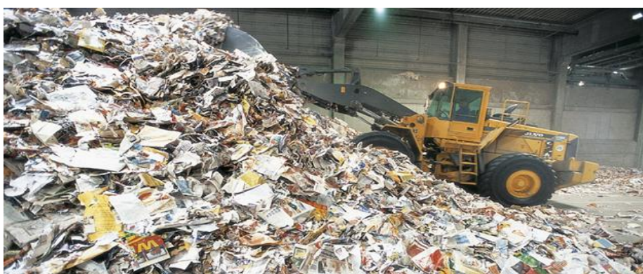
Slika 1 Recikliranje papira

Papir i karton čine prosječno 30 do 40 % komunalna otpada. Otpadni papir je vrijedna sirovina. Recikliranjem papira čuvaju se šume, štedi energija, smanjuje onečišćenje vode i zraka te štedi skupi deponijski prostor. Ako odvojeno prikupimo i recikliramo 1 tonu otpadnog papira, spasili smo 20 mladih stabala, uštedjeli oko 60.000 litara vode, potrošili upola manje energije i 15 puta manje onečistili otpadne vode.