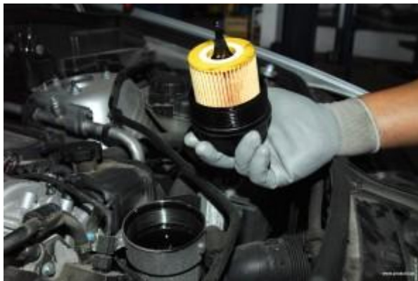
Slika 7. Otpadni filteri

Pri recikliranju otpadnog filtera dobijemo tri komponente: filter papir (~10%), čelik (~55%) i ulje (~35%). Papir natopljen uljem može se upotrijebiti kao gorivo jer ima visoku kaloričnu vrijednost. Izdvojeni čelik vrlo je kvalitetan i može se upotrijebiti u daljnjoj proizvodnji čelika, a ulje se može oporabiti na ranije opisani način.