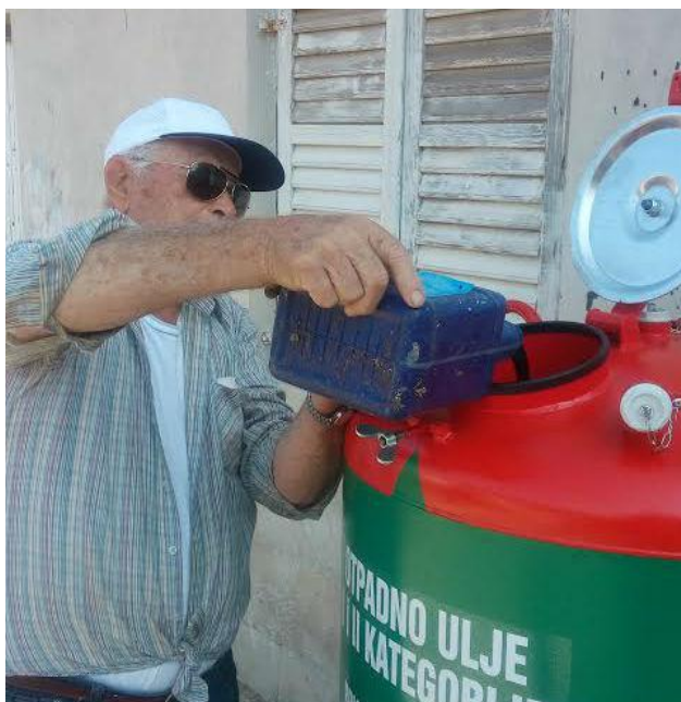
Slika 6. Odlaganje otpadnog ulja

Recikliranjem samo 8 litara otpadnog ulja zadovoljavaju se dnevne potrebe prosječnog domaćinstva za električnom energijom. Dakle, mogućnosti recikliranja otpadnih ulja vrlo je velika i zato je bitno oporabiti ih više, kako bi se sačuvao okoliš i smanjila potrošnja prirodnih resursa