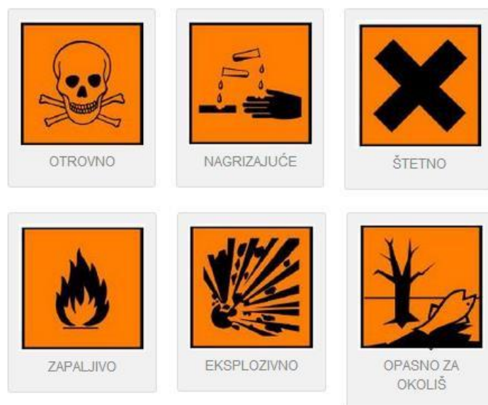
Slika 9. Neke od obilježja na opasnom otpadu