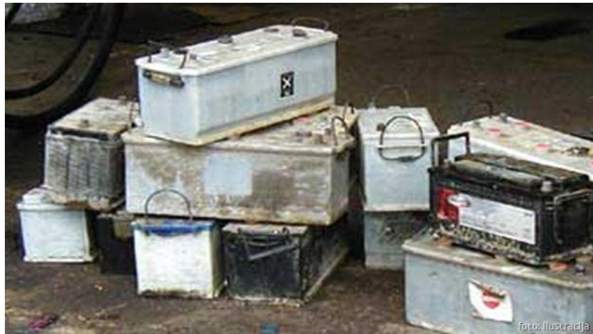
Slika 13. Otkup rabljenih akumulatora

Elektrolit je najčešće razblažena sumporna kiselina. S obzirom na sadržaj teških metala i kiselina, otpadni akumulatori predstavljaju iznimno jake onečišćivače okoliša i opasnost po ljudsko zdravlje, pa je stoga njihova kategorizacija kao opasnog otpada uobičajena, i to zbog više opasnih svojstava.