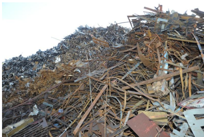
Slika 5. Metalni otpad

Sve se vrste metalnog otpada mogu više puta reciklirati. Stoga ih je potrebno odvojeno skupljati te odlagati u reciklažna dvorišta. Recikliranjem 1 tone aluminijskih limenki uštedi se 5 tona boksita i utroši se 20 puta manje energije. Za proizvodnju 1 tone sirovog aluminija utroši se čak 600.000 litara vode i 15.000 kWh električne energije.