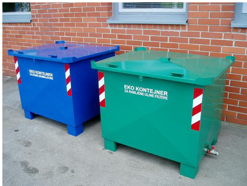
Slika 11. Kontenjeri za rabljenje uljne filtere