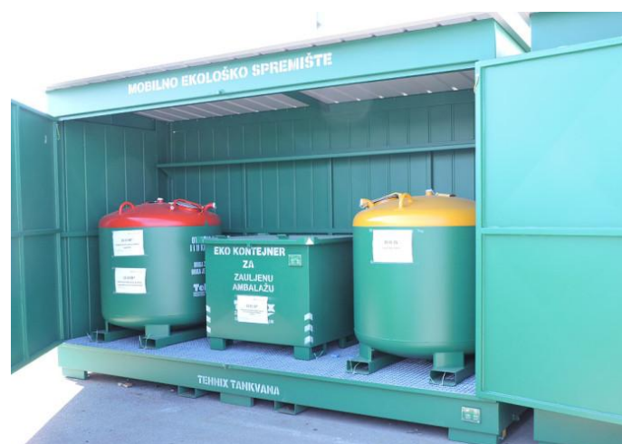
Slika 16. Spremnici za propisno skladištenje zauljenog otpada

Ministarstvo zaštite okoliša, prostornog uređenja i graditeljstva (MZOPU) dodijelilo je koncesije za obavljanje djelatnosti sakupljanja, kao i obrade i oporabe otpadnih baterija i akumulatora na području Republike Hrvatske. Dodijeljeno je 11 koncesija za sakupljanje te tri koncesije za obradu i uporabu otpadnih baterija i akumulatora. ( V. Š. Gvožđak, 2008.)