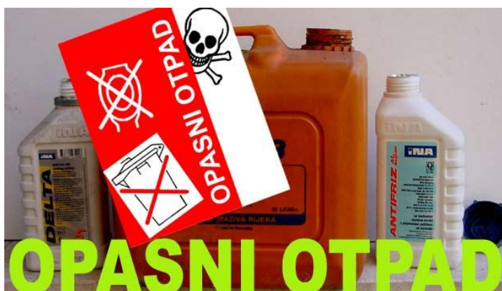
Slika 14. Ambalaža onečišćena opasnim tvarima

Kada potrošimo upakirano ulje, antifriz, mazivo, tekućina za kočnice, podmazani rezervni dijelovi i slično, oni i još uvijek u sebi zadrži određenu količinu prethodno sadržanih tvari, koje su imale neko od opasnih svojstava, pa ostaje onečišćena istima. S ambalažom se treba postupiti na odgovarajući način, a ne kao s običnom neopasnom ambalažom.